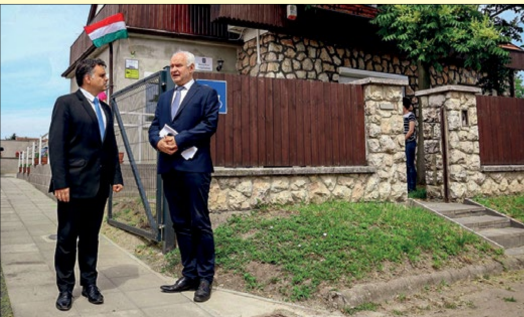
Latorcai Csaba és Herczeg Tamás a Mentál Plusz Szolgáltatóház átadásán

Új helyre költözött a Mentál Plusz Szolgáltatóház; idén is többen átvehetik a Tehetség Díjat; tovább fejlődhet a BSZC – ezúttal egyebek mellett ezekről kérdeztük Herczeg Tamás országgyűlési képviselőt.