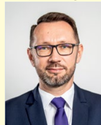
Varga Tamás alpolgármester