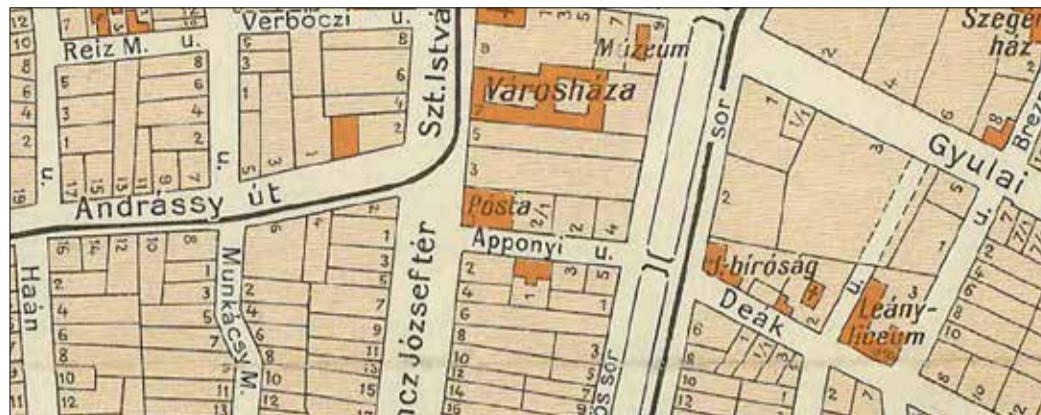
Békéscsaba város belterületének átnézeti térképe

Végéhez közeledett a Fábry Károly által írt helytörténeti sorozat a Körösvidék 100 évvel ezelőtti számaiban, legalábbis annak első felvonása. Az utolsó négy részből kiderült az is, hogy miért ez lett a címe az írásnak.