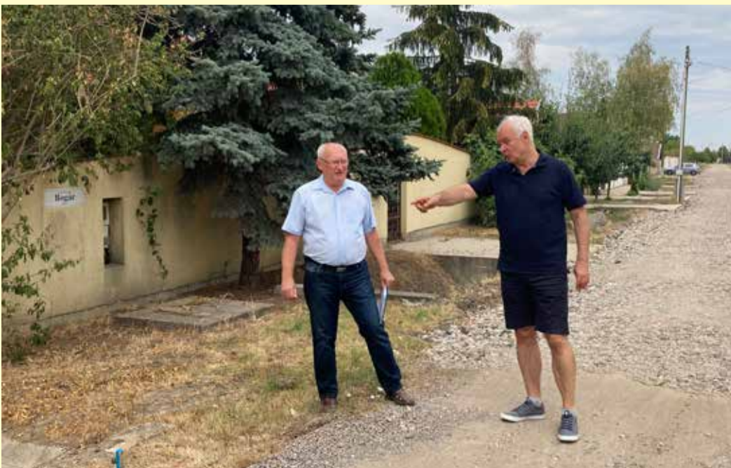
Herczeg Tamás: Az útépítési munkák jó ütemben haladnak, bizhatunk benne, hogy december végéig a programban szereplő valamennyi utca szilárd burkolatot kap

A koronavírus-járvány ötödik hulláma után már éppen kezdtek volna visszaállni a dolgok a megszokott kerékvágásba, azonban az orosz-ukrán háború átírta a terveket. Az ebből fakadó helyzetet mindenki érzi, egyrészt a pénztárcáján, másrészt a tekintetben is, hogy törékenyebb lett a biztonság, kevésbé tervezhető a jövő. Herczeg Tamás országgyűlési képviselővel egyebek mellett erről beszélgettünk.