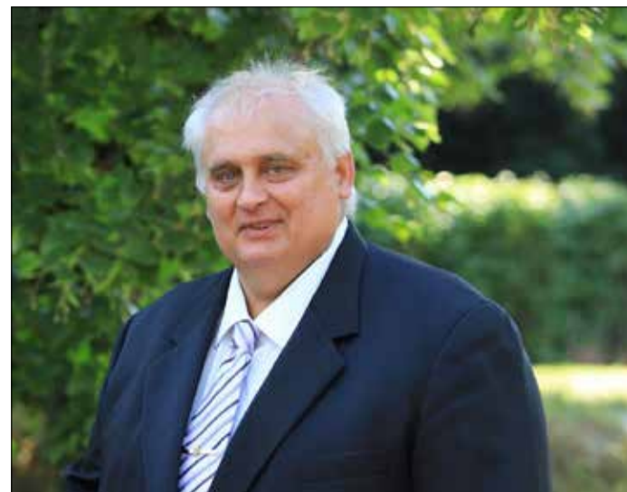
A mostani helyzetben a biztonságos gazdálkodás csak öntözéssel és szárazságtűrőbb növényekkel lehetséges

– Az utóbbi években valóban megfigyelhető, hogy egyre többször aszályos a nyár. Most annyira kevés csapadék esett, hogy az idejéig még ezek közül is kiemelkedik, néhány szakember szerint az évszázad aszálya pusztít most. Látható az is, hogy ott maradt meg például a kukorica, ahol nem vették túl sűrűre, mert ott a kevés csapadékot kevesebb töállomány szívta fel. Az is megfigyelhető, hogy ahol nagyon sokat műtrágyáztak, ott jobban kiégett a föld. A műtrágya akkor tud jól hasznosulni, ha van elég eső, ha viszont nincs, akkor az is csak éget. Ott tartunk tehát, hogy biztonságos gazdálkodást csak öntözéssel és szárazságtűrőbb növényekkel lehet megvalósítani. Magyarországon Békés megyében van a legnagyobb jó minőségű, összefüggő földterület, itt lehet a legjobb termést elérni akkor, ha mielőbb kiépítjük az öntöző-