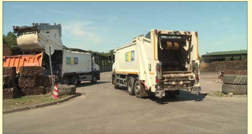
A szelektív hulladék a csabai válogatóközpontba érkezik, ahol optikával szortíroznak

Magyarországon a helyi önkormányzatokról szóló törvény feladat-meghatározása alapján, illetve a hulladékról szóló törvény alapján az önkormányzatok kötelessége helyben ellátni a hulladékgazdálkodási teendőket. Békéscsaba önkormányzata közszolgáltatási szerződés keretében, a Dareh Bázis Nonprofit Zrt. útján látja el ezeket a feladatokat.