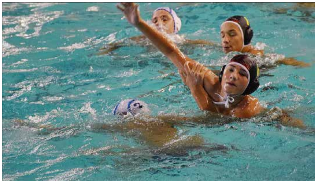
A Diapolo Kupán nyolc nemzet együttese mérték össze erejüket, tudásukat

Az ifjúságiak végeredménye: 1. Szentesi VK, 2. Vilnius (litván), 3. Swietelsky-Békéscsaba, 4. Zempléni VK Sárospatak, 5. Hapoel Beit Yitzhak (izraeli), 6. KÓPÉ Dunakanyar Waterpolo Leányfalu. A gyermek korosztályúak végeredménye: 1. Crisul Oradea Nagyvárad (román), 2. Szentesi VK, 3. Swietelsky-Békéscsaba, 4. Hapoel Beit Yitzhak (izraeli), 5. Zempléni VK Sárospatak, 6. Turun Uimarit Turku (finn), 7. Düsselndorf (német), 8. Aquasport Marosvásárhely (román), 9.