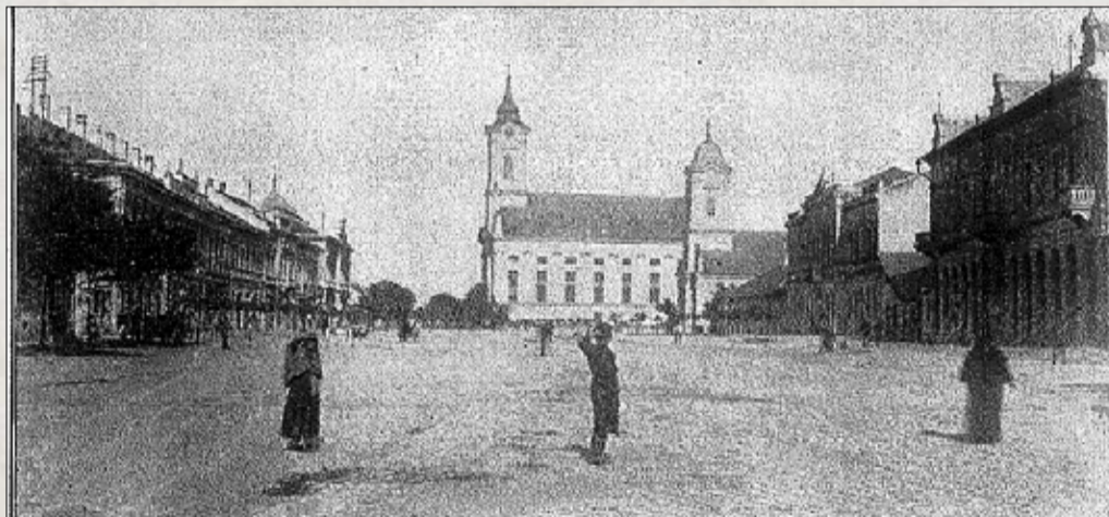
Divald Károly: Csaba főtere. Az összkép az, amelynek „városias” hangulata van, a kiépült járófelületekkel, emeletes épületekkel

A csabai urbanizáció e szakasza az 1850-es években kezdődött. Amikor 1852-ben Munkácsy Mihály gyermekként a városba került, az a városkép, amely a személe tárult, inkább keltette benne egy falu benyomását: „A város látképe csodálatba ejtett: hosszú-hosszú utca, egész alacsony, széles házzal, amelyek szalmafedelei mintha a földből nőttek volna ki.” Diszesebb épületekkel a templomokon kívül a Gyulai úton találkozhatott, a földszintes, de általa szépnek talált Urszinyi- és a Steiner-kúriákkal. Emeletes épületet Munkácsy akkor keveset láthatott Csabán. Láthatta az 1851-ben, a várostól bérelt földön, az ország harmadik gőzmalma-