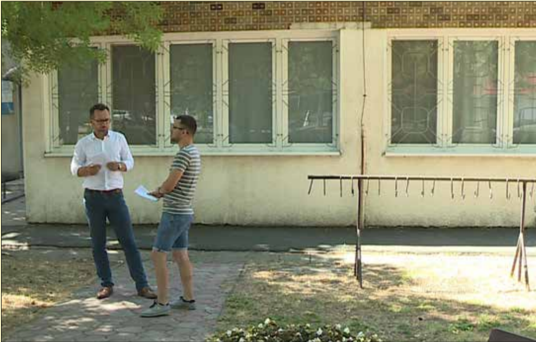
A Lencsésin található 25. számú körzetben októbertől új házi orvos látja el a betegeket

Az elmúlt másfél évben több tragikus haláleset miatt néhány házi orvosi praxis megüresedett Békéscsabán. Ezek pótlása eddig többnyire helyettesítésekkel történt meg, de hosszútávon az önkormányzat célja, hogy új szakemberekkel oldja meg ezt a fontos problémát. A Lencsési lakótelepen található 25. számú körzetben októbertől már új házi orvos látja el a betegeket.