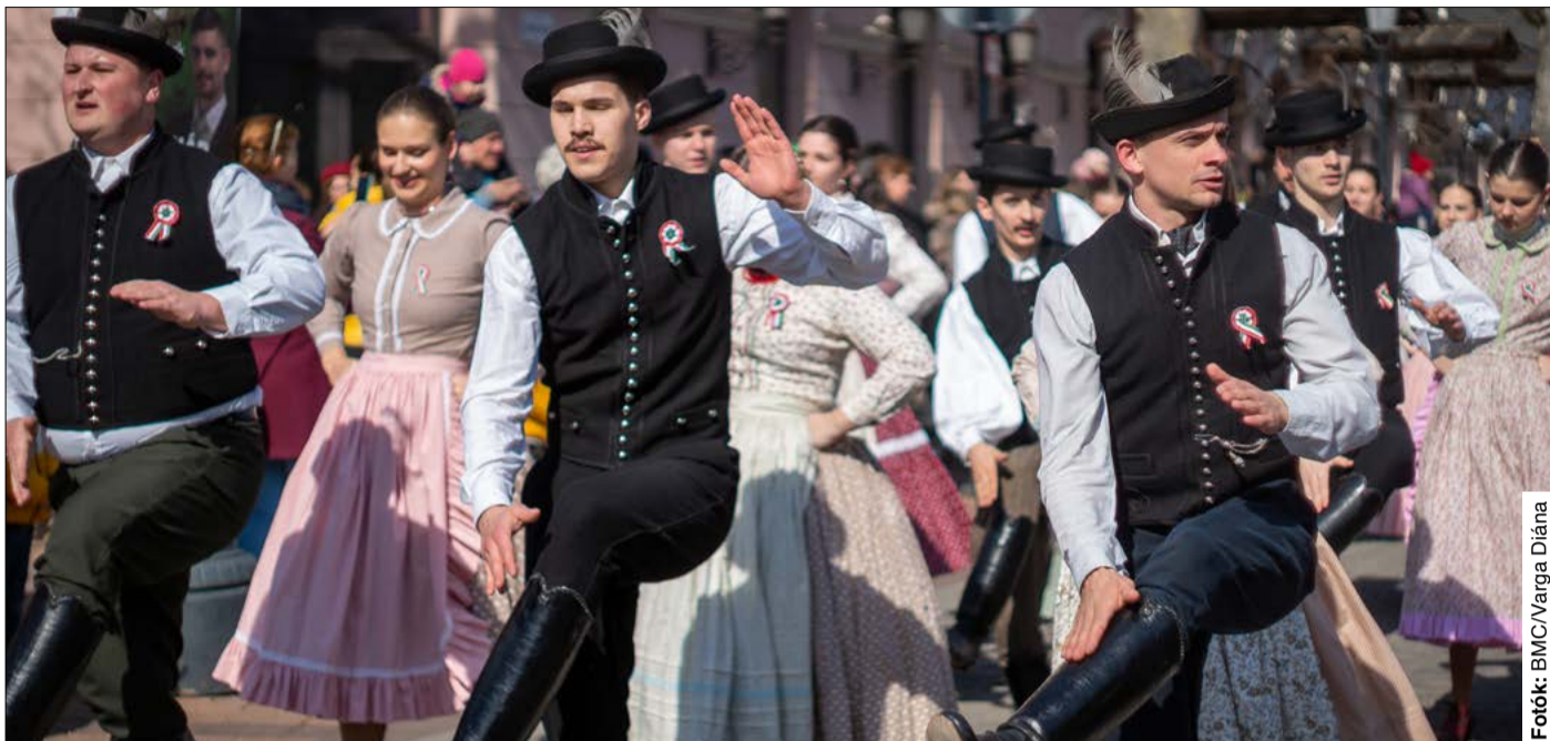
A tavaszi időben a néptáncosok és a hagyományörzők felvonulása is vonzotta az érdeklődőket

Kiemelte: vigyáznunk kell arra, hogy a történelemlapok lapjain úgy szerepeljen ez az időszak, hogy az unokáink elégedettek lehessenek velünk, a döntéseinkkel, az elhatározásainkkal. Megemlítette azt is, hogy tőlünk néhány száz kilométerre háború dúl, ezért ki kell állnunk szomszédunk szuverenitása mellett.