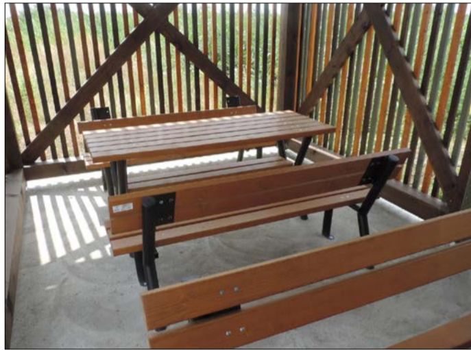
Ezeket a padokat és asztalokat lopták el

Békéscsaba Megyei Jogú Város Önkormányzata