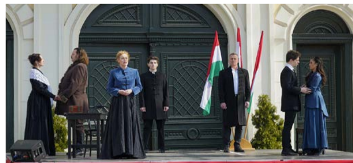
A színház Ragyogj te ébredő hazám címmel adott műsort