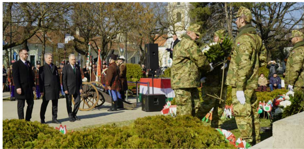
A város, a pártok és szervezetek képviselői is koszorúztak a Kossuth-szobor