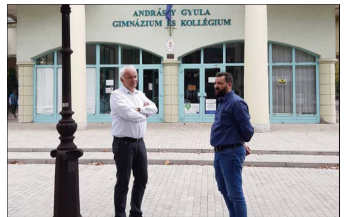
A kormány forrást biztosít az Andrassy gimnázium tornateremének tervezésére

– Megvalósulhat egy nagyon régen várt békéscsabai tornateremépítés. Az Andrassy gimnáziumnak régi, rossz minőségű és kicsi a tornaterme. Az elmúlt héten jelent meg a Magyar Közlönyben, hogy a kormány kilencvenmillió forintot biztosít az önkormányzatnak arra, hogy ennek a tornateremnek a tervezése elkezdődjön. Létrejött a Szerdahelyi és a Szabolcs utca találkozásánál az Agrárudvar, ami azért fontos és