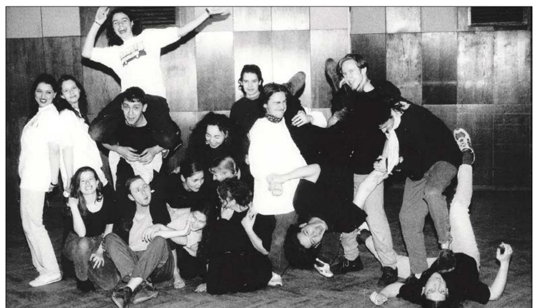
Ma már a negyvenes éveiket tapossák a képen látható egykori színistúdiósok