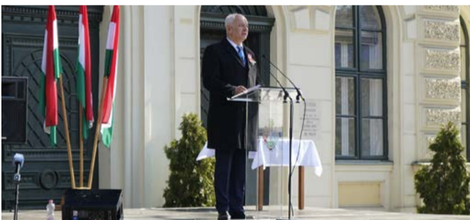
„Azokat ünnepeljük, akik a szabadságot választották”