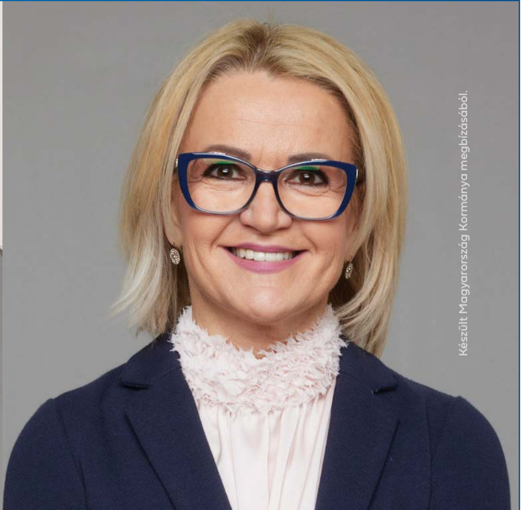
Készült Magyarország Kormánya megbízásából.