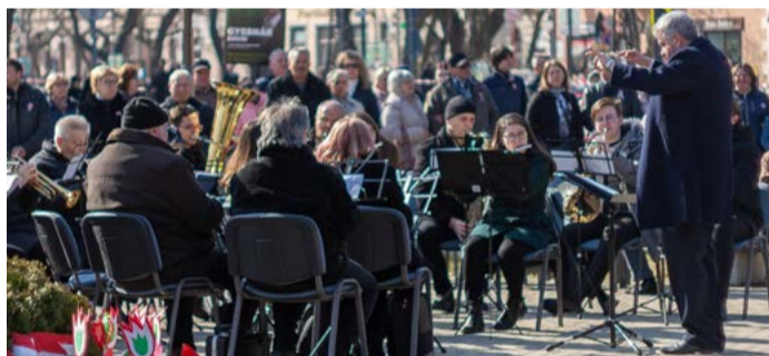
Térzene a Körösparti Vasutas Koncert Fúvószenekarral