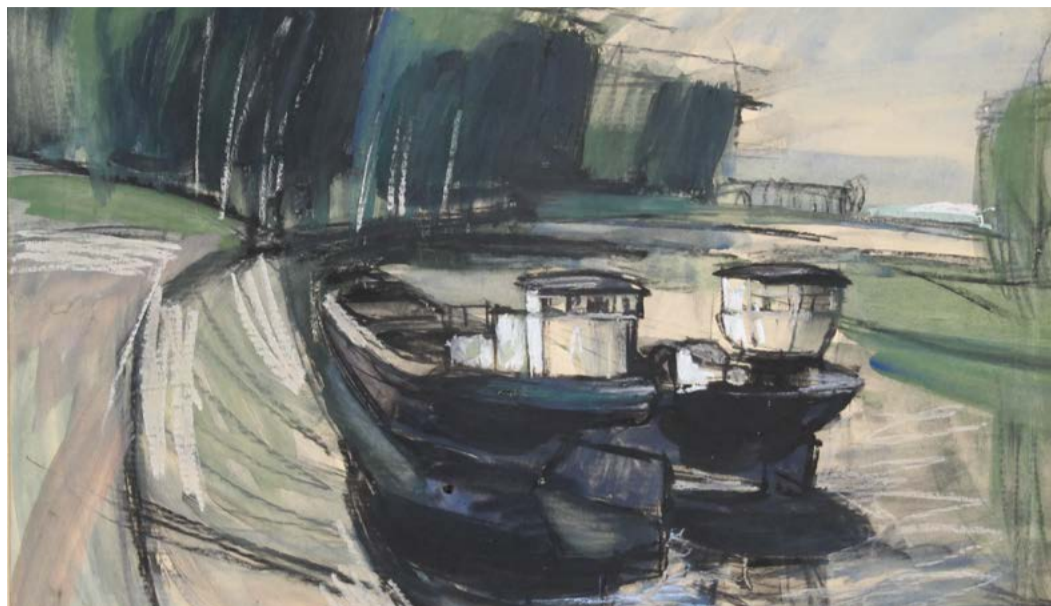
Ezüst György Uszályok című, 1965-ben született akvarellje a múzeum gyűjteményében