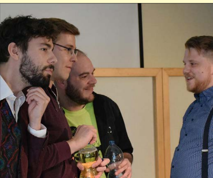
A Csabagyöngyében, az idei Impro Fesztiválon az Improlik csapata vitte el a pálmát

Mennyi csudálatos hóbort létezik! Például van, aki Impro Fesztiválra jár. Egy a lényeg: bárhová is megyünk, feltöltődve lépünk ki a történet kapuján.