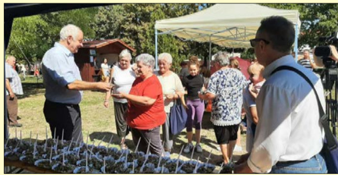
Brinzás, túrós, káposztás és mákos haluskát kínáltak