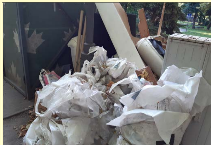
Jövőre már a Kétegyházi úti hulladékudvarba lehet vinni az építési törmelék, különböző lomokat

Jövőre készül el a békéscsabai hulladékudvar; elkezdődött a parlament őszi ülészeke; új, szegedi szakok érhetők el a Gál Ferenc Egyetem békéscsabai karán – erről és megye átoltottságáról beszélgettünk Herczeg Tamás országgyűlési képviselővel.