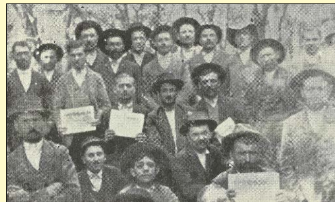
Építőipari munkások a ligeti sztrájkantányán

Békéscsaba iparosodása a 20. században a fellendülés szakaszába érkezett. A textil-, a bútort- és a téglapipar megjelenése a munkások létszámát növelte. A hosszú munkaidő, a nyomott bérek és a szociális körülmények már a 20-as években elégedetlenséget váltottak ki. Mindezek a várost a bérharcok, sztrájkok és tüntetések színterévé tették.