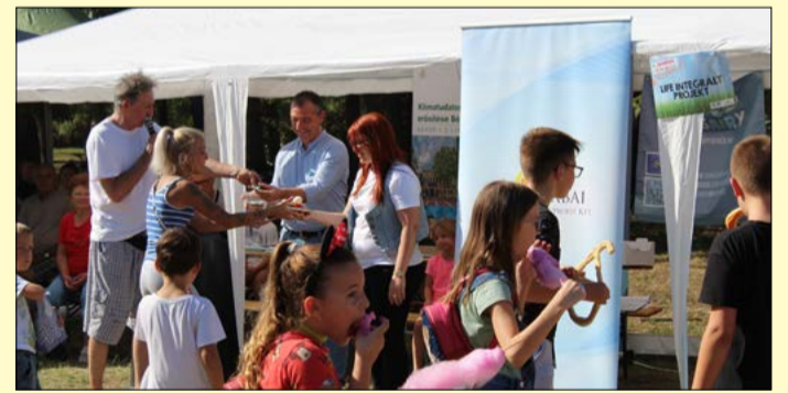
A programot elsősorban a családokra építették