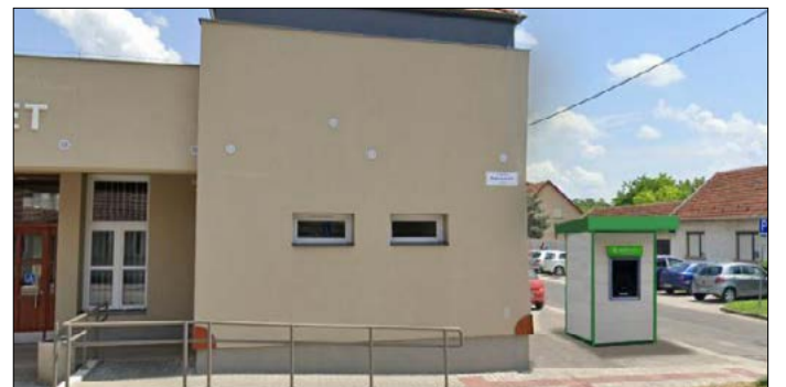
Az ATM az egészségház mellett lesz (látványterv)