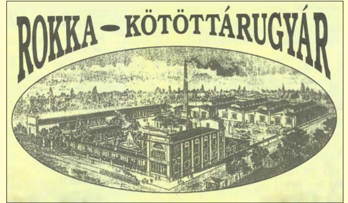
A Rokka épületének látképe az induláskor