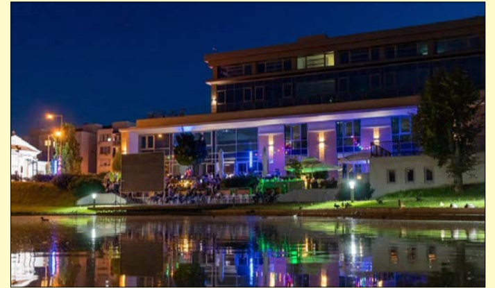
A stégen mozi és koncertek is várják a nézőket

igazgató kiemelte, nagy öröm, hogy három hónap kihagyást követően újra élet költözött a könyvtárba, és korlátozott szolgáltatásokkal újranyithattak. A mostani első kiállításon egyébként a nyomdaipari csomagolóanyagok kaptak más funkciót a BSZC Szent-Györgyi Albert szakgimnáziuma művészeti tagozatosainak jóvoltából.