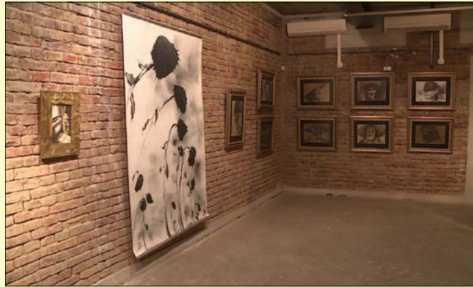
Újra látogathatók a múzeum kiállításai

A járvány miatt hozott jogszabályok enyhítésének köszönhetően június 18-a után megnyithattak a kulturális intézmények közösségi terei. A Csabagyöngye Kulturális Központ már az új szabályozás megjelenését követő reggelen kitarja kapuit, majd a Békés Megyei Könyvtár, a Békéscsabai Jókai Színház és a Munkácsy Mihály Múzeum is élt ezzel a lehetőséggel.