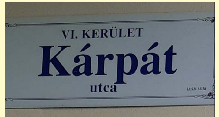
Számos utca őrzi az elcsatolt területek nevét

Egy olyan személyről (Lord Rothermere) is neveztek el közterületet Békéscsabán, aki egy magyarországi látogatás után Angliában, egy napi 1 millió példányban megjelenő újságjában hívta fel a figyelmet a trianoni béke igazságtalanságára. A Rothermere utca ma Batsányi utca.