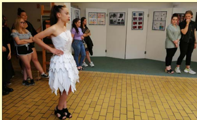
Rendhagyó kiállítás-megnyitó a könyvtárban