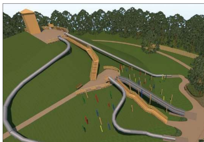
Csúszdapark is szerepelt a CsaKK-ban látott terveken

a Csabagyöngye Kulturális Központban (CsaKK). Az ott látott tervekben mutatunk most néhányat olvasóinknak.