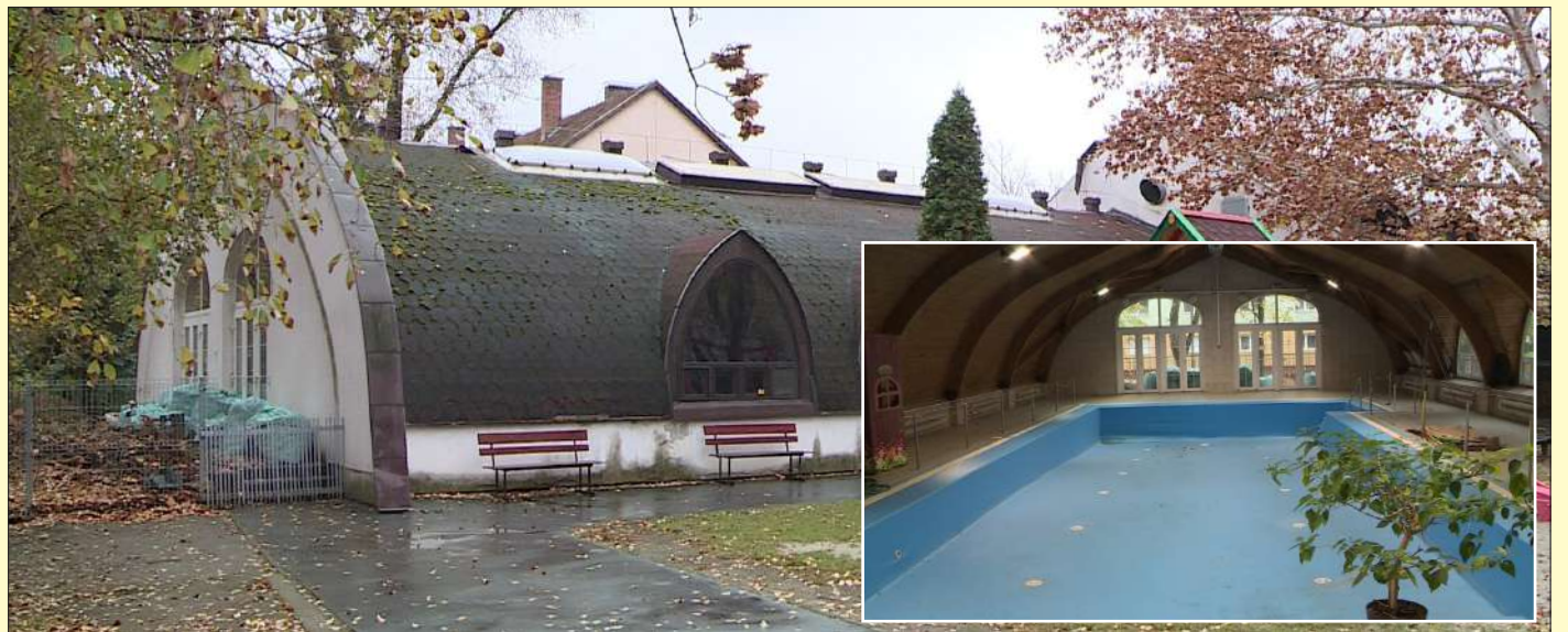
A felújítás százmillió forintba kerül, az önkormányzati szerepvállalás ebből hatvannégymillió forint

Az önkormányzat 64 millió forintot, a hazai úszószövetség 36 milliót ad a beruházáshoz