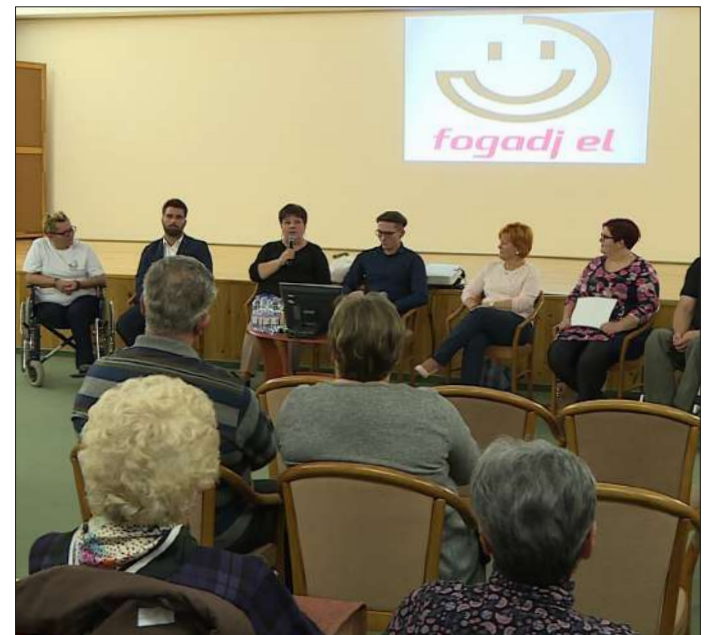
A Fogadj el napon az érintettek beszéltek a mindennapi életükről és szóba kerültek fontos mentális kérdések is

Az eseményen átadták az „Így kerek...” elnevezésű rajzpályázat díjait, és leveti-