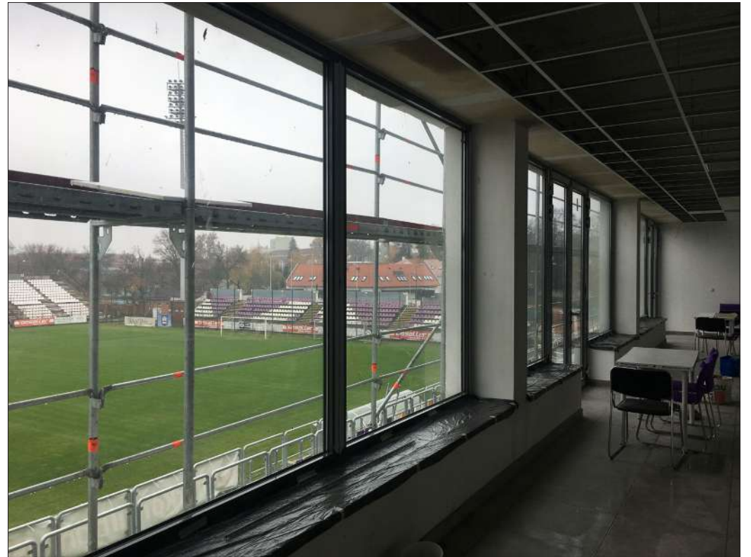
A jelenleg folyó beruházás a lelátóval, a pálya újraépítésével, a pályafűtéssel és a másik lelátó bontásával együtt összesen mintegy 1,3 milliárd forintba kerül