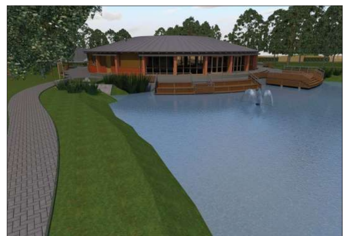
A Körte sori fogadóépület a kis tavacskaival