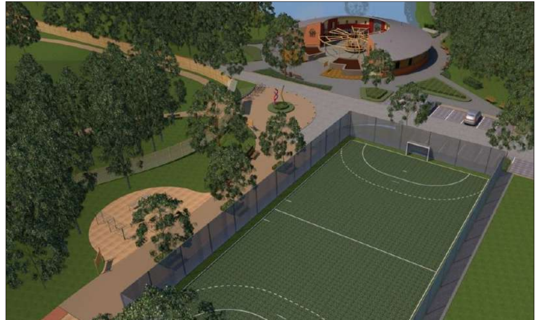
A Körte sor felől az elképzelések szerint így fog majd kinézni a CsabaPark

Ebben az ütemben a város a CsabaPark további elemekkel való bővítését, a parkerdő területének megújítását, fák, cserjék telepítését, az eddigi fejlesztések egységé formálását tűzte ki célul. Ennek megfelelően a projekt fő elemei a következők: rekortán burkolatú futópálya építése; a volt Trófea szálló épületének felújítása (Trófea szolgáltatóház kialakítása); kolbász tematikájú élménypark kialakítása a Körte sori fogadóépület mellett; sétányok, tematikus sétautak kialakítása;