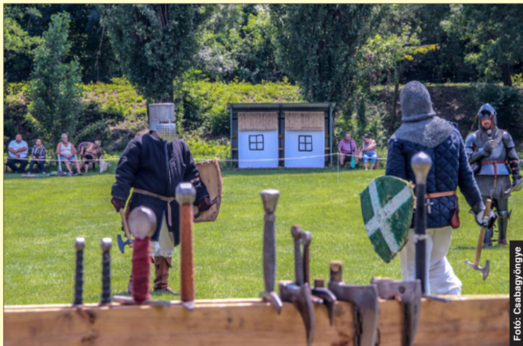
A szervezők hagyományteremtő szándékkal hívták életre a fesztivált

Negyedik alkalommal rendezték meg a Gerlai Falunapot, amelyhez idén Katonai Hagyományőrző Fesztivál is kapcsolódott. A látogatók olyan látványos programokon vehettek részt, amelyek a régióban egyedülállóan számítanak.