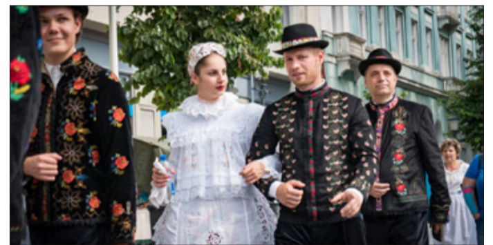
Sokan érkeztek gyönyörű népviseletben