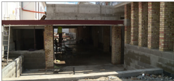
Hamarosan elkészül a két épületet összekötő terem

A múzeum felé járók láthatják, hogy látványosan halad az 1912-ben épült régi, és az 1972-ben készült új részt összekötő terem építése, de a két épületben is dolgoznak.