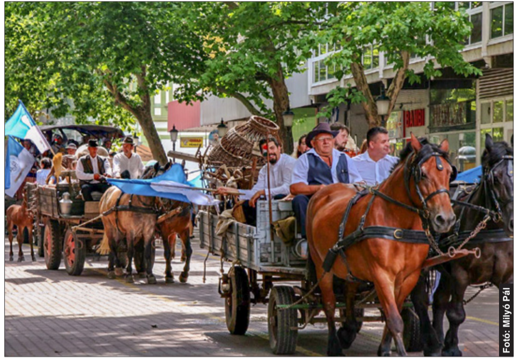
Lovas kocsikkal és gyalogosan vonultak a hagyományőrök a Szent István térre