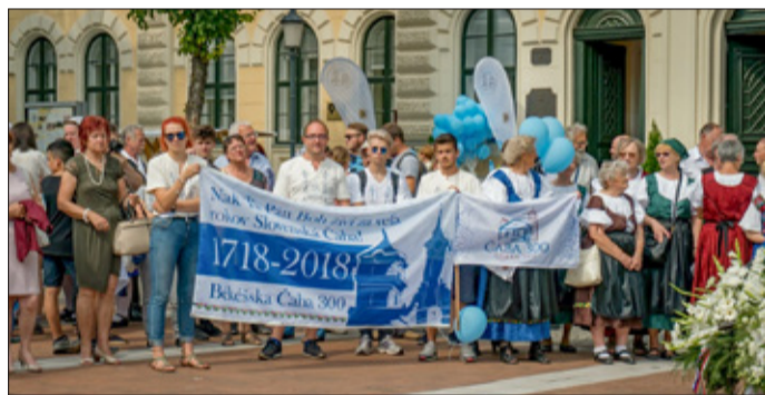
Emlékezők a városháza előtt