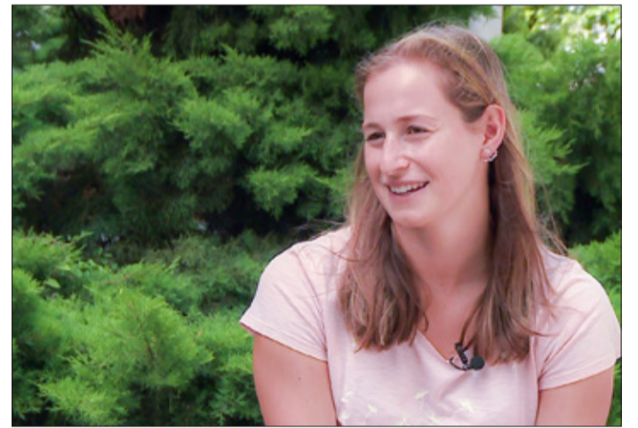
Tálás: Újszerű csapat van kialakulóban