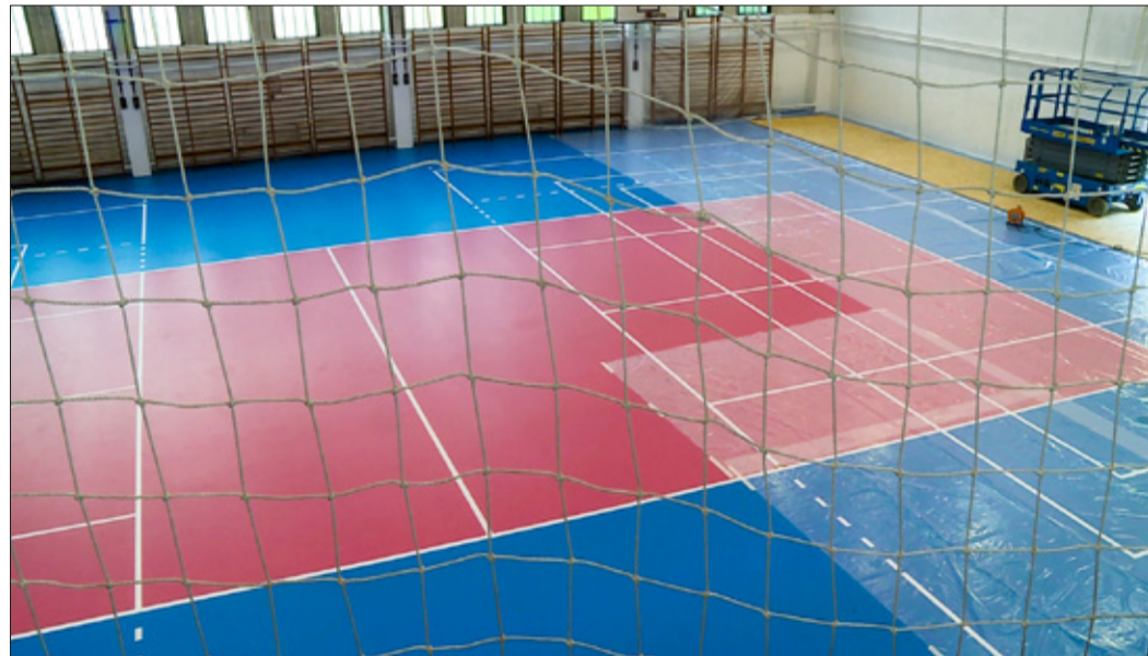
A Vízmű tornatermét a diákok mellett a Röplabda Akadémia fiataljai is használhatják

Ötvenmillió forintból újították fel a padlóburkolatot és korszerűsítették a világítást a Vársárhelyi Pál Szakközépiskola tornacsarnokában a Modern Városok Program beruházásainak részeként. A létesítményt az intézmény diákjai mellett a Röplabda Akadémia fiataljai is használják majd.