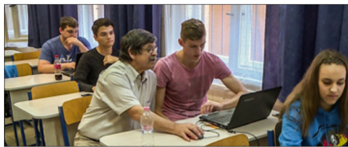
A 20 évnél fiatalabbaknak a díjat utólag térítik meg

Júliustól ingyenes a sikeresen teljesített KRESZ-tanfolyam és -vizsga a 20 évnél fiatalabbaknak, a díjat utólag téríti meg az állam.