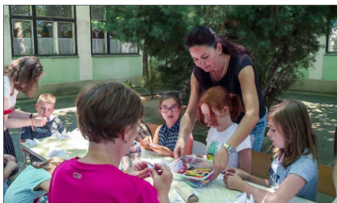
Pár hétig még ez is egy lehetőség a nyárra

Számos más lehetőség mellett Békéscsabán a nyári napközis tábor is alternatíva arra, hogy a gyerekek színes programokkal, hasznosan és kellő felügyelet mellett töltsék a vakáció napjait. A Békéscsabai Családsegítő és Gyermekjóléti Központ koordinálásával a városban két helyszínen várják ilyen táborba a gyerekeket. Augusztus elejéig az Erzsébethelyi Általános Iskolában és a Kazinczy Ferenc Általános Iskolában működik napközis tábor.