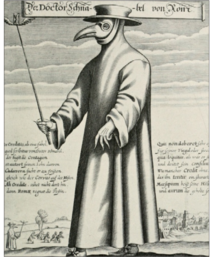
Egykorú metszet a pestis orvos ruházatáról