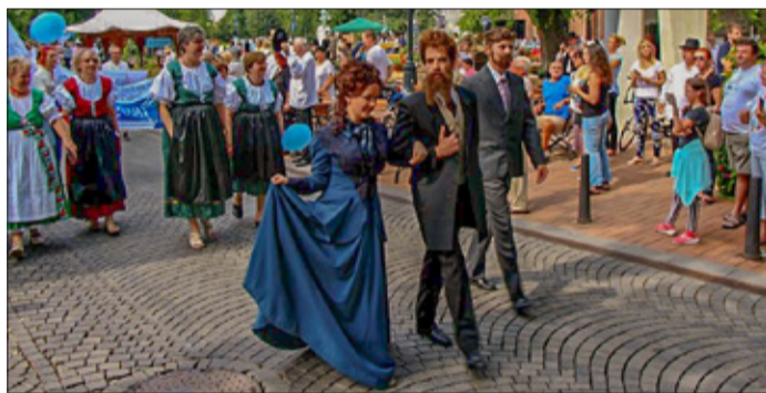
Munkácsy és felesége, valamint Stark Adolf a téren