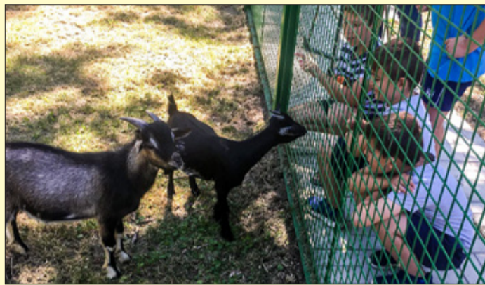
A gyerekek körében népszerűek voltak a kecskék

Kisállat-simogatót adtak át a közelmúltban a CsabaParkban. Az elkerített területen háztáji állatokkal ismerkedhetnek meg a gyerekek, a látogatók, és mindezt ingyenesen.