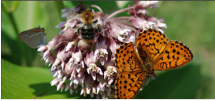
A selyemkórót nevezik tejelőkórónak, vaddohányinak vagy selyemfűnek is

Magyarországon is egyre több az olyan növényfaj, amely itt nem őshonos, azonban véletlenszerűen idekerülve, az évek során annyira elszaporodik, hogy kezdi kiszorítani az itt őshonos növényeket. Erre példa a környezetvédelmi szakembereknek nagyon is ismerősen csengő selyemkóró, amit neveznek még tejelőkórónak, vaddohányinak vagy selyemfűnek is.