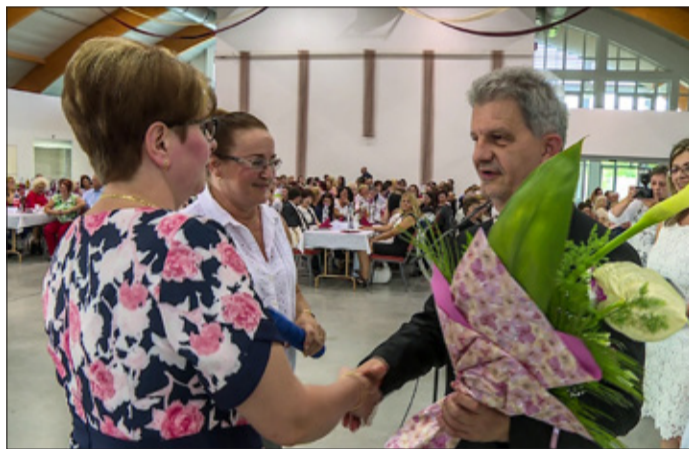
Elismerés a központi műtő dolgozóinak