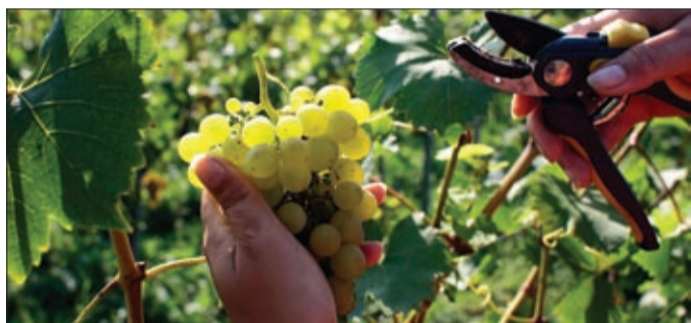
A Csabagyöngye-ültetvényen is dolgoztak

A közmunkaprogramban tavaly mintegy 316 millió forint értékű munkát végeztek el a közfoglalkoztatottak Békéscsabán, ehhez 31 millió forintot biztosított az önkormányzat. A programot idén is folytatná a városvezetés.