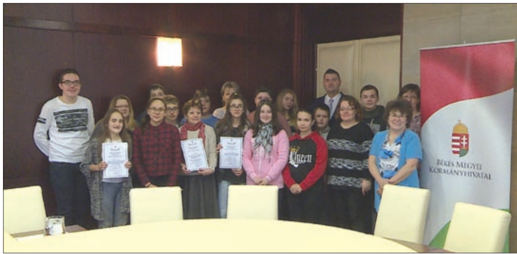
Az őszi vetélkedősorozat elismeréseit vették át a nyertes diákok

Ünnepélyes eredményhirdetésen vehették át a Békés Megyei Kormányhivatal Népegészségügyi Főosztálya által szervezett őszi vetélkedősorozat elismeréseit a nyertes diákok a közelmúltban. A feladatok többek között az aktuális hónap világnapjai köré szerveződtek.