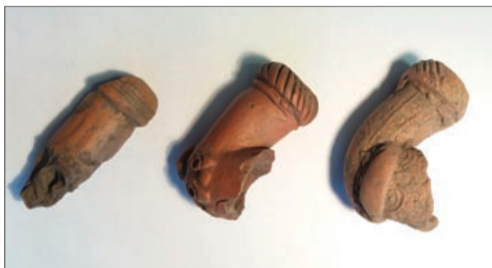
XIX. századi csereppipák a Pernecki csárdánál végzett kutatásból

2017 óta végeznek a Munkácsy Mihály Múzeum régészei a 18–19. századi Békés (vár) megye anyagi kultúráját feltáró kutatásokat. E vizsgálatok keretében a múlt év telén került sor a Csorvás közeli Pernecki csárda környékének megkutatására amatőr, múzeumbarát békéscsabai hobbi fémkérés bevonásával.