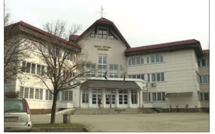
A cél, hogy megmaradjon a felsőoktatás Békéscsabán

Döntött a kormány arról, hogy a jövőben ki lesz a fenntartója a Szent István Egyetem agrár- és gazdaságtudományi kar békéscsabai telephelyű gazdasági campusának. A Magyar Közlöny február 1-jei számában megjelent kormányhatározat szerint a kar februártól az egyházi fenntartásban működő Gál Ferenc Főiskolához csatlakozik.