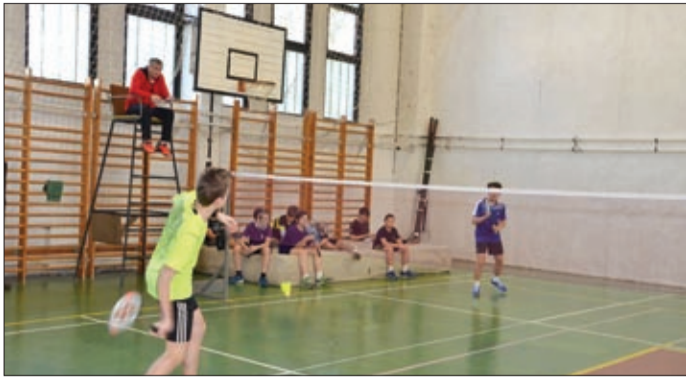
A fiúk és lányok hat korcsoportban játszottak

A gyors ütőforgatásról, könnyed, ám mégis hihetetlenül aktív pályamozgásról híres labdajáték hazánk egyes területein ma már tömegeket vonz és a térségi tollaslabdabázisok hiánya ellenére Békés megyében is egyre népszerűbb. A di-