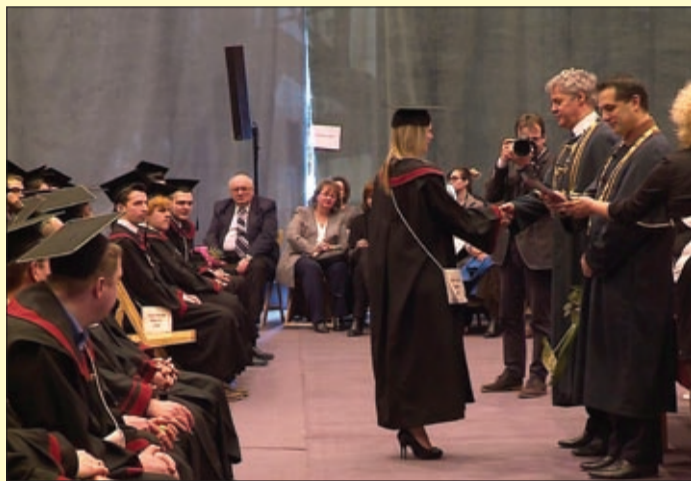
Ők még a Szent István Egyetem hallgatóiként diplomáztak