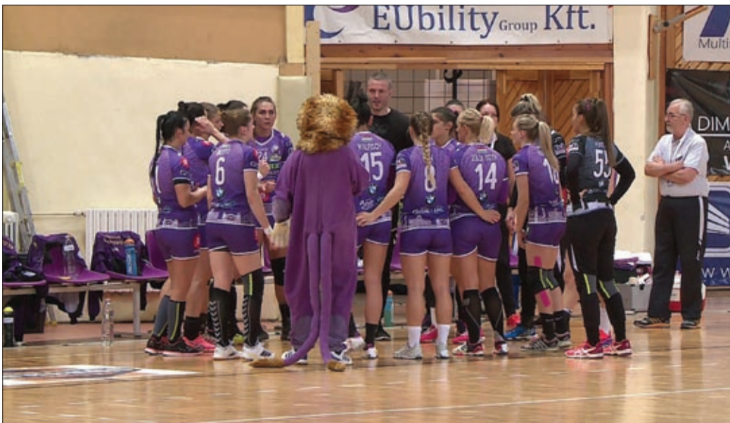
Arra kéri a szurkolókat, hogy továbbra is segítsék biztatásukkal a csapatot