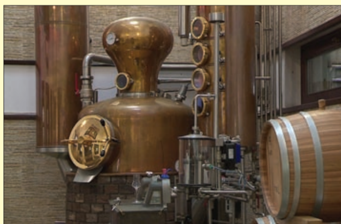
Ahol a minőségi pálinkák készülnek