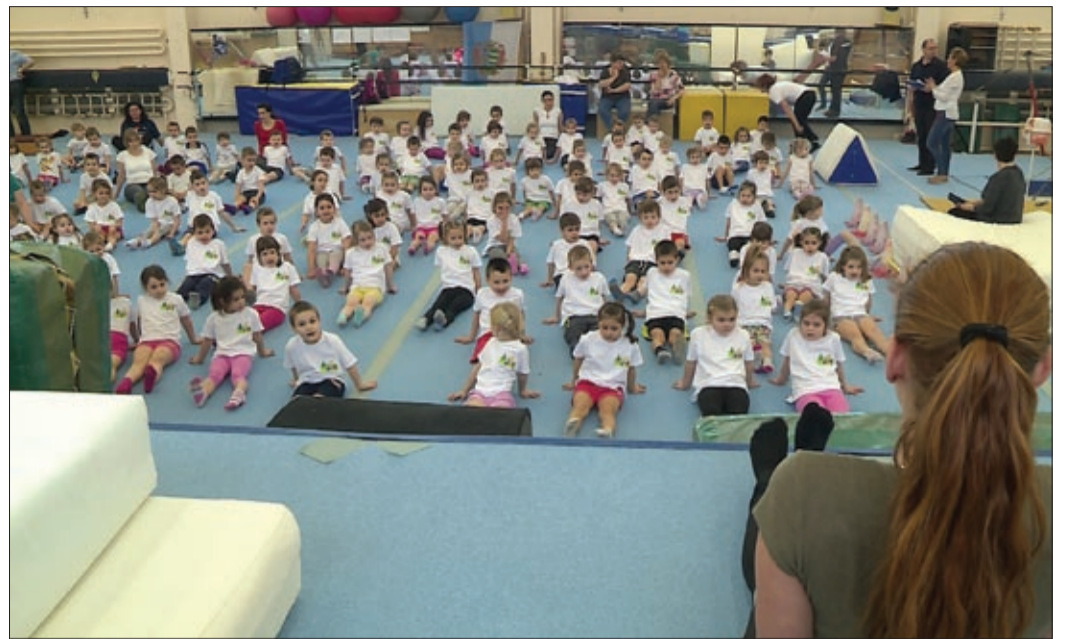
Közös bemelegítés a Kórház utcában, a Torna Club Békéscsaba székhelyén

Óvodai Bukfencparádéval kezdődött el a HISZEK Banned Sport Program Békéscsabán. Az ötnapos programsorozat keretében összesen 550 óvodás próbálhatta ki a Torna Club Békéscsaba tornaszereit.