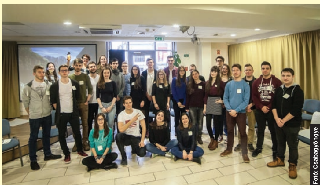
Az egyetemnapon a jelenlegi és volt egyetemisták találkoztak a középiskolásokkal

Az EBI – Egyesület Békéscsaba Ifjúságáért február elsején negyedik alkalommal szervezte meg az egyetemnapot a felsőoktatásba készülők számára. A Csabagyöngye Kulturális Központban tartott rendezvényen a fókuszban az érettségire való felkészülés, az egyetemi felvételi és a hallgatók élete volt.