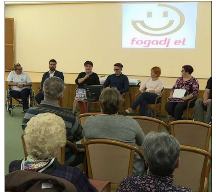
A Fogadj el napon az érintettek beszéltek a mindennapi életükről és szóba kerültek fontos mentális kérdések is

Az eseményen átadták az „Így kerek...” elnevezésű rajzpályázat díjait, és leveti-