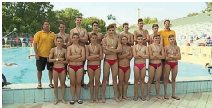
A jövő vízilabda-reményesei az Árpád fürdőben

A szentesi torna után alig tíz nappal Békéscsabán is megrendezték a Diapolo Kupa nemzetközi utánpótlás vízilabdatornát, amelynek három napon át az Árpád fürdő adott otthont. A tornán mindhárom korosztályban dobogóra lépett a csabai csapat.