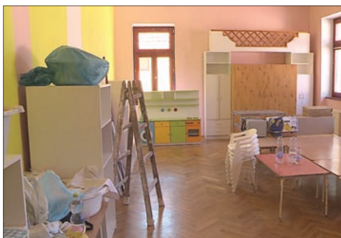
A Lenkey ovi csoportszobájában lassan minden a helyére kerül