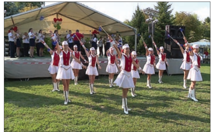
Negyedszázados hagyomány az előzetes megszervezése