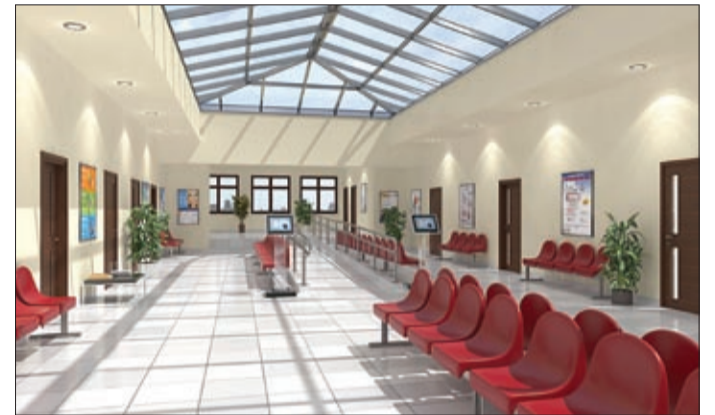
A tervek szerint ilyen lesz majd a legújabb rendelő