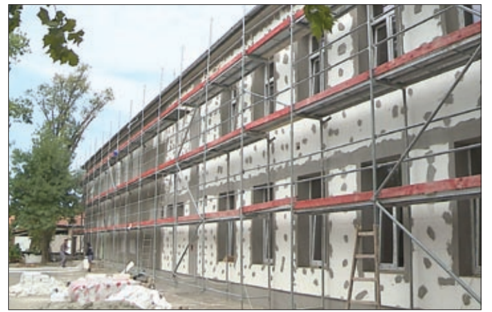
A Jankay iskola napokkal ezelőtt még fel volt állványozva