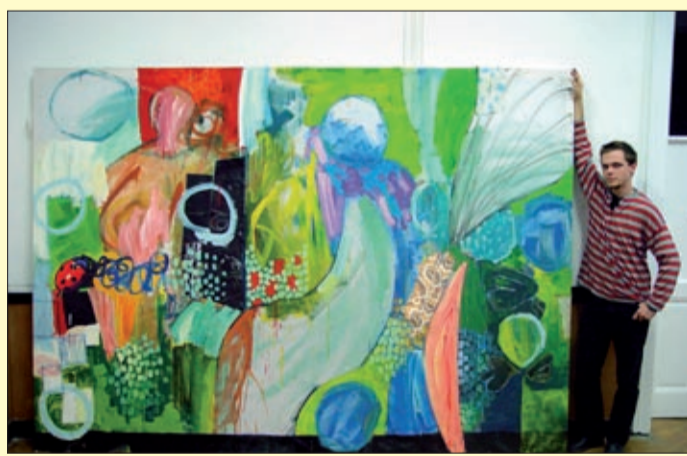
Még egyetemistaként egy félabsztrakt képpel