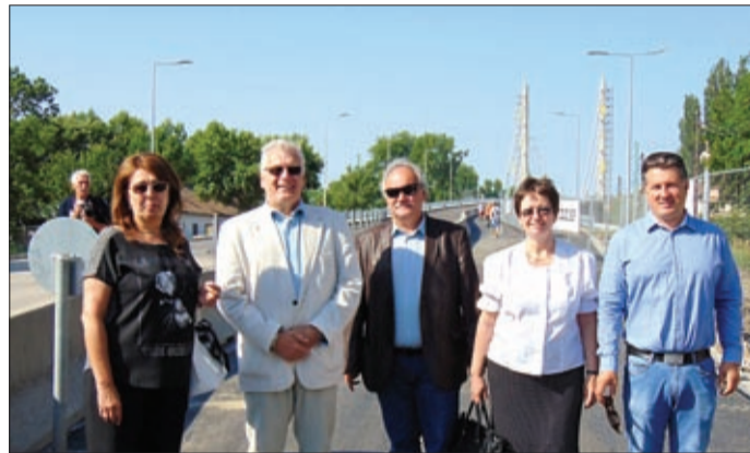
Az Orosházi úti felüljáró átadásán