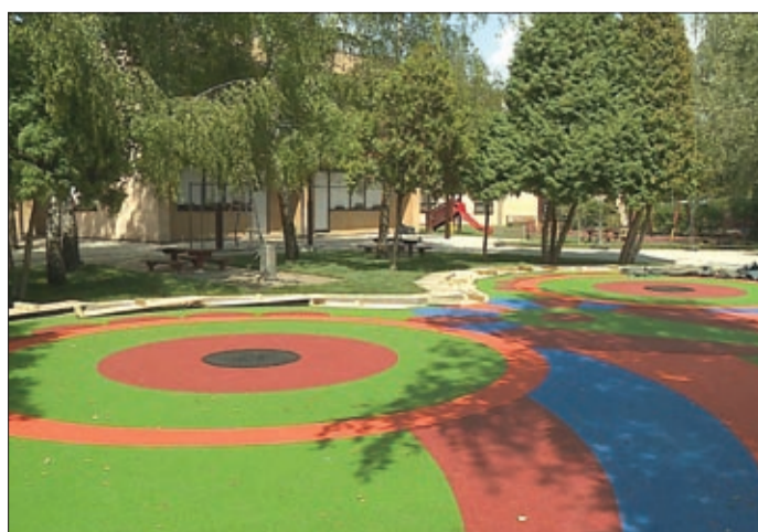
A Százsorszép óvoda udvarára rá sem lehet ismerni