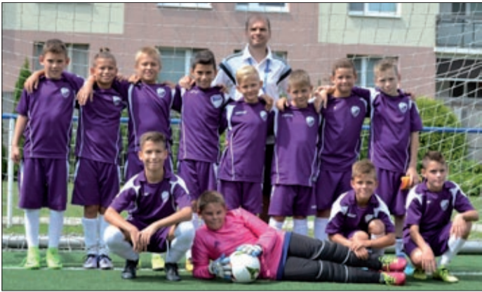
A 11 éves fiúk ezüstéremmel térhettek haza

A szlovákiai Martin (Turócszentmárton) településsel Békéscsaba városának hosszú évekre visszatekintő kulturális és sportkapcsolata van. A közelmúltban a Békéscsaba 1912 Előre SE ifjú focistái jártak ott, hogy részt vegyenek a Visegrádi Alap által nyújtott támogatásból megvalósult nemzetközi kupán. A 11 éves fiúk ezüstéremmel térhettek haza.