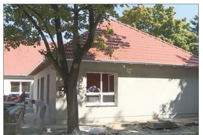
A Tabor utcai óvoda még a felújítás közben

A Százsorszép Művészeti Bázisóvodában a 36 millió forintos pályázati forrásból az udvar újult meg, itt a régi árnyékolószerkezeteket és a két tárolót alakították át.