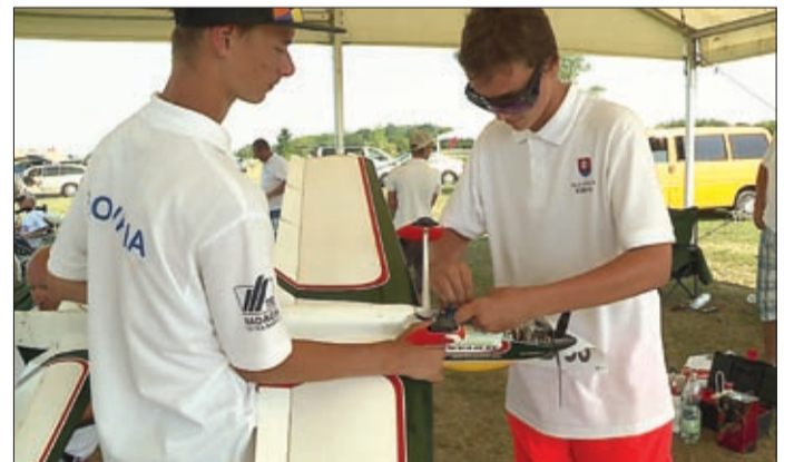
A körrepülő modelleket gondosan előkészítették

Körrepülő modellek Európa-bajnoksága zajlott a közelmúltban Békéscsabán, a repülőtéren. A ma még talán kevésbé ismert technikai sportágnak egyre több hódolója van világszerte. Magyarország nem először nyerte el a házigazda szerepét.