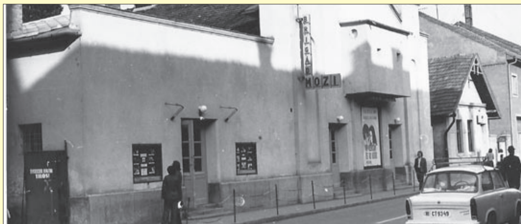
Az átépült Apolló látképe, már Brigád mozi néven az 1960-as évekből

Anno a színre lépő világhódító szórakoztatás új formája, a mozgóképvetítés felé nagy érdeklődés nyilvánult meg Magyarországon. Békéscsabán is voltak érdeklődők, vállalkozó szelleműek, azonban csak az Apolló Mozgó Képszínház Rt. tudott filmszínházat építtetni.