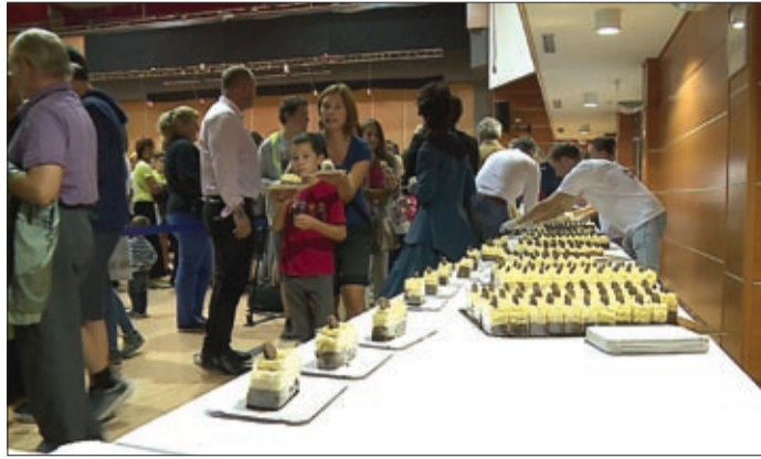
Alig fél óra alatt elfogyott az ezer szelet torta

Az augusztus huszadikai városi ünnepség keretében, kevesebb mint fél óra alatt elfogyott ezer szelet Munkácsy-torta a Csabagyöngye Kulturális Központban. Idén a Mandula extra elnevezésű cukrászsüteményt választotta a szakmai zsűri az év tortájának, és a különleges édességgel vendégül is látták a lakosságot.