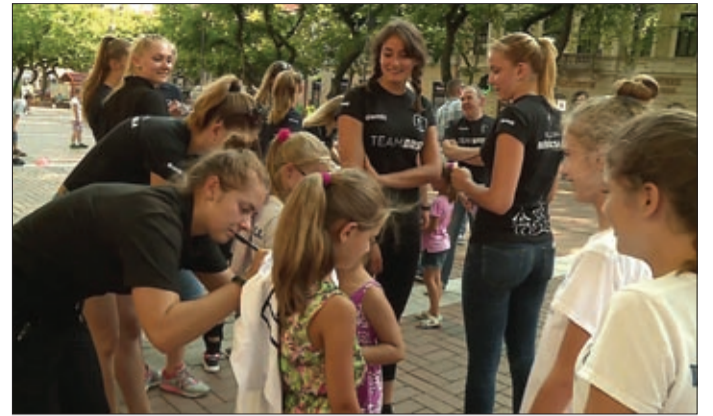
A BRSE a sporthétfőkön is népszerűsítette a röplabdát