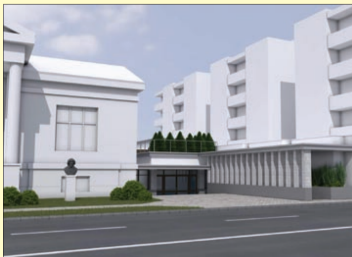
A beruházás várhatóan jövő októberre készül el

A Terület- és Településfejlesztési Operatív Program (TOP) támogatásával, 200 millió forintos támogatásból új közösségi és kiállítóteret alakítanak ki a Munkácsy Mihály Múzeumban. Az intézmény két épületét kötik össze az új létesítménnyel, a beruházás csaknem 200 négyzetméterrel növeli a kiállítóterek nagyságát.