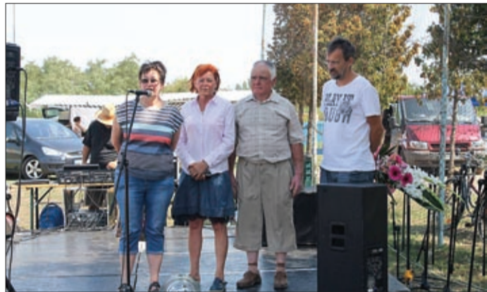
A családi nap megnyitóján, Jaminában