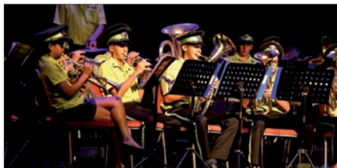
A Szent István tér volt a programok fő helyszíne

Fúvósok és mazsorettek vették birtokba Békéscsaba főterét augusztus közepén a négy napon át tartó Zeniten.