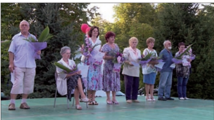
A „Lencsési a mi otthonunk” pályázat nyertesei