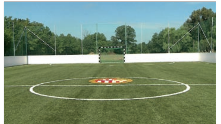
A Lencsési iskola egy műfüves pályával is gazdagodott

A középiskolákban és a kollégiumokban is befejeződtek a kisebb-nagyobb karbantartási munkák. Az Andrassy