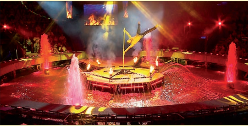
Egy nagy európai képzési rendszert szeretnének megvalósítani

Az Artistaképző tagintézménye lesz a tanév kezdetétől a békéscsabai Színitanház! Így a hallgatók a Nagycirkusz mellett a Békéscsabai Jókai Színházban és a Szarvasi Vízi Színházban szereshetik meg a szakmájukhoz szükséges gyakorlati tudást.