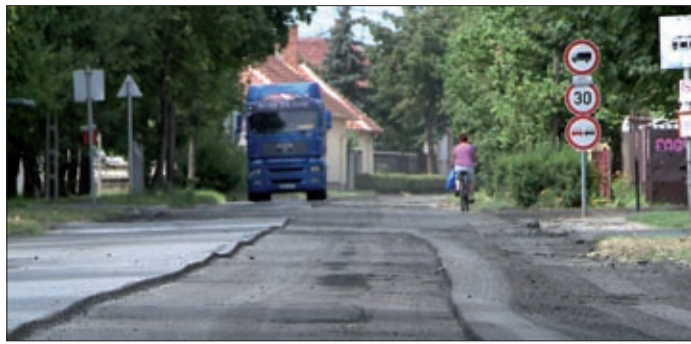
Az érintett utcákban forgalmkorlátozásra lehet számítani

A kivitelező – Hódút Kft. és a Duna-Aszfalt Kft. – munkagépei megkezdték a munkát az alábbi utcákban: dr. Petényi László u., Kálvin u., Bezerédj u., Harruckern u. és az Ybl Miklós u.