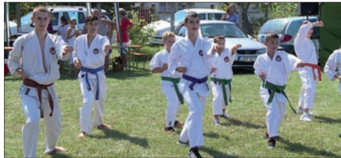
Karatebemutató a mezőmgyeri családi napon