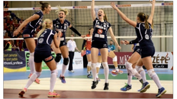
Az egyik legerősebb sorozat lett az idei

Megtörtént Bécsben a Közép-európai Liga (MEVZA Cup) sorsolása, az egyik legerősebb sorozata lesz az idei. Visszatért a két szlovák nemzetközi kupában is érdekelt gárda (Slávia EU Bratislava és 1. BVK Bratislava), valamint a cseh SK UP Olomouc. Rajtuk kívül pályára lép a címvédő Calcit Ljubljana, a mindig erős Nova KBM Branik Maribor, a horvát bajnok Mladost Zagreb, az osztrák első Sokol Post NÖ, míg hazánkat a Linamar-Békéscsabai RSE és a Vasas Óbuda képviseli. Az alapszakaszban négy fordulót rendeznek, ahol csapatonként 2-2 mérkőzést vívnak