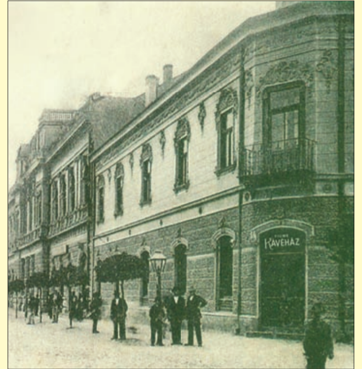
A Fiume épülete a sarki kávéházzal