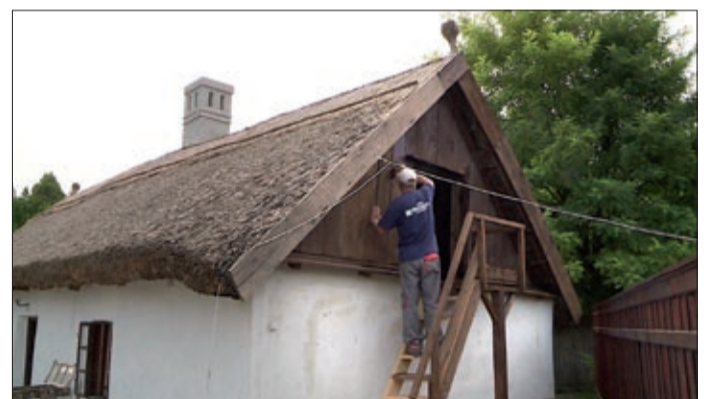
A ház felújítása rövidesen befejeződik

A Harruckern sétaút kiindulópontja lehet hamarosan a Molnár-ház. Békéscsaba legrégebbi lakóépületének felújítása pár hónapja kezdődött, és a napokban már az utolsó simításokat végzik.