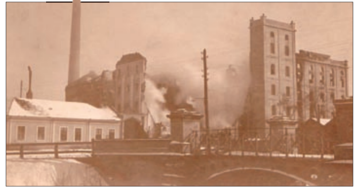
A katasztrófáról 1915. március 7-én készült ez a fénykép

A Békés című újság 1915. március 14-ei száma részletesen beszámolt a katasztrófáról.