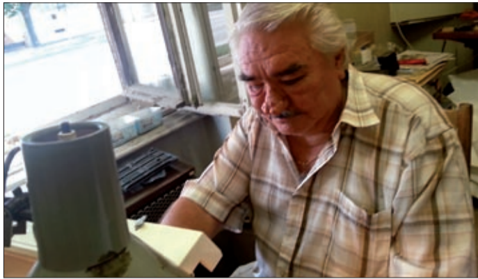
A mester azt mondja, jólesik neki a munka

A mester azt mondja, jól esik neki a munka, az is előny, hogy közben találkozik vevőkkel, ismerősökkel, akikkel váltanak néhány szót. A vásárlók is marasztalják, hogy ne adja