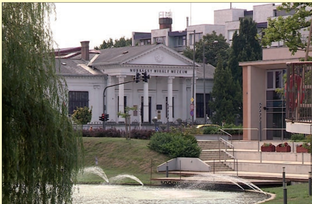
A belváros felújítással érintett része még szebb, zöldőbb, biztonságosabb lesz

Egymilliárd forintot nyert Békéscsaba a belváros-rehabilitáció harmadik ütemére