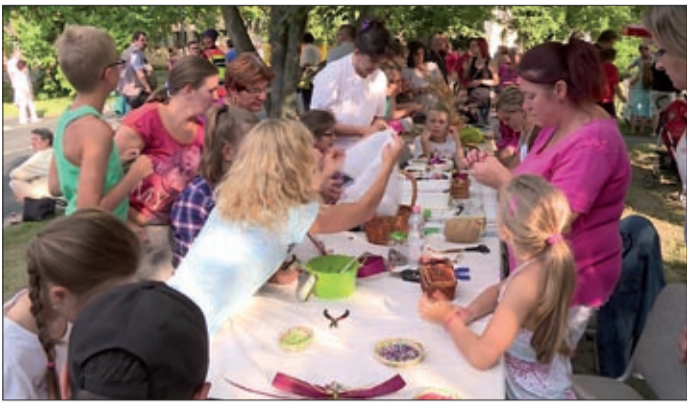
Gyerekek várták a családokat

Huszonnégy éves múltat tekint vissza a Szent István-napi előzetes, amit a Lencsési Községi Ház szervez meg évről évre.