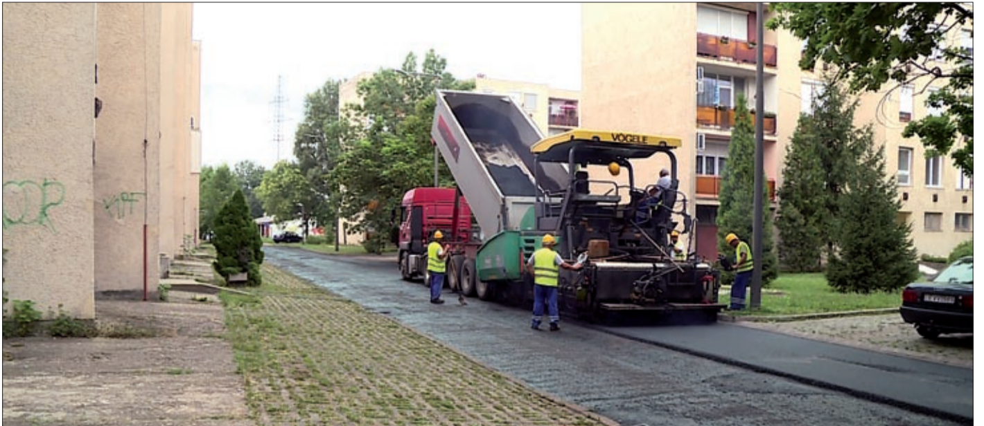
A város több pontján folynak az útfelújítás munkálatai, a közlekedőtől nagyobb figyelmet kérnek

Folyamatosan zajlanak az útfelújítások Békéscsabán. Első körben 67 utca aszfaltrétegét cserélik ki. További 72 utcában komolyabb útszerkezeti javítás szükséges, ez utóbbiak esetében kiviteli és engedélyes tervek készülnek. A most megkezdett munkálatokat a vállalkozónak hét hónapon belül kell befejeznie.