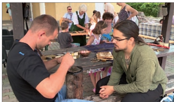
A Mezőmegyeri Kézművesfalu alkotói tartottak játszóházat