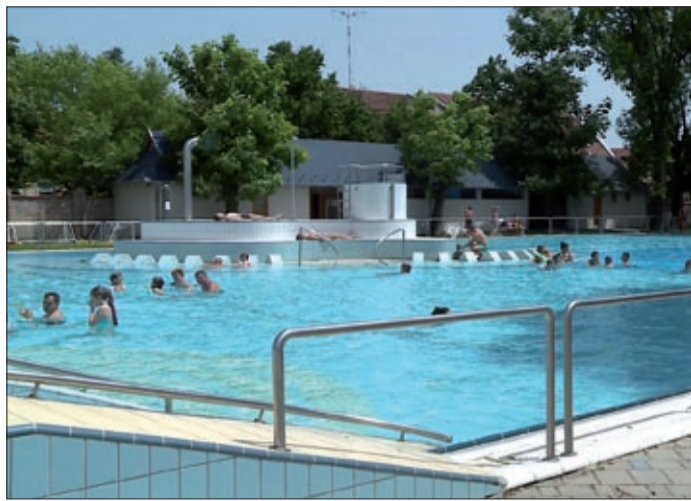
Strandolásnál kiemelten figyeljünk gyermekeinkre

A nap bizonyos mennyiségben egészséges, de nem árt vigyázni vele. Ha a nap kellemesen süt, bőrünk egészséges színt kap, D-vitamin képződik, és ha azt akarjuk, hogy idősebb korban ne legyen csontritkulásunk, nemcsak D-vitaminra, A-vitaminra is szükségünk van, mely a sárgarépaiban található. A nap gyógyítja a köszvényt, a kimerültséget, a reumát, a különböző bőrbetegségeket. Viszont figyelni kell a mértékre.