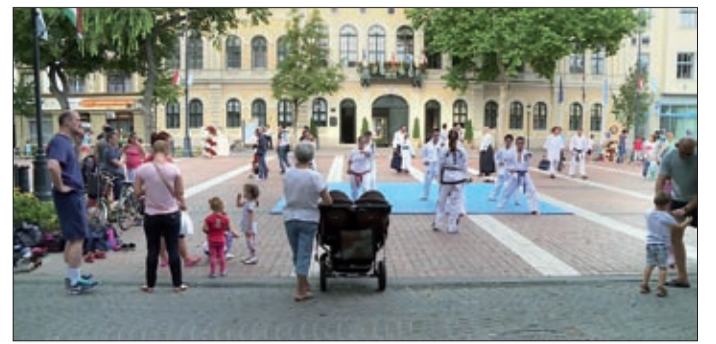
Akár sportágválasztó is lehet egy-egy ilyen nap

Túl van a félidején a Sporthétfő elnevezésű rendezvénytársaság, amely kilenc alkalommal tölti meg a Szent István teret ezen a nyáron. Augusztus 22-éig mintegy 40 egyesület mutatkozik be az érdeklődőknek, július második felében egyebek mellett a női foci, a kerékpár és taekwondo is szerepelt a kínálatban.