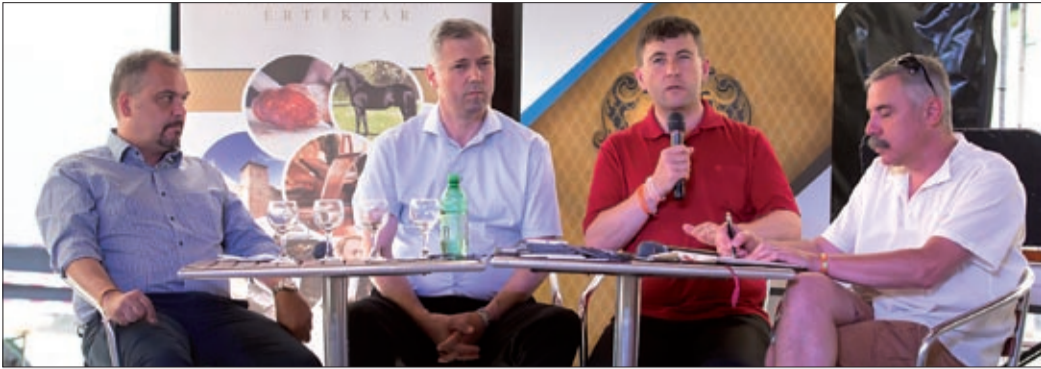
Kovácsna, Hargita és Maros megye közreműködésével Tusványoson jött létre a bizottság

Kovácsna, Hargita és Maros megye közreműködésével Tusványoson létrejött a 13 fős Székelyföldi Értéktár Bizottság, amelybe a három székelyföldi megye delegált szakértőket.