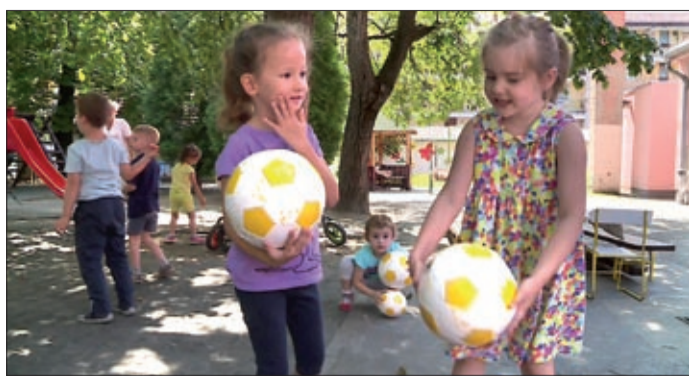
A Penza óvodában rögtön játszottak is a labdákkal

A megye kilenc településén, óvodákban és iskolákban osztottak szét 430 labdát. A játékszerek a Csabai Jövőért Egyesület és Vantara Gyula országgyűlési képviselő jóvoltából kerültek a gyerekekhez. Az akció utolsó állomásai között volt a Fényesi Községi Ház és a Penza óvoda is. A gyerekek szívesen fogadták az ajándékot.