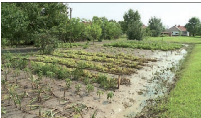
Ha a kertünket nem is, házunkat, értékeinket megóvhatjuk

Az idei nyáron is volt és minden bizonnyal még lesz is részünk kisebb-nagyobb viharokban. A szakemberek szerint kis odafigyeléssel csökkenthetjük a károk esélyét.