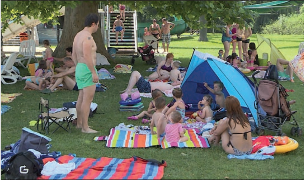
A szünetben a kicsiknek és a nagyoknak is be kell tartaniuk néhány szabályt

A gondtalan nyári szünetet a gyermekek élvezik, de fontos a kisebbeknek is, a szülőknek is betartani néhány szabályt. A nagyobb gyerekeket fel kell készíteni a veszélyekre.