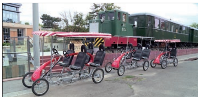
A turistáknak és a békéscsabaiaknak is ajánlják