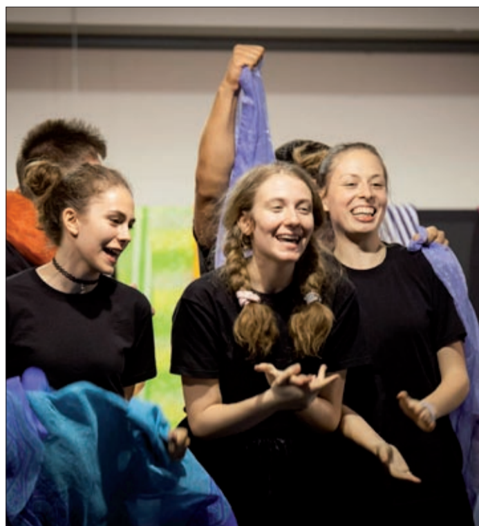
Élményszínházi előadások lesznek középiskolásoknak