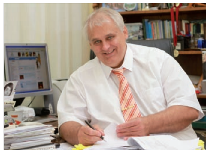
„A cél, hogy mindenkinek biztos megélhetése legyen”

Az intézkedés közvetlen célja a megyei jogú városi foglalkoztatási együttműködések (paktumok) képzési és foglalkoztatási programjainak támogatása, tevékenységi körük, eredményességük, hatékonyságuk növelése, továbbá a foglalkoztatás helyi szintű akciótervek megvalósításával való bővítése, az álláskereső munkához juttatása.