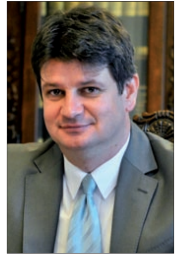
Gajda Róbert kormány megbízott

Az egyéb díjmentessé tett eljárásokban több mint 500