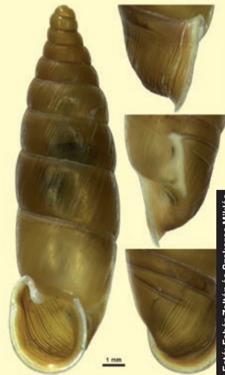
Egy újonnan felfedezett albániai csigafaj, a Montenegrina laxa delii héja

A korábbi és jelenlegi malakológiai gyűjteményeknek köszönhetően hazánk legnagyobb tisztántúli és a világ egyik legnagyobb kárpáti csiga- és kagylógyűjteményét a Munkácsy Mihály Múzeumban