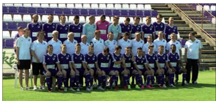
Elkészültek a 2016/2017-es szezon hivatalos fotói