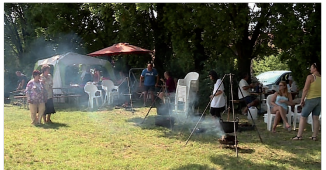
A Wenckheim téren tizennyolc csapat főzött bográcsokban