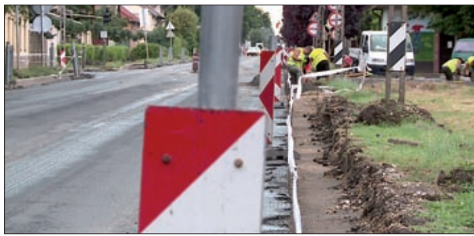
Békés megyében 17 kilométeren folynak munkák

Május óta folynak a munkálatok a Kondoros és Szarvas közötti útszakaszon. Az autósok több kilométeren keresztül szinte csak lépésben tudnak közlekedni a sebességkorlátozások miatt. A fennálló helyzet a Magyar Közút Nonprofit Zrt. tájékoztatása szerint augusztus közepéig biztosan nem fog változni.