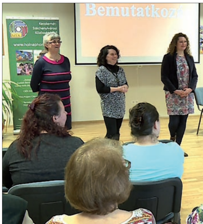
Az egészségtudatos magatartás kialakítására is figyelnek