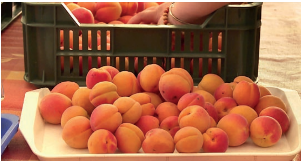
A barackot most az idősellátás, valamint a családok és a gyermekek átmeneti otthona kapta

A békéscsabai önkormányzat ültetvényén termelt gyümölcsöt ehettek a napokban a megyeszékhely szociális és gyermekintézményeiben. A Csaba tó mellett nemcsak szőlőt, de barackot is termelnek és szüretelnek.