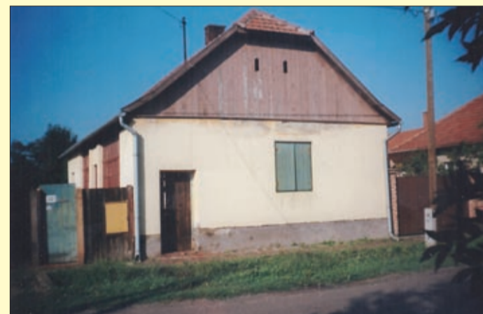
Egy ONCSA-ház utcafrontja 2002-ben, átalakítás előtt

HIRDESSZEN NÁLUNK! Csabai Mérleg • behir.hu • 7.tv 66/740-700 • info@bmc.media.hu