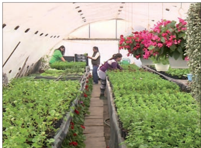
Képzések, átképzések segíthetik a foglalkoztatást

A TOP-6.8.2-15. kódszámú pályázati felhívás célul tűzte ki az emberi erőforrás-fejlesztéseket, a foglalkoztatás-ösztönzést és társadalmi együttműködések támogatását. A célt a kormány a megyei jogú város önkormányzataival, kormányhivatalokkal,