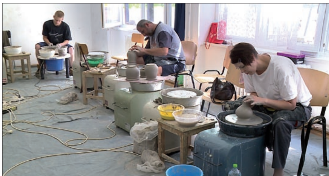
A táborban agyagozásra, cserépedények készítésére is lehetőség volt

A népi kézművesség hét nagy szakága jelent meg