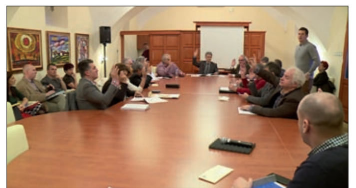
A soron kívüli közgyűlést a Mokok Teremben tartották

Soron kívüli közgyűlést tartott december 14-én Békéscsaba képviselő-testülete. Az ülést azért kellett összehívni, mert a Dél-alföldi Regionális Hulladékgazdálkodási Rendszer Létrehozását Célzó Önkormányzati Társulás (DAREH) pályázata december 15-én véget ért, ám addig nem lehetett lezárni a projektet, míg az összes tagtelepülés el nem fogadta a díjkonceptiót.