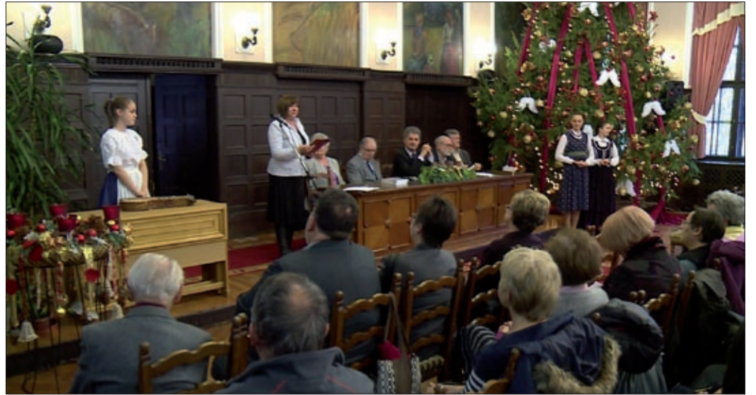
Fennállásának 30. évfordulóját ünnepelte a városvédők egyesülete

Fennállásának 30. évfordulóját ünnepelte a közelmúltban a Békéscsabai Városvédő és Városszépítő Egyesület a városháza dísztermében. Az egyesület célkitűzése az épített környezet védelme, illetve a hagyományok őrzése.