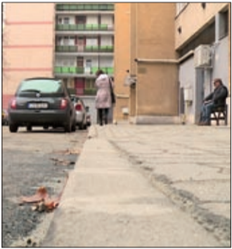
Aszfaltoltak, szegélyköveket cseréltek, burkoltak

A megszületett, megújult részek hivatalos átadásakor Bíró Csaba , Békéscsaba 5. számú választókerületének önkormányzati képviselője kiemelte, hogy egy nagyon fontos fejlesztést valósítottak meg önkormányzati forrásból, amely a lakók és az arra járók mindennapjait is megkönnyíti.