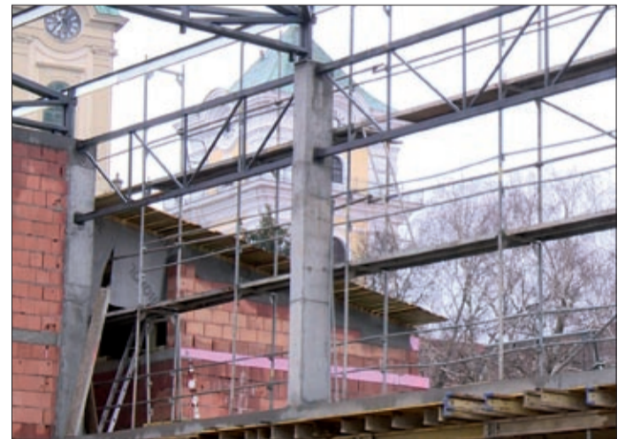
A csarnok jövő ősztől várja majd a diákokat