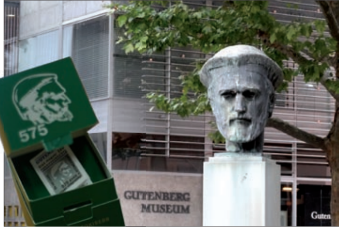
A miniújságok a Gutenberg Múzeum kincseit gyarapítják