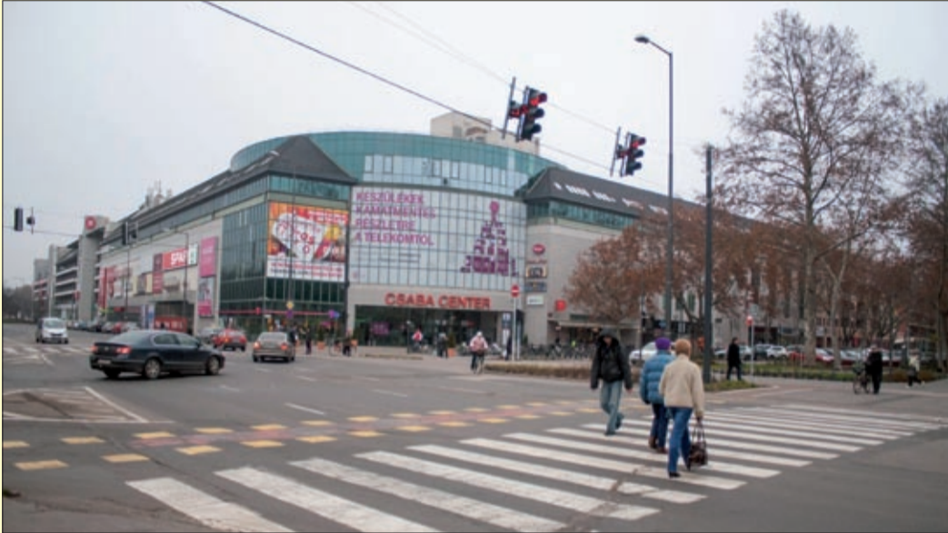
A belváros-rehabilitáció során kinyitották az Andrássy utat a Petőfi és Jókai utca felé