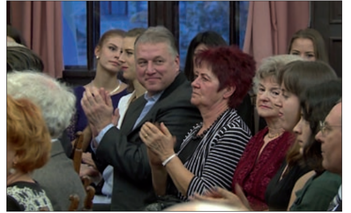
A díszvendég a sportolók, sportvezetők körében

Hamar kitűnt kiváló sportolói erényeivel. 1955-ben leigazolta a békéscsabai Törekvés Vasutas Egyesület, rövidesen tagja lett a magyar ifjúsági válogatottnak, 1958-ban pedig a felnőtt válogatottnak. A szakmai fejlődés miatt a fővárosba igazolt. A tokiói olimpián a 7., a budapesti Universiaden a 3., az ugyancsak budapesti Európa-bajnokságon pedig a 4. helyen végzett csapatot erősítette. Sportolói pályafutása után 1973-ig főfoglalkozású vezetőedző volt, majd 2006 szeptemberéig testnevelő tanárként dolgozott.