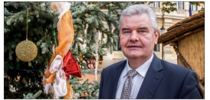
Vantara Gyula: Ezúton kívánok áldott békés karácsonyt és boldog új évet Békéscsaba minden polgárának

A fejlesztések szempontjából jónak ítélte a 2015-ös esztendőt Vantara Gyula országgyűlési képviselő, a megyei fejlesztések miniszteri biztosa, aki a következő évek prioritásairól is beszélt év végi összefoglalójában.