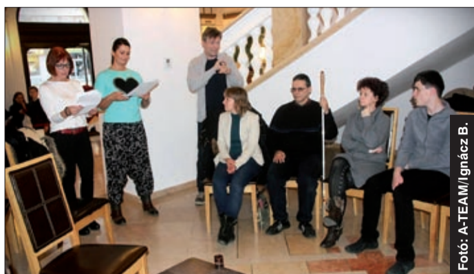
Az előadást egy kulisszajárás előzte meg

A teátrumban fontos küldetés, hogy a fogyatékossgal élők minden tekintetben azonos eséllyel látogathassák az előadásokat, s hogy számukra is teljes értékű színházi élményt biztosítsanak. Hosszú évek óta jelnyelvi tolmács közreműködésével segítik egy-egy nagyszínházi előadás megértését siket és