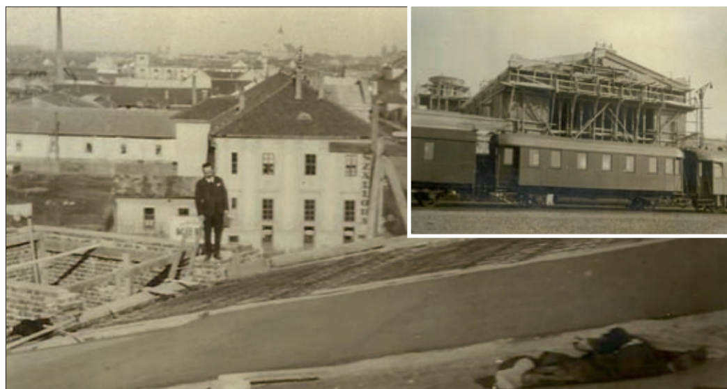
Képek az új állomás építéséről

A 157 éves csabai vasútállomás múltjáról