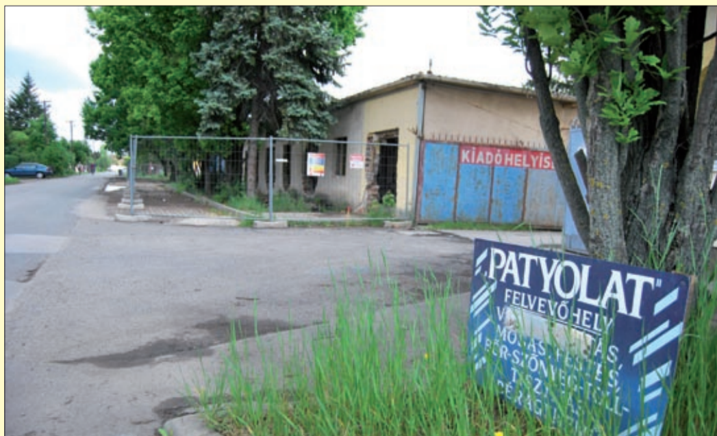
A kármentesítés keretében néhány épületet elbontanak