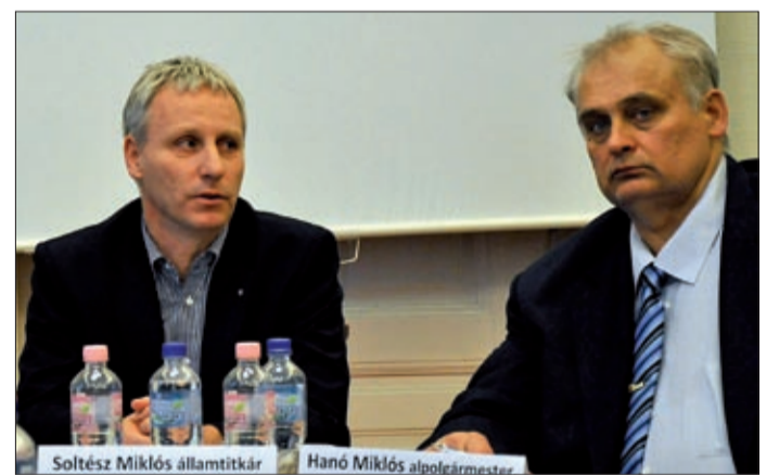
190 ezer ember vesz részt komplex felülvizsgálaton

Az államtitkár leszögezte: az elmúlt két évben látványosan csökkent a rendszerbe