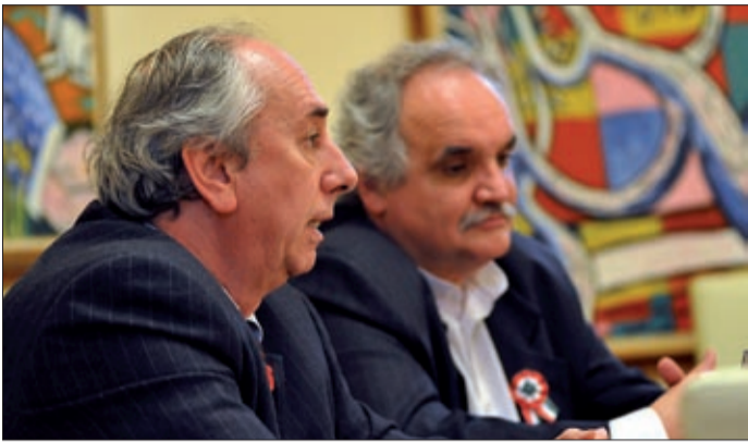
Fontos, hogy hiteles információt kapjon az olvasó