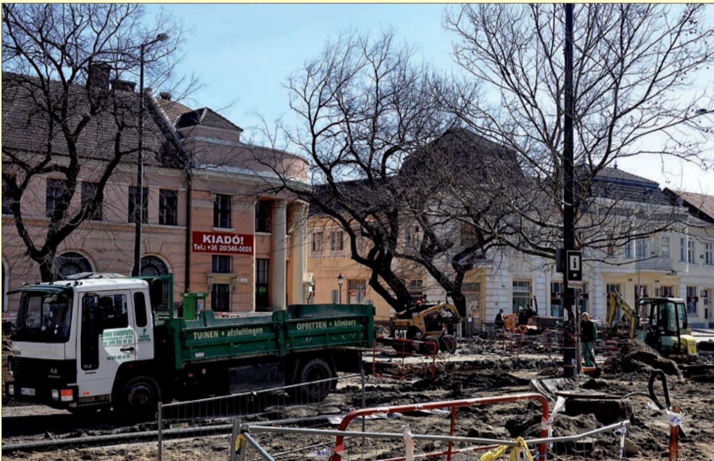
Javában folyik a munka a belvárosban a Szent István tér és Szabadság tér kereszteződésénél

A Szent István téren is a tervek szerint halad az építkezés, mindkét oldalon dolgoznak, az épülethomlokzatok felújításával május végére kell elké-