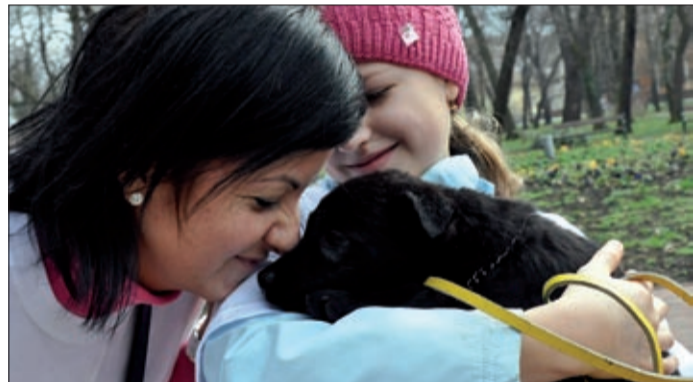
Idén tavasszal még lesz ilyen rendezvény

Adószám: Csabai Állatvédők 18383128-1-04 E-mail: csabaiállatvedok@freemail.hu KÖSZÖNJÜK