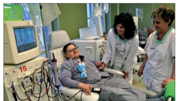
A kívülálló is megismerkedhet a művesekezeléssel

A veseelégtelenség előfordulása a világ legtöbb országában a lakosság 10 százalékát érinti, akiknek igen nagy hányada egyáltalán nem tud betegségről. Emiatt évente milliók halnak meg idő előtt az ezzel összefüggésben kialakuló szív-érrendszeri betegségekben. A kezdődő