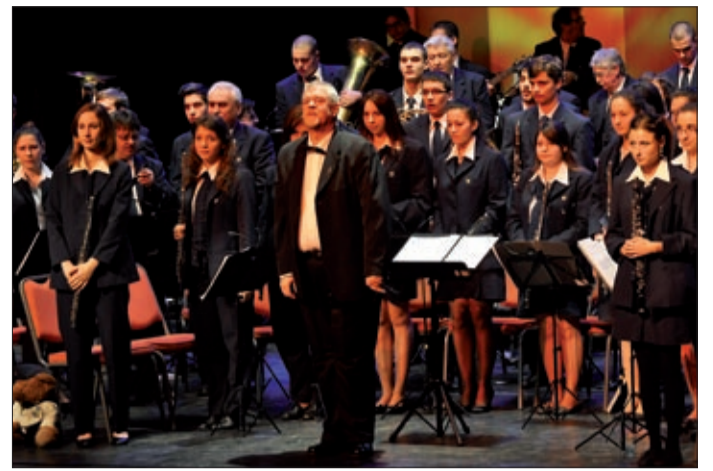
Nyáron Oroszországba készülnek a fúvósok