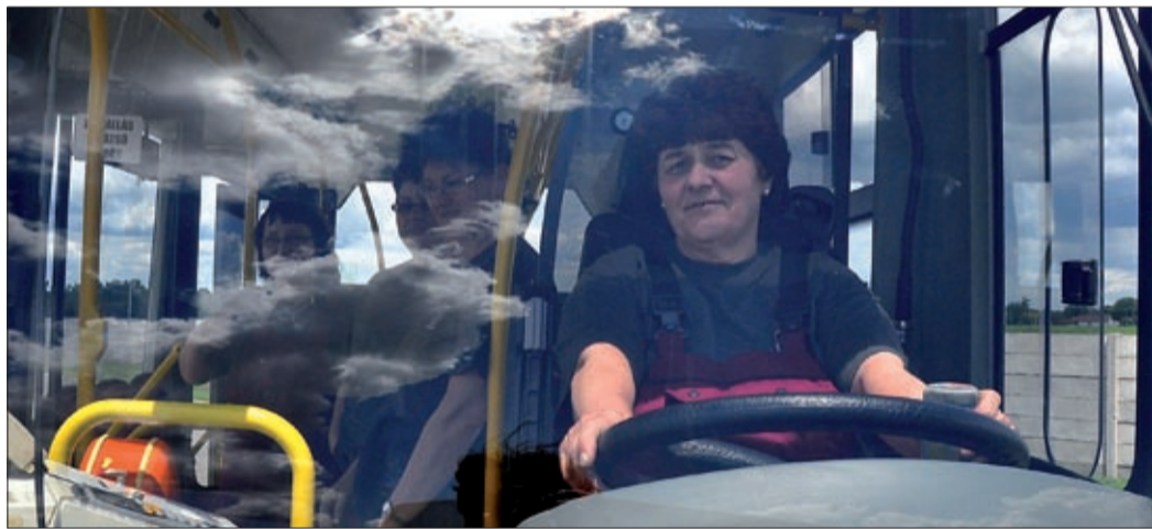
Békéscsabán is népszerű a Csaba Metál midibusza