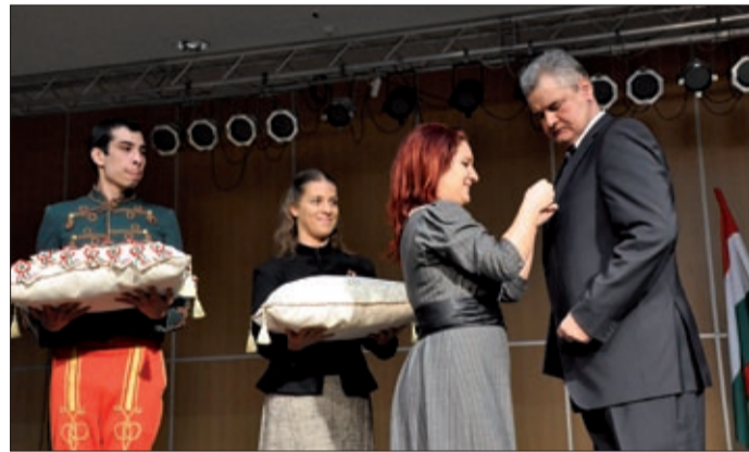
A polgármester is odaadta a kokárdáját, amit Aradra vittek

Vantara Gyula Széchenyi ma is időtálló gondolatait idézte: „Tiszteld a múltat, hogy érthesd a jelent, és munkálkodhass a jövőn.” A csabaiak '48-as tevékenységének jelentőségét méltatta, akik először március 19-én értesültek a pesti forradalomról. Két csabai számolt be az eseményekről, akik Pesten részt vettek Tánccsics kiszabadításában. Március 20-án a város „képviselői testüle-