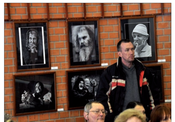
Arcok a Csak tiszta forrásból kiállításon