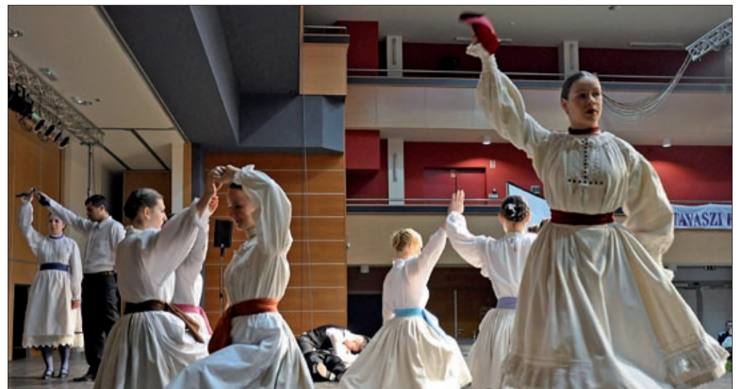
A Csabagyöngye megnyitóján bemutatott Ajtók kitarulnak művet is láthatta a közönség

te” a nemzeti zászlóval, Kossuth és Batthyány arcképével díszített tanácsteremben rendkívüli közgyűlést tartott, ahol elfogadták a tizenkét pontot. A másnapi megyei népközpályázatra érkező komlósi, szarvasi, köröstarcsai, gyomai küldöttek a csabai