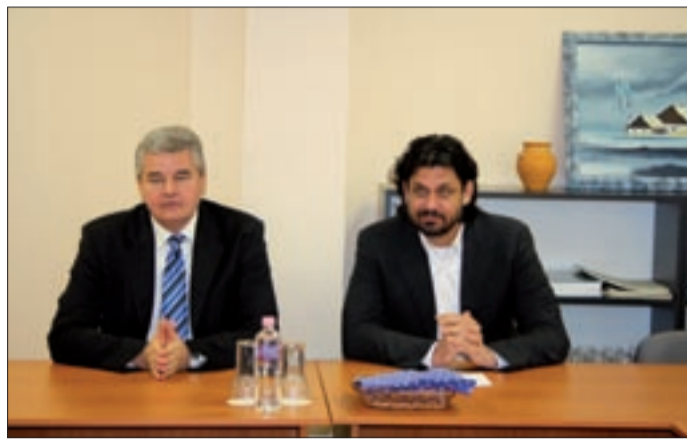
Deutsch: A következő időszak a fejlesztéspolitikáé

– A hétéves, uniós költségvetést nem a segélypolitika, hanem a fejlesztéspolitika kell, hogy jellemezze. A vál-