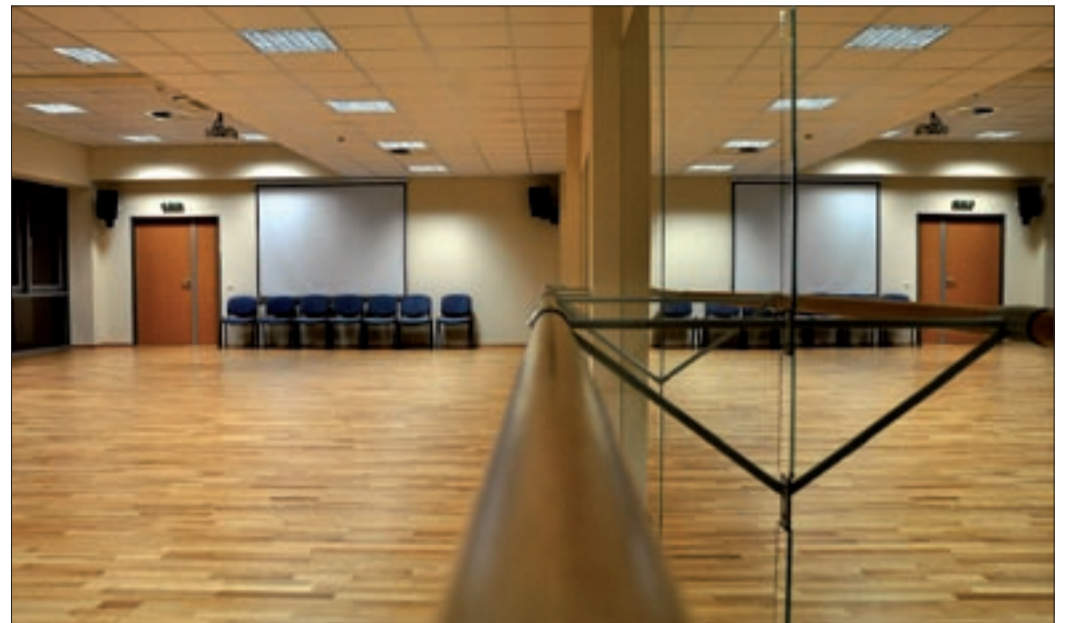
A tükrös teremben minden adott a táncosok gyakorlásához