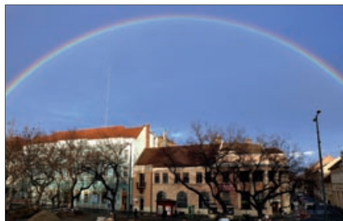
November 29-én ezt láthattuk Békéscsaba felett

A hirdetés részletes szövege a város internetes honlapján a Városháza/Polgármesteri Hivatal/Felhívások, hirdetések/egyéb hirdetések elérési útvonalon található, valamint a Békéscsaba Megyei Jogú Város Polgármesteri Hivatalának hirdetőtábláján megtekinthető.