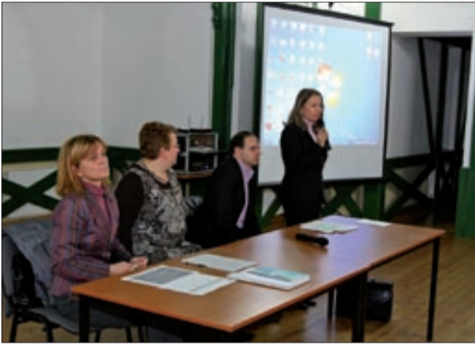
Csabán, a Szt. István tér 9. alatt várják az érdeklődőket

A Békés Megyei Civil Információs Centrum szervezésében tartottak nagyszabású tájékoztató fórumot Békéscsabán a megyei civil szervezetek részére, a NEA civil szervezetek működési költségeire kiírt pályázattal kapcsolatban.