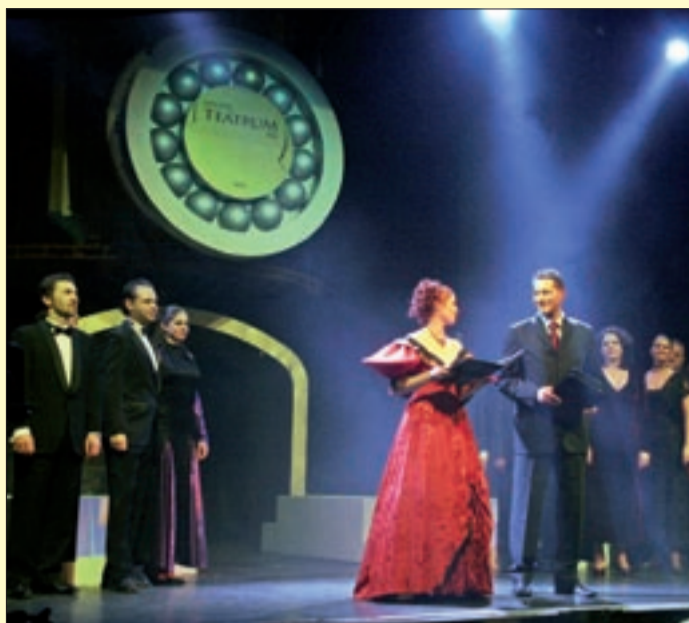
Képünk a tavalyi díjátadón készült

A színházban nincs egyéni siker. Egy-egy produkció megszületése számtalan ember munkáját dicséri. Hajlamosak vagyunk azonban elfeledkezni azokról, akik a színpaloták mögött segítik az előadások létrejöttét. A Magyar Teátrumi Társaság 2010-ben alapított díjat azaz a céllal, hogy felhívja a figyelmet a kulisszák mögötti színházi háttér- és kiszolgáló szakmákra, valamint erkölcsi és anyagi elismerést nyújtson az azokat kiemelkedően magas szinten művelő szakembereknek. Az ország legjobb sűgője, ügyelője, jelmezszerzője, asszisztense, fény- és hangtechnikusa, színpadmestere, műszaki vezetője, fodrásza, sminkmestere érdemelheti ki ezt a kitüntetést, amely a csapatmunka szimbólumaként egy aranygolyót tartalmazó csapágyat formáz. Az elmúlt évekhez hasonlóan ebben az esztendőben is a Magyar Teátrumi Társaság tagszín-