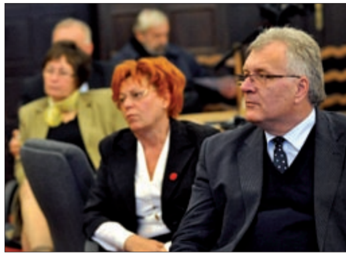
A normatív támogatás nem fedezte a feladatellátást

A 2013. évi koncepcióval kapcsolatban a tanácsnok kiemelte, hogy feladatfinanszírozás lesz az eddigi normatív támogatás helyett. A kórház, a fogyatékkal élők és a szenvedélybetegség gondozását végző intézmények állami fenntartásba kerültek, az iskolák részben ezután kerülnek az államhoz, megkaptuk viszont a színház, bábszínház, és megkapjuk a múzeum, valamint a könyvtár működtetését. Hangsúlyozta,