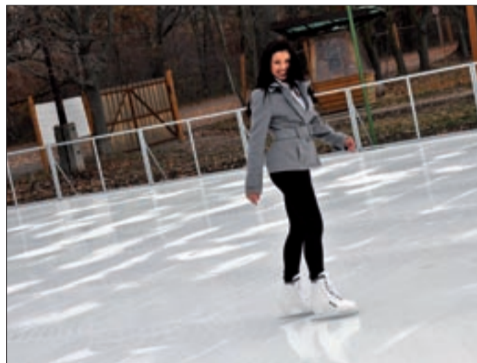
A pálya speciális műanyag borítású