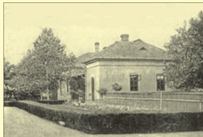
Az egykori Földműves Iskola épületeiről készült képeslapfotó az 1920-as évekből

Az iskola épületeiben igazgatói lakás, internátusi