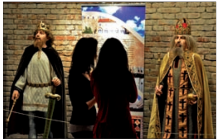
Rendhagyó történelemórákat is lehet itt tartani