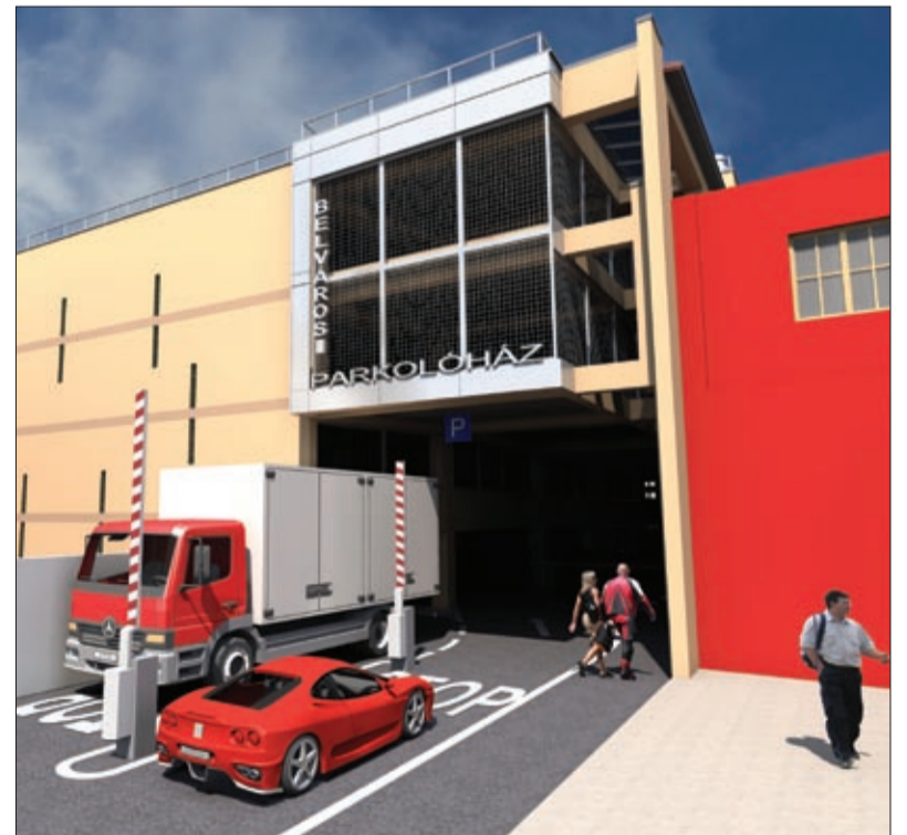
Az ötszintes épületben több mint kétszáz autó parkolhat