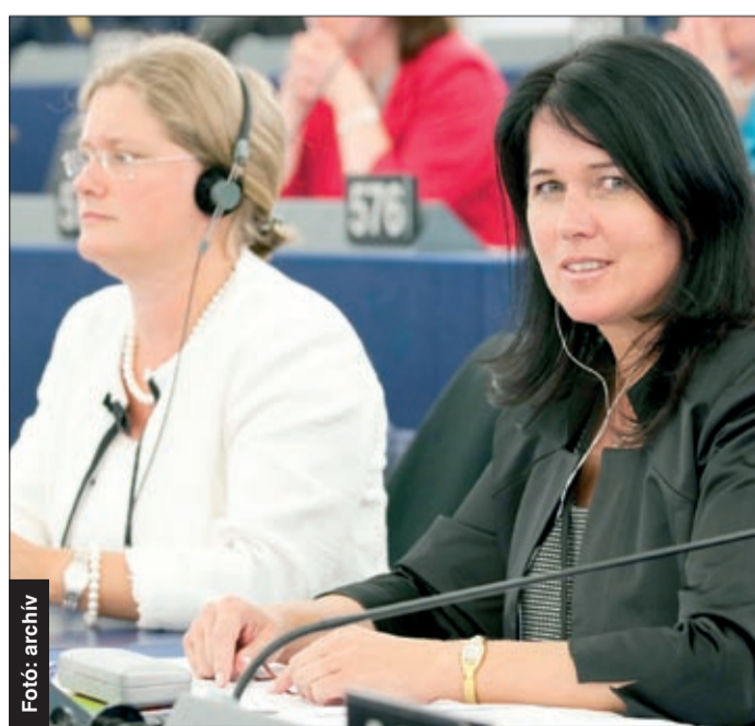
Pelczné Gáll Ildikó képviselő az Európai Parlamentben

– Melyek az irányelvhez kapcsolódó parlamenti jelentés legfontosabb javaslatai?