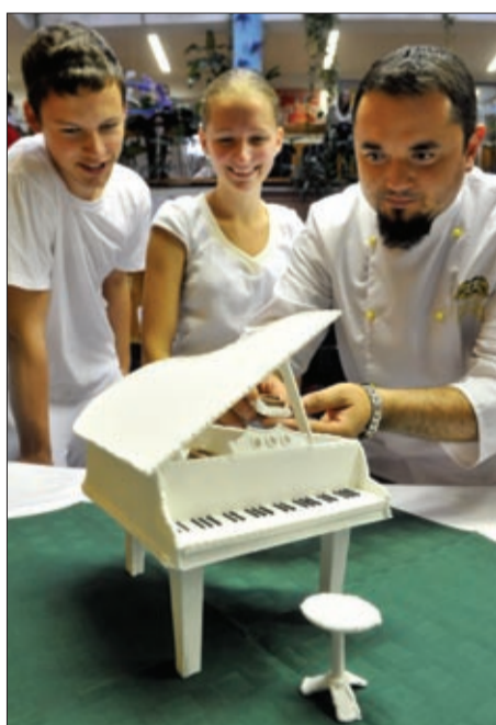
A hangok és az ízek összhangban

Az évfordulóra a cukrász-tanulók – tanáraik felügyelete mellett – készítettek el a díszortát, de emléksztalt is állítottak Liszt Ferenc emlékére. A tányérokat külön erre az alkalomra készítettek Hollóházán. A dísz-tányérok szelén fekete-fehér zongorabilentyüket ábrázoló motívumok láthatók. A megterített asztal további dekorációja is a zene vilá-