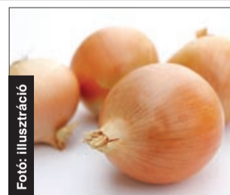
Hiába ízletesebb a magyar dughagyma, a hibrid olcsóbb