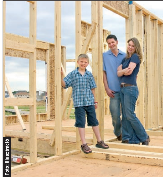
Korlátozták a végtörlesztők vagyonosodási vizsgálatának lehetőségét