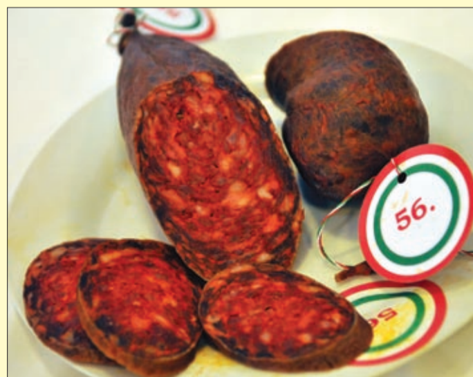
Igazi csabaikum az egyik legszebb versenymű

mindenféle kézműves terméket. Korábban a koncertek főként a sportcsarnokban voltak, most a legnagyobb programok kedvéért egy több mint négyezer négy-