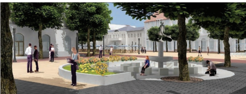
Vantara Gyula a megye szívének szánja Békéscsaba megújuló belvárosát