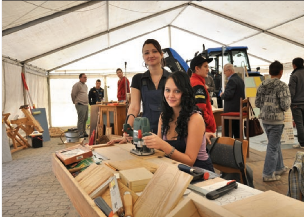
A lányok körében is egyre népszerűbbek az eredendően férfiasnak tartott szakmák

– Mindenképpen a rendezvény sikerét jellemzi, hogy az ideai pályaválasztási vásáronkon több látogató és kiállító van, mint eddig bármikor. Több mint ötezer pályaválasztás előtt álló vagy pályakorrekcióra készülő fiatal vett részt a vásáron. A megye szinte minden szakképző vagy szakképzésben is érintett közép- és felsőfokú intézménye mellett a felnőttképzési szervezetek, a gyakorló intézmények és a nagyobb foglalkoztatók is képviseltetik magukat. Sajnos azt kell mondanom, hogy szép lassan kinőjük a sportcsarnokot, nem tudunk