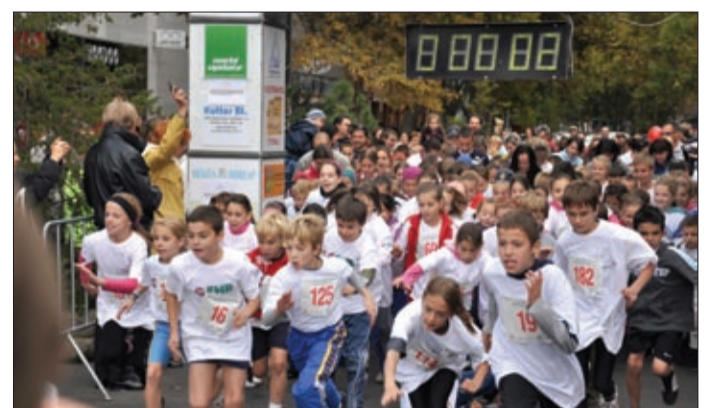
Kicsi a bors, de gyors

A szórakoztatás már délelőtt megkezdődött. A center előtt felállított színpad