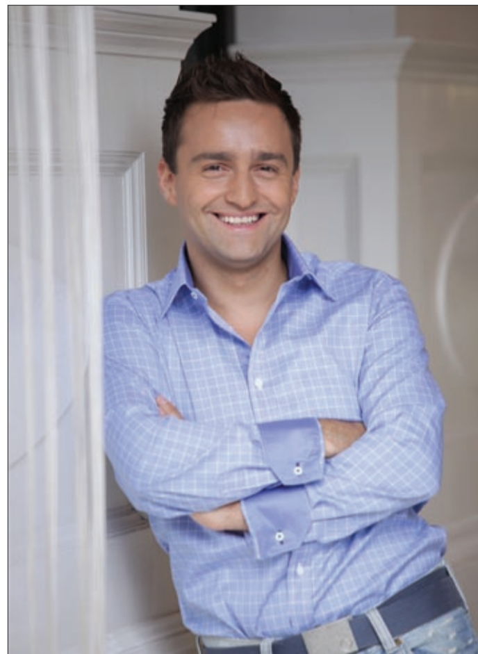
Örömmel dolgozik akár napi tizenhat órát is

– Deamon, akit játszom, nagyon racionális ember, így nem kell semmi mást csinálnom, csak elővennem és működtetnem a racionális éneket. Szerettem a forgatókönyvet, ahol azzal is szembesülünk, hogy sok mindent az életből vettek át. A számítástechnika területe nekem új talaj, nem vagyok technikai analfabéta, de mégsem ez a fő profilom. Itt pedig látom,