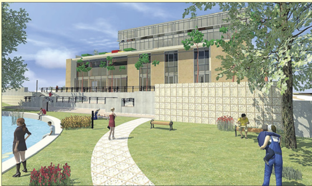
2012 augusztusára az épület már nemcsak a virtuális valóságban várja a közösséget

– Nyitottság, modern szépség és multifunkcionalitás 1,9 milliárdból, mindez négy szinten, 6200 négyzetméteren – foglalta össze az új épület legfontosabb jellemzőit Szente Béla a lapunk egy korábbi számában vele készült interjúban. A Békéscsabai Kulturális Központ igazgatója most hozzátet-