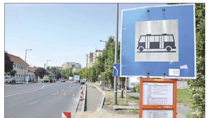
Heteken belül elkészülnek a Bartók B. út buszmegállói is

A társulás több mint 111 millió forint támogatást nyert ahhoz a csaknem 131 millió forintos beruházáshoz, amelynek keretében négy település – Békéscsaba, Újkígyós, Kétsoprony, Csabaszabadi – közösségi közlekedését fejlesztik. Békéscsabán 59,5 millió forintból, Újkígyóson 20,6 millió forintból, Kétsopronyban közel 22,6 millió forintból, Csabaszabadi 12 millió forint-