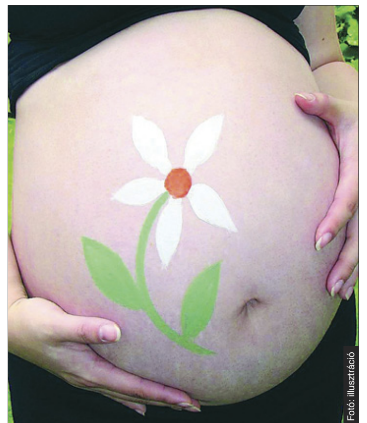
Véd a terhességi csíkoktól is