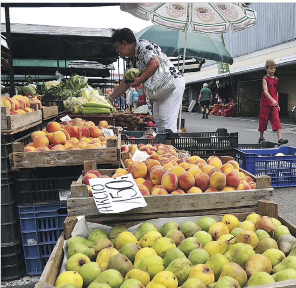
Szín- és ízkaival – a csabai piacon kapható minden, ami az asztalra kell

– Magyarországon tilos a génkezelt magok vetése, viszont évet óta érkezik hozzánk génkezelt szója, amit az élelmiszerekhez kevernek, ezt sérelmesnek találom. Nyolc-tíz éve folyamatosan amellel érvelek, hogy a magyar élelmiszereket előnyben kell részesíteni. Hoztak már ide melaminnal dúsított tejport, dioxinos csirke- és sertéshúst, rákkeltő aflatoxinnal mérgezett pipropaprikát, nem beszélve az erősen vegyszeres primőrökről. Ma már szakmai csoportok, egyesületek lépnek fel a magyar élelmiszerek népszerűsítéséért, és talán a vásárlók is tudatosabban keresik a hazai árukat. A szakemberek ellenőrzések