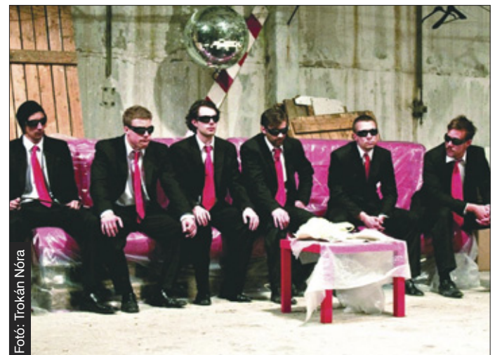
A Kutyaszorítóban című filmet vitték színpadra

előtt vettem meg az első digitális gépemet, azóta ez tölti ki minden szabad időmet, találtam egy új szenvedélyt. Főleg arccokat, gesztusokat szeretek fotózni. Nagy megtisztetésnek tartom, hogy a színház- és film- egyetem új honlapjához is én készítettem a fényképeket. G. B.