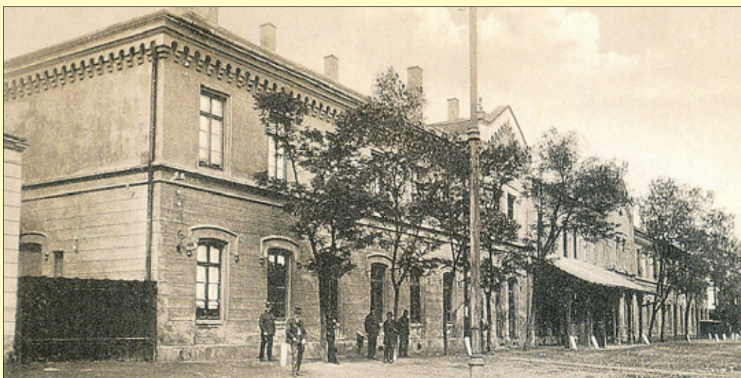
A békéscsabai vasútállomás legrégebbi, a pályaudvar felőli látképe

Hazánkban a reformkorban ismerték fel a vasút sokoldalú gazdasági és társadalmi fejlesztő szerepét. A mezőgazdasági termelésből élő Alföld számára – különösen a gabona jobb értékesítési lehetőségeit keresve – létkérdéssé vált a korszerű tömegszállítás.