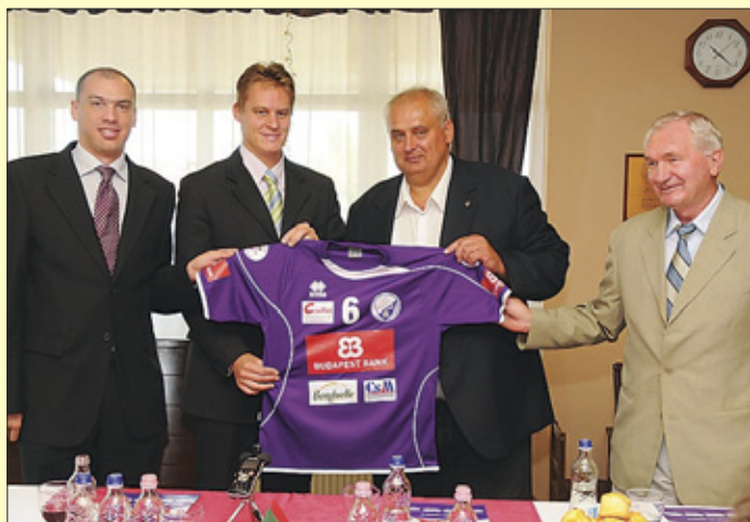
Új szezon, régi támogató