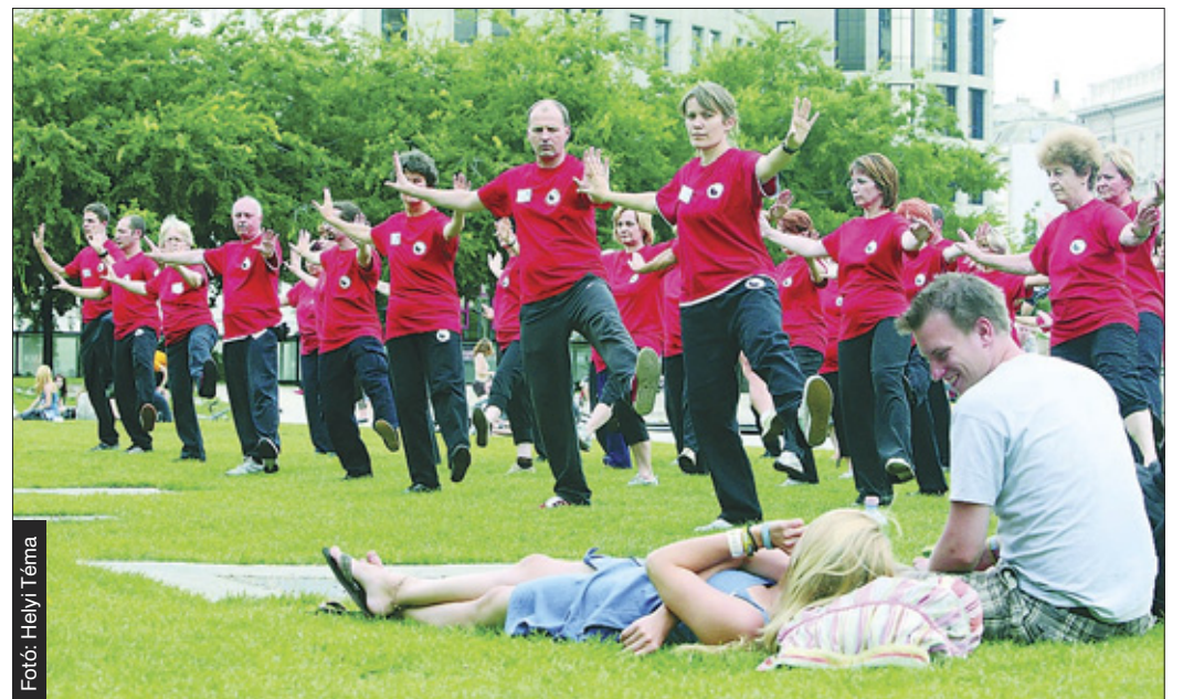
Mindenki saját képességei szerint gyakorolhat

pülő mozgásforma mindenkinek lehetőséget ad arra, hogy saját testi képességeinek megfelelően gyakoroljon.