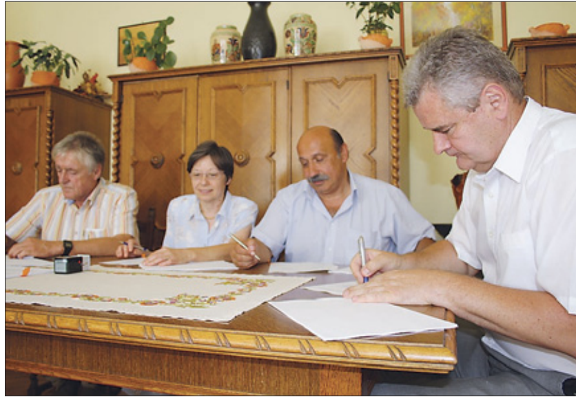
A szerződés augusztus 30-ai aláírásával végre elindult a beruházás

forint szükségeltett volna, hogy az épületet saját erős beruházásként olyan állapotba hozza a fenntartó, amivel az minimum további tíz-tizenöt évig alkalmas lett volna a funkciójának betöltésére. A válaszom tehát, hogy valószínűleg egyszerűbb lett volna, mivel önerős beruházásként és egyszerű közbeszerzési eljárás keretében kiválasztott kivitelezővel gyorsabban megvalósult volna a beruházás, de a