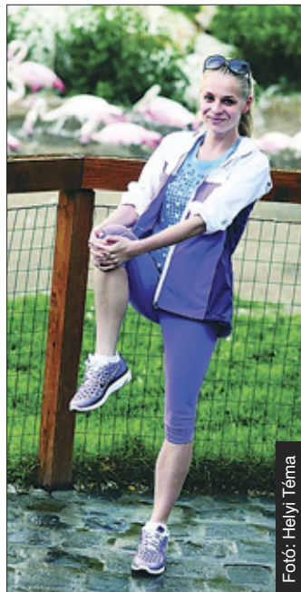
Cápaporccal védekezett az allergia ellen