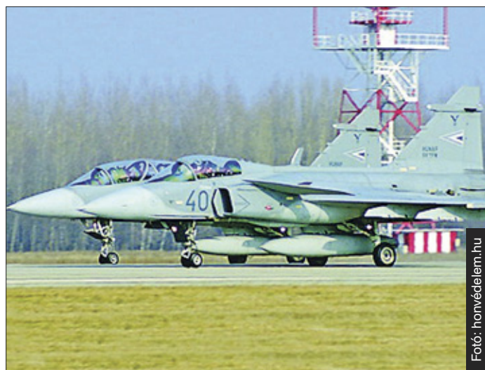
Sokmilliárdos értéket mentett meg

nagy a honvédelmi miniszter által adományozható legmagasabb kitüntetést, a Hazáért kitüntető címet kapta meg. BöE