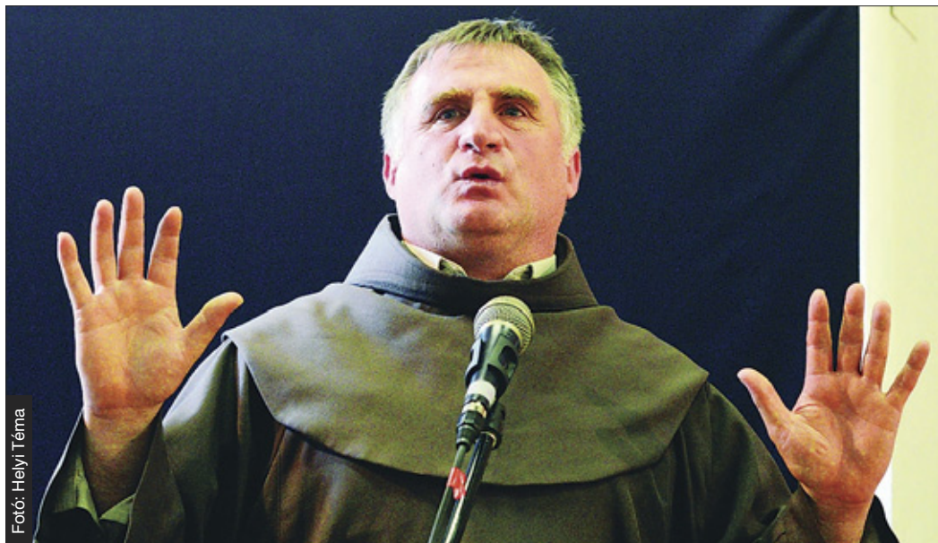
A személyes istenkapcsolatnál fontosabb nincsen

– Megfogom a kezét, elvinném az oltár elé, Isten közelébe, és azt mondanám: Nézd, kis barátom, ő Jézus, a mi istenünk, legyenek jóban, szeressétek egymást, beszélgetsetek, na puzsi, én elmentem! A személyes istenkapcsolatnál fontosabb nincsen. Hiszem, hogy mindenki erre vágyik, arra a bizonyosságra, hogy nincs egyedül, mindig van kire számítani! BöE