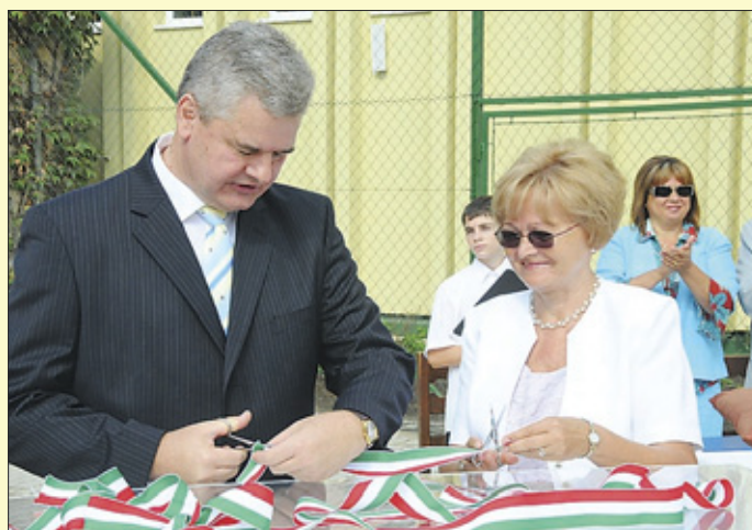
Ünnepélyes szalagátvágás a megújult Kazinczy iskolában

fedés cseréje, homlokzat hőszigetelése, falak szigetelése, padló- és falburkolatok cseréje, épület akadálymentesítése, fűtési rendszer és villanyhálózat korszerűsítése, tanterem struktúráltsági kábelezése, játszóudvar kialakítása, nyílászárók cseréje, vizesblokkok felújítása, eszközbeszerzés (új asztalok, székek).