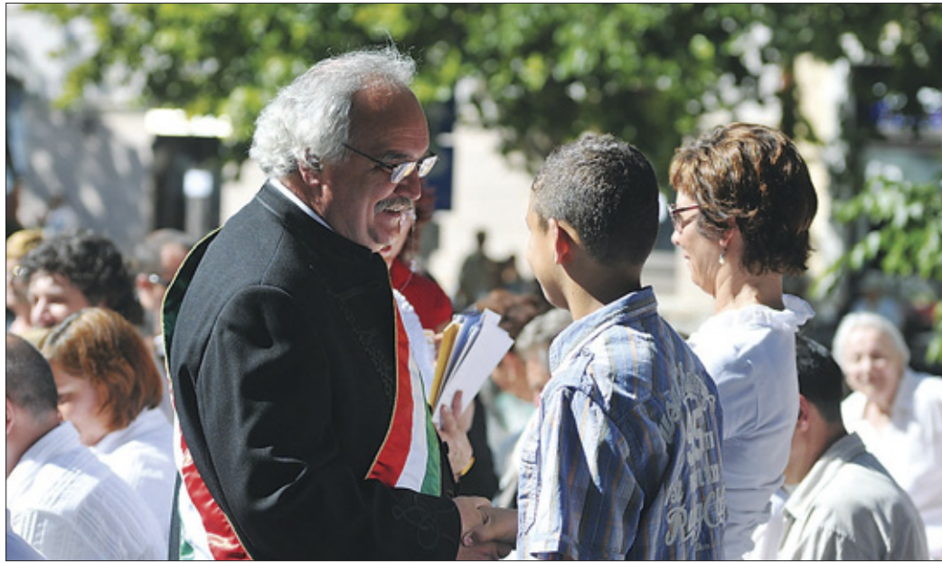
Megható pillanatok az ünnepélyes eskütétel közben