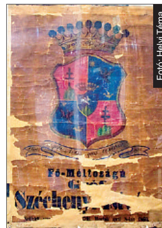
A megmentett címert

– Jó viszonyban volt Széchenyi Istvánnal, aki leveleiben „barátom”-ként emlegette – mondta el Tolnay József az átadáskor. – Jellemző rá, hogy