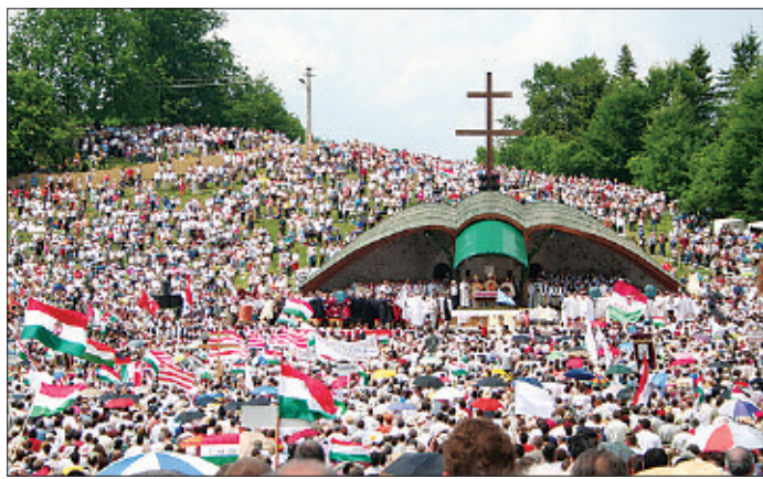
Magyarok százezrei a szentmisén

A Kárpát-Észak-Érdély elvesztését követően megszűnt, és csak nemrég indult újra útnak. Nem véletlenül mondják a szerelvényt nemzeti lobogókkal váró székelyek az anyaországiaknak: késtetek 64 évet.