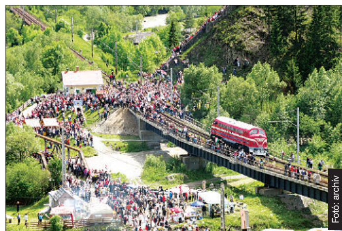
A Nohab Gyimesbükön, az ezeréves határon

ökumenikus istentiszteletévé, találkozási pontjává vált. Ide vitt először három esztendeje nyolc kocsiban négyszáz zarándokot a szent koronás magyar címerrel díszített Nohab dízelmozdony.