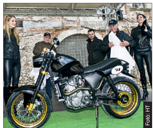
Az új Pannoniát magyar tervezők álmodták meg, és a gyártás kilencven százaléka is itthon történt

A Bol d'Or, vagyis Aranysisak névre keresztelt motor egy 55 darabos, limitált széria első darabja, amellyel a márka korábbi sikerei előtt