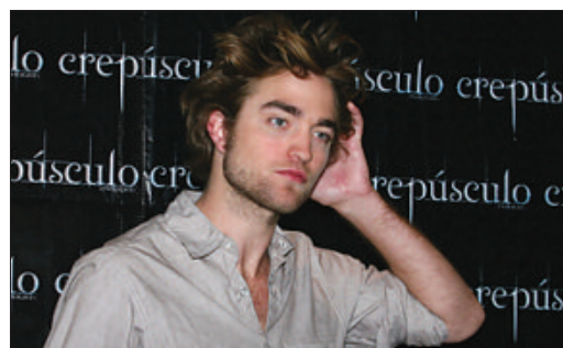
Robert Pattinson a tinilányok kedvence

Hazánkban forгат a tinilányok kedvence, Robert Pattinson, és sok férfi álma, Nicole Kidman. A két sztár a Bel Ami című kosztümös filmben egy párt alakít majd. Az Alkonyat filmek sztárja, Robert Pattinson a készülő produkcióban a francia író, Guy de Maupassant bőrébe bújik. A film a művész botrányos