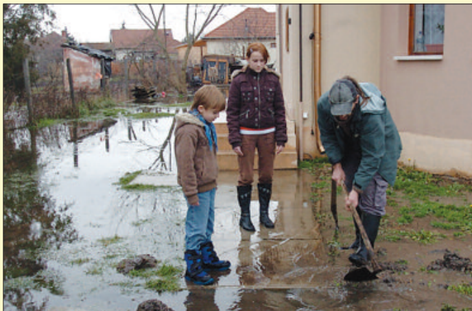
Az önkormányzat és a városlakók megküzdöttek a belvízzel