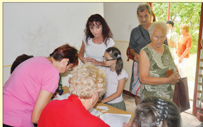
Békéscsabán cukrot, lisztet osztanak a rászorulóknak