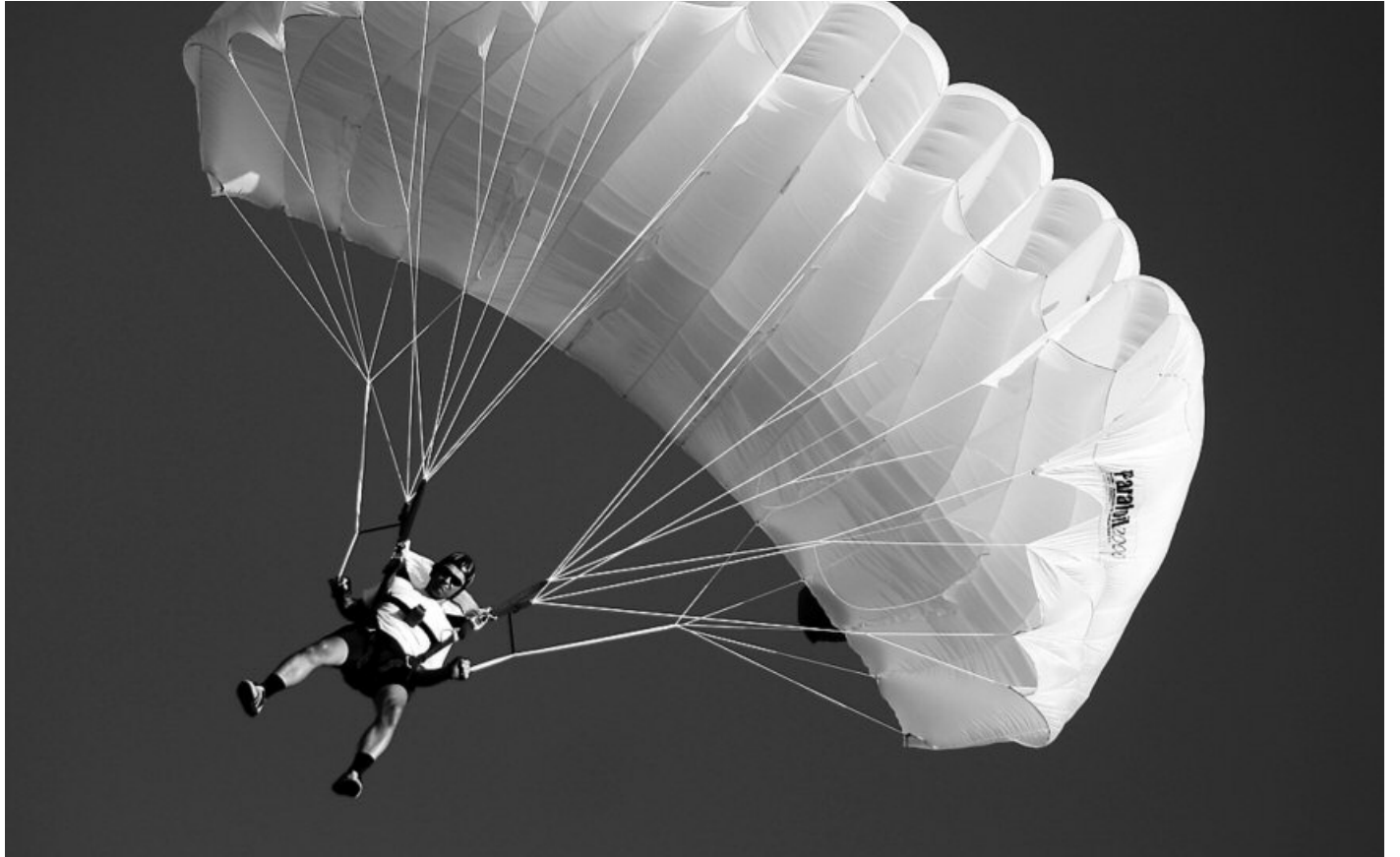
Békéscsabán, ahol hagyománya van e sportnak, nagy sikerrel rendezték meg az ejtőernyős nemzeti bajnokságot

A részletekről a pályázók a minisztérium ( www.khem.gov.hu ) és az Energia Központ Nonprofit Kft. ( www.energiakozpont.hu ) honlapjáról tájékozódhatnak, itt található meg a pályázat beadáshoz szükséges nyomtatványok. A hitelprogram részletes feltételei és a finanszírozó hitelintézetek elérhetősége a Magyar Fejlesztési Bank Zrt. ( www.mfb.hu ) honlapjáról tölthetők le.