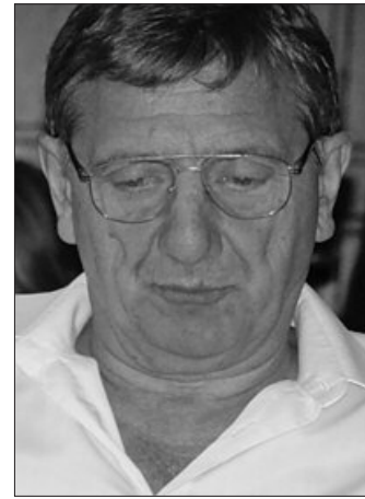
Főherceg Gimnáziumból lett a Rózsa Ferenc Gimnázium,