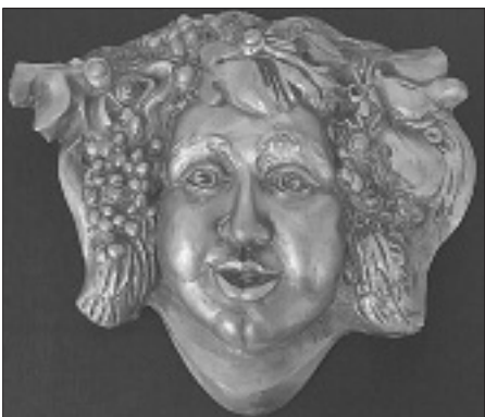
Takács Győző műve

„Az a tény, hogy anyanyelvem magyar, és magyarul beszélek, gondolkodom, írok, életem legnagyobb eseménye, melyhez nincs fogható... Mélyen bennem van, a vérem csöppjeiben, idegeim dúcában, metafizikai rejtélyként. Ebben az egyedülvaló életben csak így nyilatkozhatom meg igazán” – írja Kosztolányi Dezső. Mindennapi életünk során, a munka, a hétköznapok gondjai közepe telén a kelleténél ritkábban szakítunk időt arra, hogy elmerengjünk erről, vagy elmélyülten foglalkozzunk tárgyi és szellemi értékeinkkel – a magyar kultúra napja lehetőséget teremtett erre Békéscsabán is.