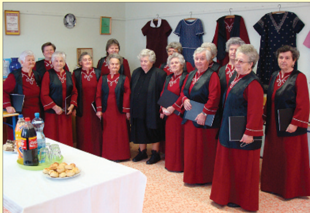
Jubileumi összejevetelt tartott a mezőmegeyeri asszonykórus

A közgyűlés utolsó részében a 2008. évi megyei versenynaptárt véglegesítette a közgyűlés. Eszerint lesz kick-box light és semi-contact, taekwon-do touch és hard-contact, kyokushin karate knock-down megyei bajnokság. Idén Mezőberény, Okány, Füzeggyarmat, Békéscsaba, Magyarbánszemes, Szeghalom, Gyula ad otthont a megyei rendezvényeknek, Battonyán, Mezőhegyesen, Szeghalmon és Kondoroson országos versenyt rendeznek. Haba József mester (Békéscsabai Lakótelepi SE) külön kérte az edzőket, hogy minél nagyobb létszámot mozgósítsanak a megyei bajnokságokra. A közgyűlés eredményesen és jó hangulatban fejezte be munkáját.