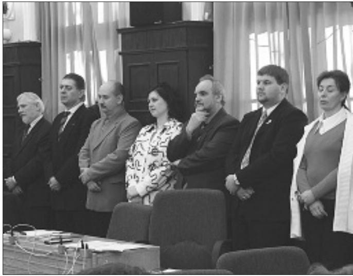
Önkormányzati képviselők a testületi ülésen

Csabai Mérleg ingyenes városi lap, Békéscsaba. Felelős szerkesztő: Fehér József. Nyomdai előkészítés: Várhegyi János. Felelős kiadó: Békéscsaba Vagyonkezelő Zrt., Kozma János cégvezető. Szerkesztőség: 5600 Békéscsaba, Szabadság tér 11-17. I/28. Tel.: 66/523-855. Megjelenik kéthetente 28 000 példányban. E-mail: csabai.merleg@bekescsaba.hu. Hirdetésszervezés: Bayer Bt.