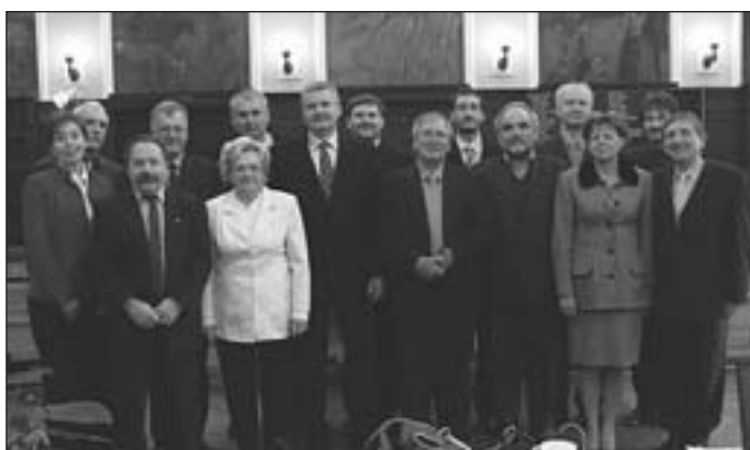
A békéscsabai közgyűlés Fidesz-frakciójának tagjai jó karácsonyt és boldog új évet kívánnak a város lakóinak