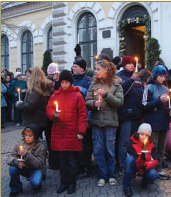
Békés, boldog, áldott karácsonyt és boldog új évet kívánunk valamennyi kedves olvasónknak. Lapunk legközelebbi száma 2008. január 17-én jelenik meg.