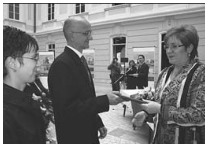
Miniszteri kitüntetést kapott az Aut-Pont