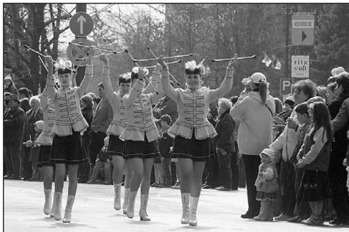
Sokan kilátogattak a békéscsabai megemlékezésre