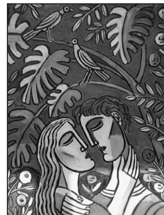
Jankay Tibor: Szerelmespár madarakkal. 1980-as évek, 127 x 97 cm, olaj, vászon, fa

Jankay Tibor, ezeket a sorokat élete vége felé vetette papírra, körülbelül a festménnyel egy időben, így azt a művészi- és életutat mindkettő mögött tudhatjuk, amit addigra már bejár, megtapasztalt és megtanult.