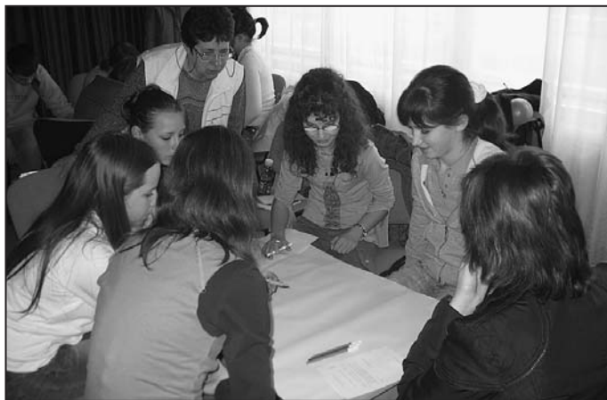
Tartalmas munkát hozott a tavaszi ifjúsági parlament

A záró plenáris ülésen elhangzott beszámoló, észrevételek, ötletek eljutnak a város vezetőihez, a Polgármesteri Hivatal érintett osztályaihoz, hogy a javaslatok megvalósítási lehetőségeit áttekintsék.