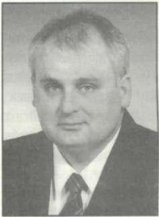
Hanó Miklós alpolgármester

H ANÓ MIKLÓS volt már országgyűlési képviselő, 1994-től négy éven át tanácsnok, majd 1998-tól egy ciklusban társadalmi megbízatású alpolgármester. Jelenleg a polgármester általános helyettese, alpolgármester, a 11. számú választókerület egyéni képviselője, és persze gazdálkodik.