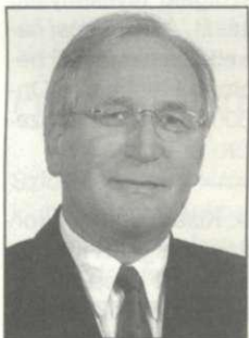
Köles István alpolgármester

K ÖLES ISTVÁN néhány hónapja a Trefort Ágoston Villamos- és Fémipari Szakképző Iskolában tanított, ellenzéki képviselőként politizált, és tervezgette, hogy nyáron, a hatvanadik születésnapjára a benne „felgyülemlett muzsikából” egy lemezt készít. Nos, a lemez készítése félbeszakadt, a zenei pályafutását összegző jazz-rock lemeze még egy ideig várta magát.