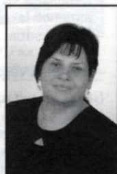
Törökné Lukács Betarix Nagycsaládosok Egyesülete 7. vk.