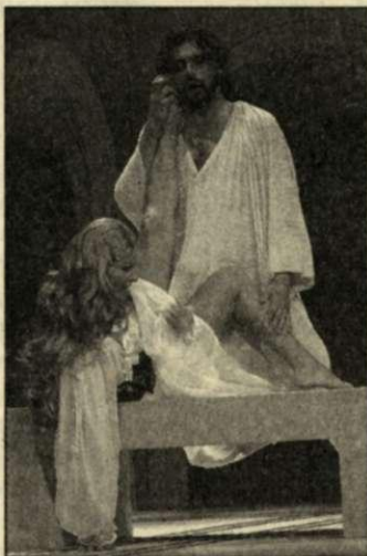
Jelenet az előadásból