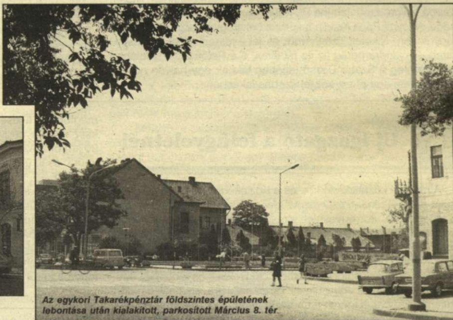
Az egykori Takarékpénztár földszintes épületének lebontása után kialakított, parkosított Március 8. tér