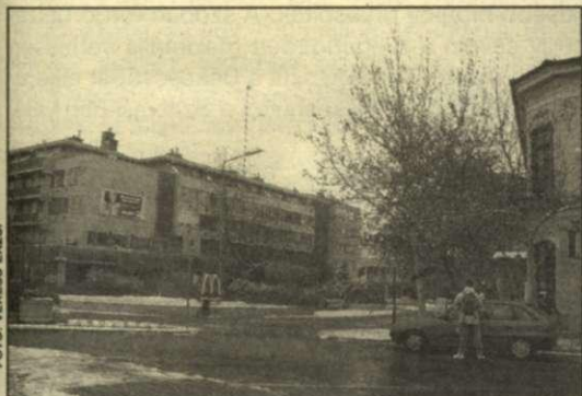
A park helyén épült emeletes lakóépületben a csabai főposta