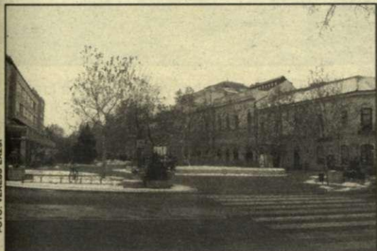
A mai Andrassy út eleje

múlt fél évszázad alatt nevezték Sztálin útnak és hosszabb időn át Tanácsköztársaság útja volt. Elkövetkezendő néhány számunkban, az 1950–60-as években megörökített fotókkal idézzük fel főutcánkat egykori házaival.