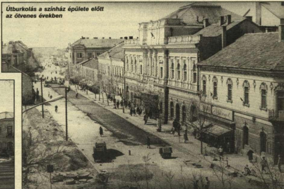
Útburkolás a színház épülete előtt az ötvenes években

A belvárost a városközponttól a vasútállomásig átszelő, Csaba első kövezett főutcája az idők folyamán több nevet is viselt. Az el-