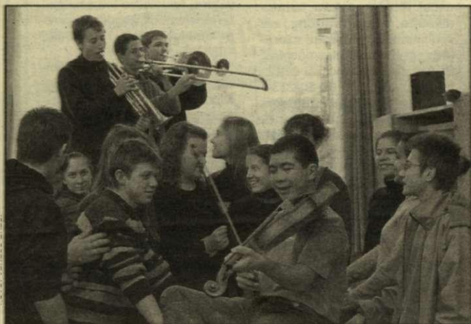
Ők már megtalálták az igazit