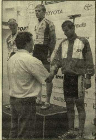
A legjobbak a dobogón