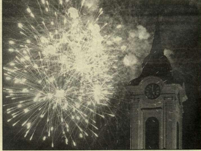
Az augusztus 20-i tűzijáték