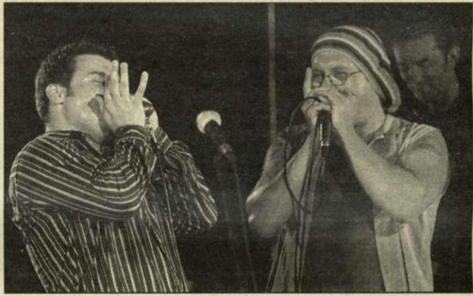
A Blues Fools a Városházi Estéken