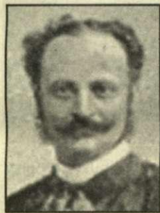
Dr. Wlassics Gyula (1852-1937)

Jogi egyetemi tanulmányait Budapesten és Bécsben végezte, bírósági szolgálatba lépett, majd az igazságügyi minisztériumba került. 1890-től egyetemi tanár volt, 1892-ben pedig országgyűlési képviselővé választották. A Bánffy-kormányban 1895-ben kapta meg a vallás- és közoktatásügyi miniszteri tárcát. A Széll-, majd a Kuen-Héderváry-kormányban is miniszter volt, tagja lett a hágai választott bizottságnak, betöltötte a főrendiház és a felsőház elnöki tisztét. Nevéhez fűződik az ezredéves ünnep alkalmából