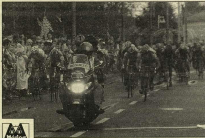
A Tour de Hongrie verseny közben