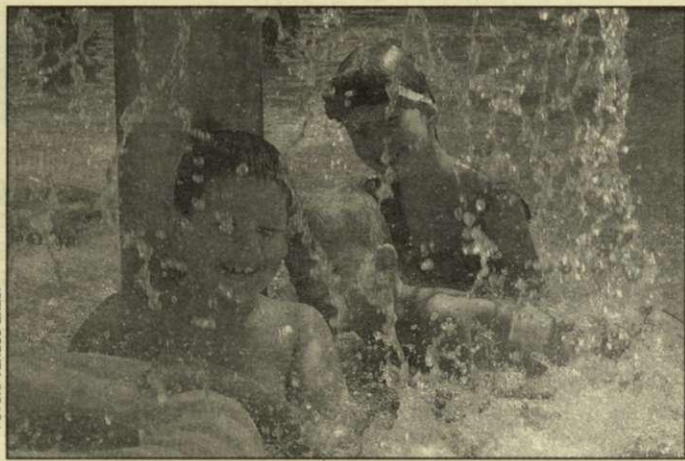
Jaj, úgy élvezem én a strandot!