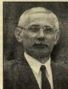
Dr. Vécsei László

Békécsabán példamutatóan sok civil szervezet munkálkodik, mozgatja meg időről időre az embereket. A szervezetek ugyancsak a KÉK-bizottsághoz nyújtják be pályázataikat. A felosztható pénz kevés, így inkább csak jelképesnek mondható az az összeg, amellyel a közgyűlés segíti munkájukat. A pályázatok a civil szervezetek, nemzetiségi szervezetek, polgárőr-csoportok, nyugdíjasszervezetek, a drogprevencióval foglalkozó csoportok működéséhez és az egyházi épületek fenntartásához, korszerűsítéséhez nyújtanak támogatást. Az önkormányzat ezen pályázataira a legnehezebb években is számíthatnak a város polgárai.