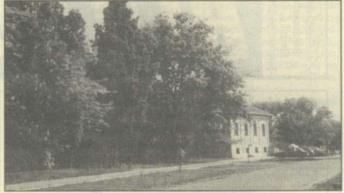
A hajdani első kád- és gőzfürdő épülete ma