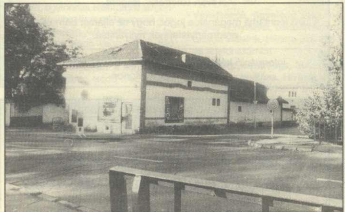
Az artézi gőz gyógyfürdő mai helyszíne