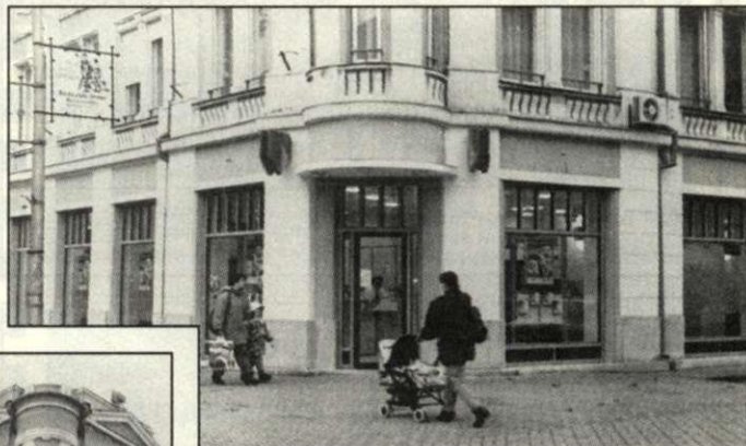
Mai fotó a 75 éves épületről. A megszűnt büfé helyén az ABN-AMRO Bank csabai fiókja kezdte meg pár hete pénzüintézeti tevékenységét, bár ezt még egyértelmű felirat nem jelzi