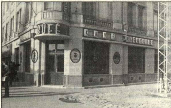
A büfé külső és belső fotója az 1980-as években

A büfé olcsóbb, magyaros ételei hiányozni fognak a most már csak drágább, idegen ízeket kínáló belvárosunk gyorsétkező étlapjáról.