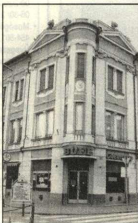
A büfé főbejárata 1998-ban, a megszűnés előtt