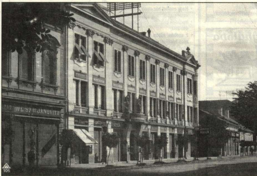
A Kocziszkypalota Andrassy úti homlokzata 1930 körül. A szép épület alsó szintjén végig üzletek sorakoztak

építőmester tervezte, és vállalata kivitelezte. A Kocziszkypalota néven ismert bérház alsó szintjén 1952-ig üzletek sorakoztak. A monumentális, szép épületben 1953. február 7-én nyílt meg a Népbüfé, a megyei vendéglátó vállalat új üzlete. A legmodernebb konyhai berendezéssel felszerelt gyorsétkeztető vendéglátóhely 30-féle olcsó, ízletesen elkészített étellel, cukrászsüteménnyel, üdítő- és szeszes itallal várta vendégeit kora reggeltől késő estig. A többször átalakított „talponálló” büfé tavalyi bezárásáig 45 éven át volt látogatott, népszerű gyorsétkező. Helyén átalakítás után újabb pénzüintézet, az ABN-AMRO Bank nyitott elegáns fióküzletet.