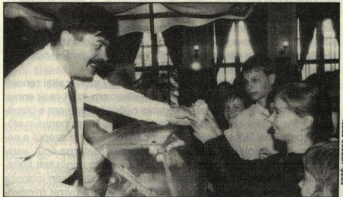
Fagyiparti a polgármesterrel