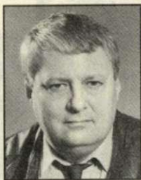
SZILVÁSSY FERENC alpolgármester MSZP