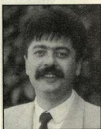
PÁP JÁNOS polgármester SZDSZ

Az április 25-i időközi választással teljessé vált a városi közgyűlés létszáma. Íme 28 képviselőnk.