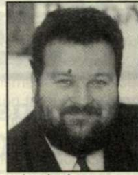
VÉGH LÁSZLÓ alpolgármester Fidesz-MPP