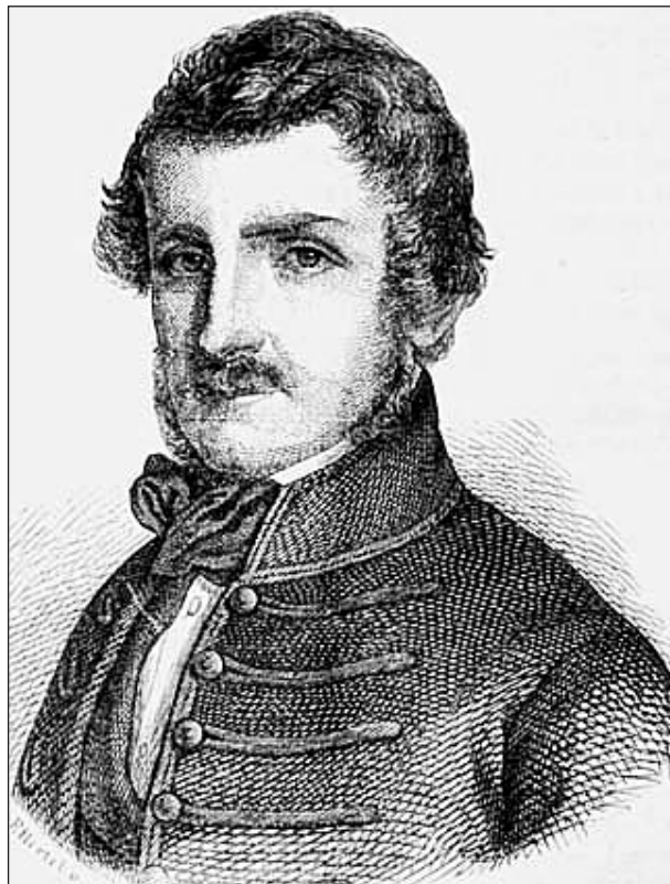
A Vasárnapi Újság (1859) nyomán