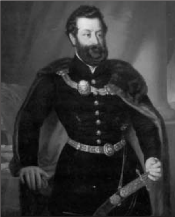
(III.) Andrássy Károly

Tisza-szabályozási bizottságnak is tagja volt. Vas-, cukor- és gépgyárakat ment tanulmányozni Nyugat-Európába, amikor váratlanul, 53 éves korában elhunyt. Talán saját kudarcaiból levont tapasztalatából taníttatta mindhárom fiát kiváló iskolákban: Manót , a vasipari birodalmat létrehozó tőkés vállalkozót, Gyulát , a kiegyezés utáni magyar miniszterelnököt és közös külügyminisztert, valamint Aladárt , a szabadságharc ifjú őrnagyát.