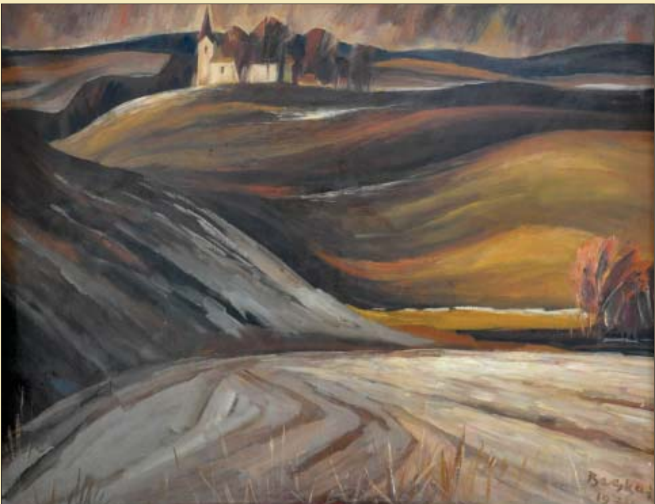
Olvasás (1974) • A losonci Nógrádi Múzeum és Galéria gyűjteményeiből