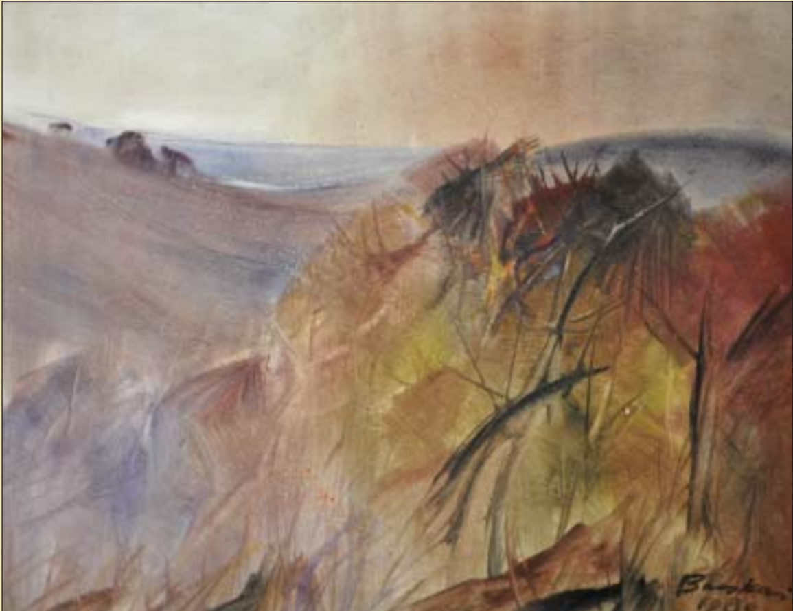
Lila táj (1980) • A losonci Nógrádi Múzeum és Galéria gyűjteményeiből