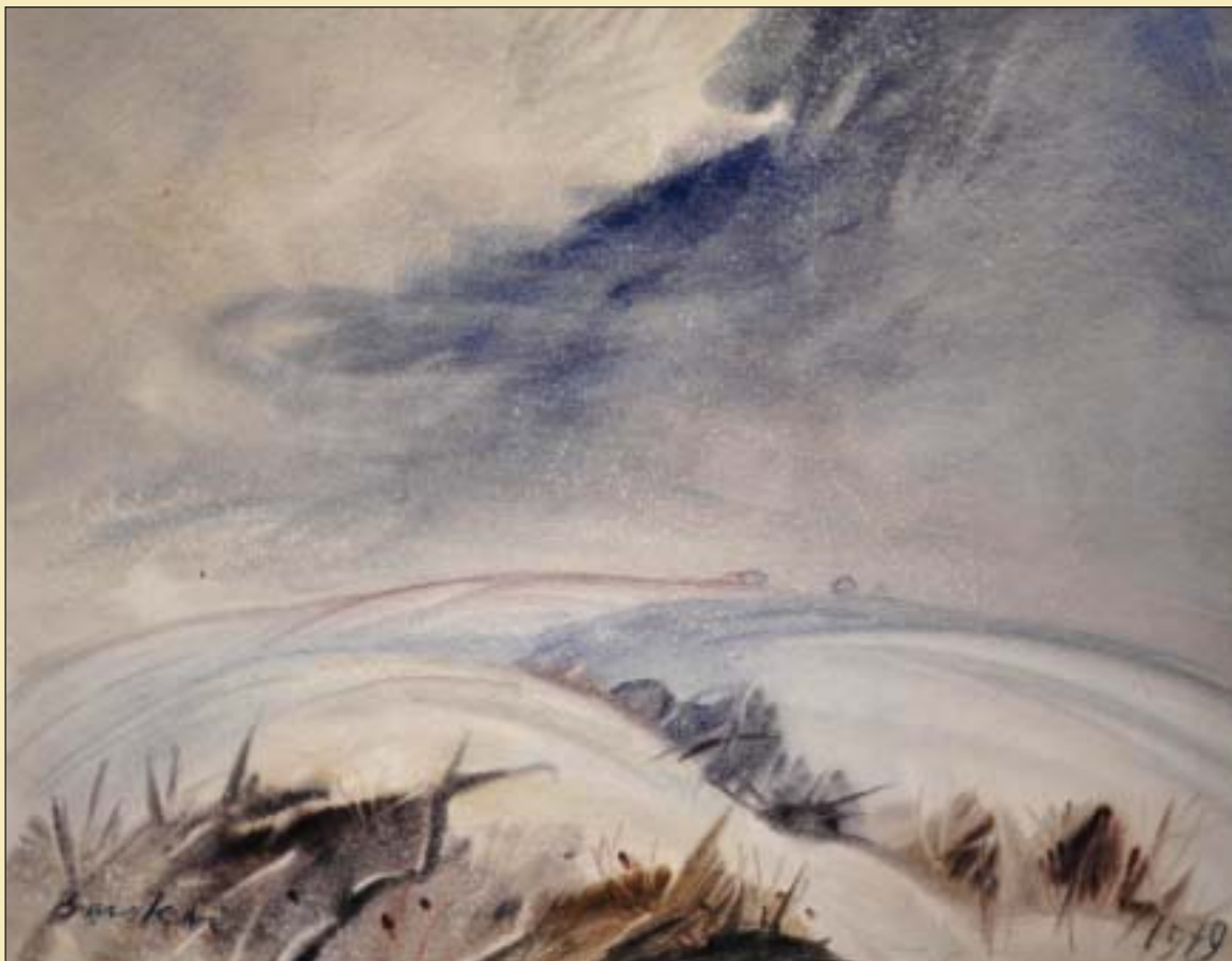
Téli vihar (1979) • A losonci Nógrádi Múzeum és Galéria gyűjteményeiből