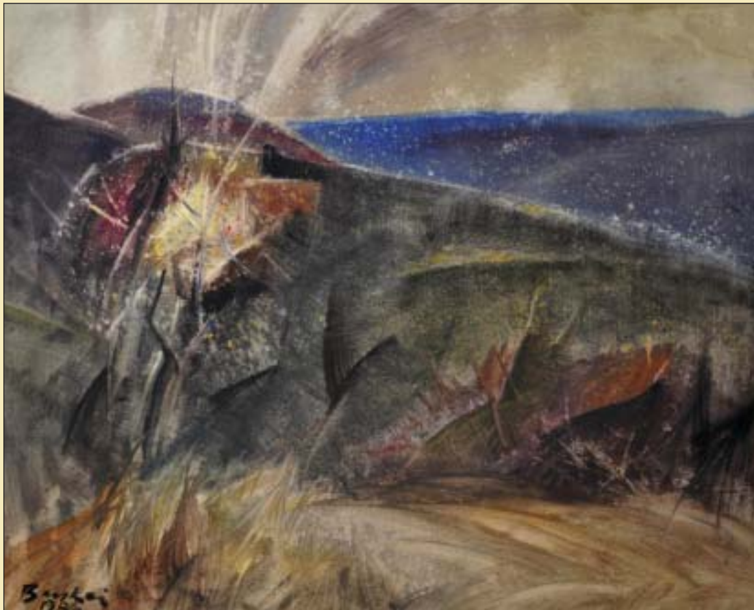
Táj fényel (1980) • A losonci Nógrádi Múzeum és Galéria gyűjteményeiből