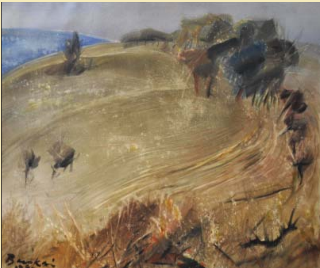
Forró szél (1980) • A losonci Nógrádi Múzeum és Galéria gyűjteményeiből