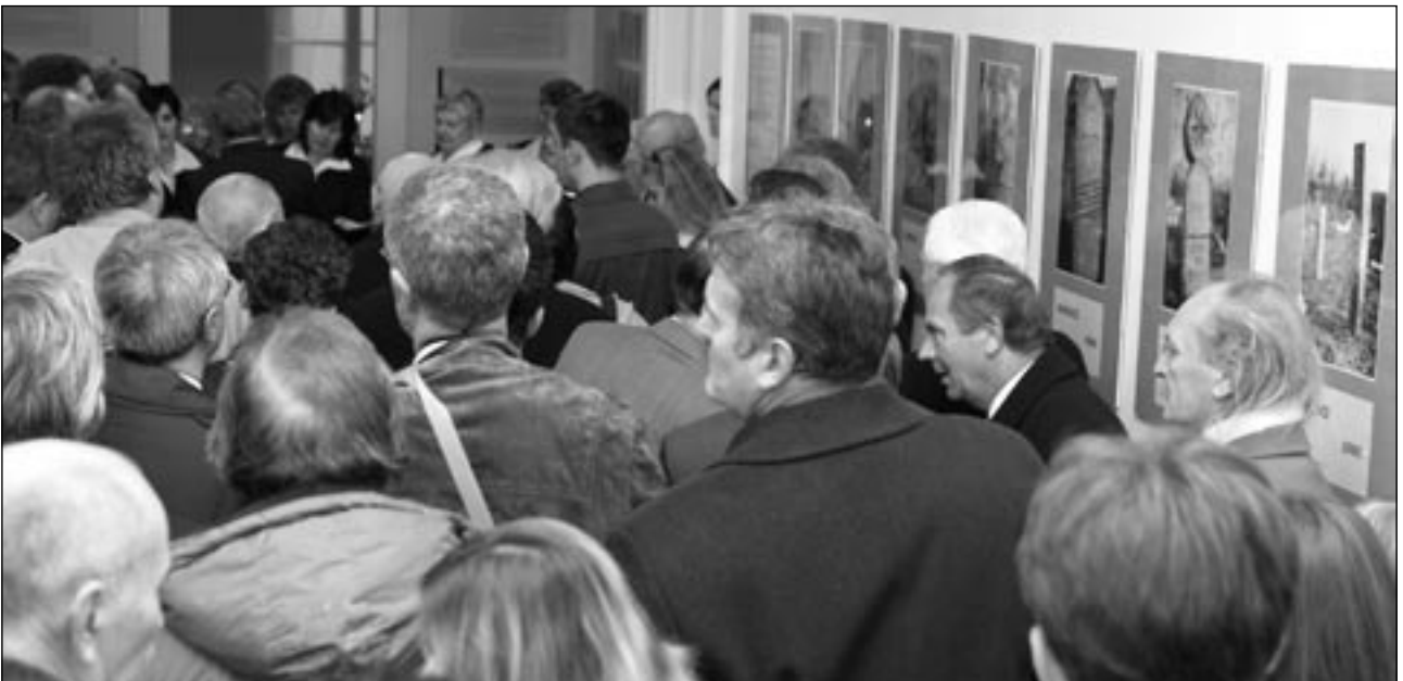
A résztvevők