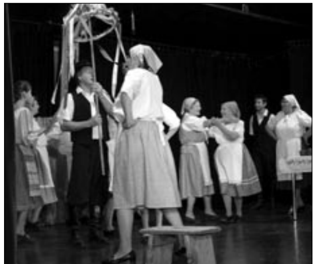
Aratási ünnepség szomori módra