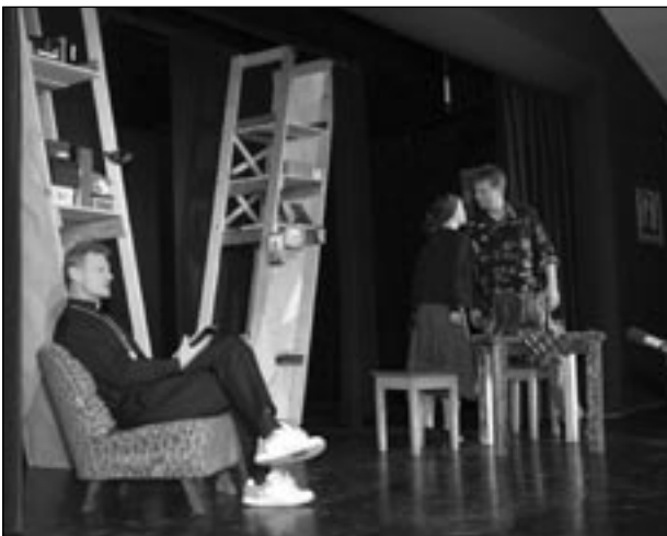
A füleki Zsákszínház az Elveszett erkölcsök című, a Jókai Napok on fődíjas előadását a füleki Zsákszínház előadásában, s a durva nyelvezetű kortárs író dráma, az Elveszett erkölcsök komoly visszhangot (egyesek körében felháborodást) keltett. Mai rohanó, egyre reménytelenebb világunkra reflektál a határon túli diákok által alapított budapesti Wataridori Színház Shot c. előadása is. De