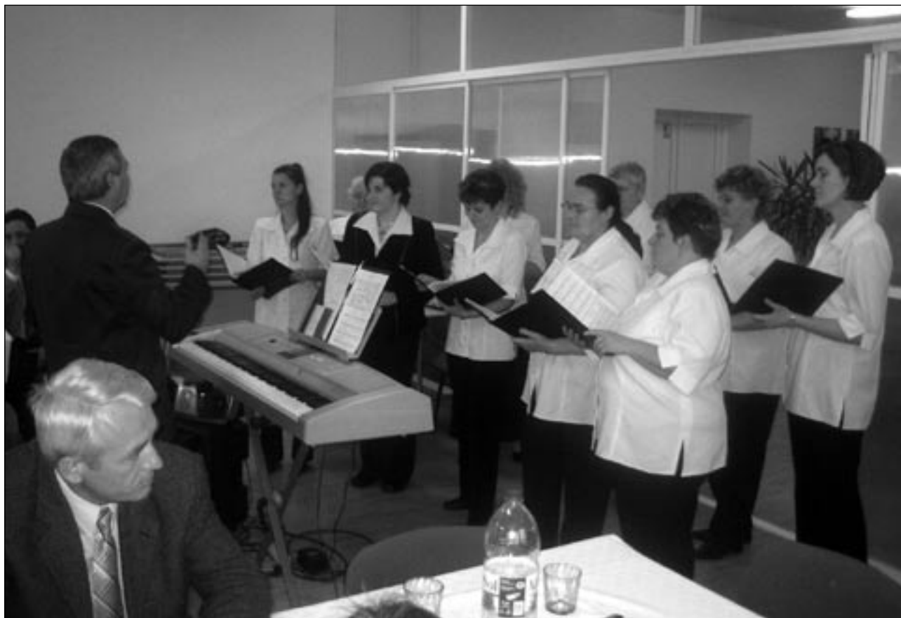
A Hanvai Asszonykórus fellépése