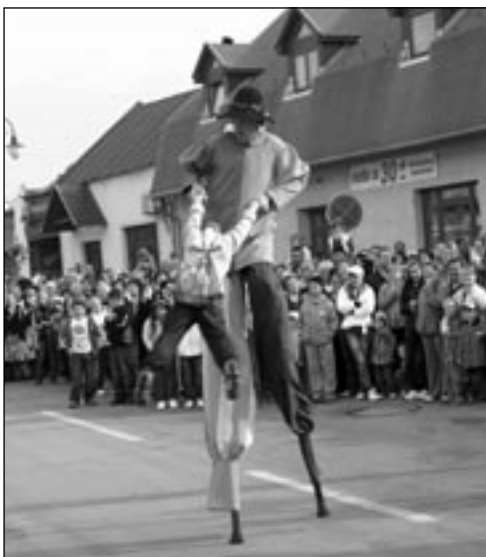
A fesztivál egy mozzanata •