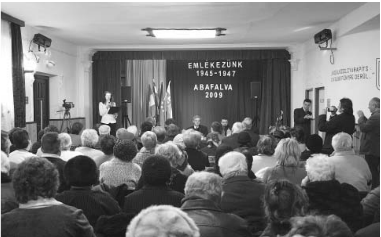
Az ünnepi közgyűlés