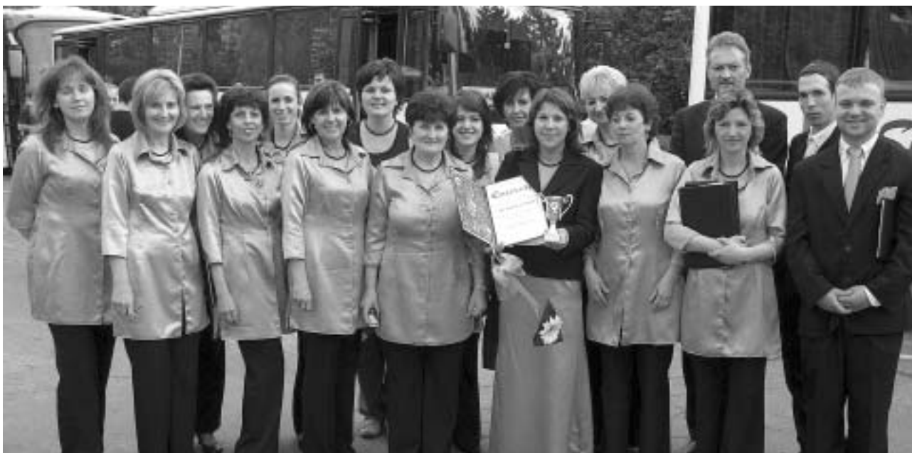
A Blaha Lujza Vegyeskar