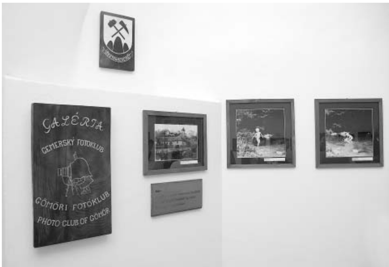
Részlet az állandó kiállításról

hallgatta el, hogy diavetítéses előadásai során soha nem hagyja ki Beretkét és a környékét. Így sikerült felkelteni több gömői és felvidéki iskolának az érdeklődését, sőt a Prágai Magyar Kulturális Intézet mellett működő Iglice Egylet tagjai az idei nyári táborozásuk alkalmával, melyet a szervezet minden évben, immár hagyományszerűen megszervez a csehországi magyar gyerekek részére, Beretkére látogatnak. Így van értelme a Galériának, mert az idelátogatóknak egy színfolttal több a látnivaló, hangsúlyozta Benedek László.