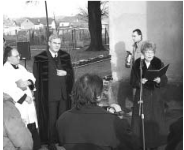
Koszorúzás. A mikrofon mögött Hanobik Irén polgármesterasszony