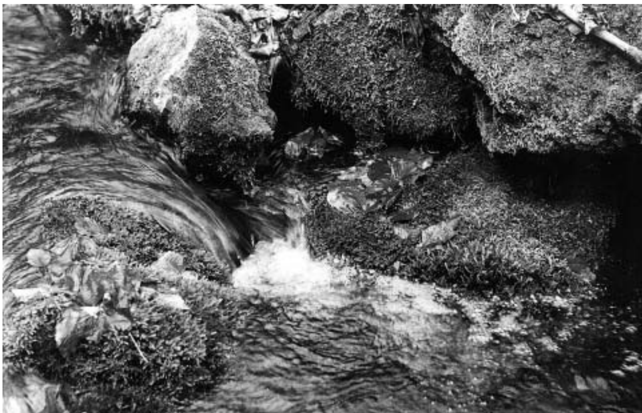
Gecse Atilla: Csobogás