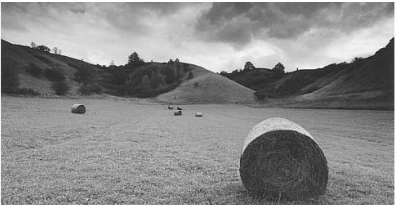
Csomós Árpád: Cseresi táj