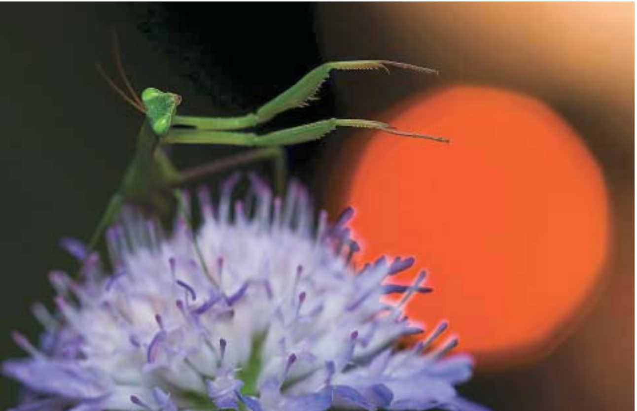
Szőke Attila: A naplemente karmestere