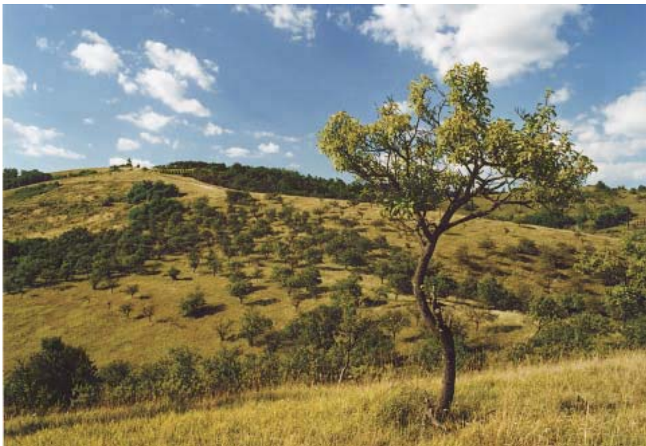
Csomós Árpád: Ember és táj