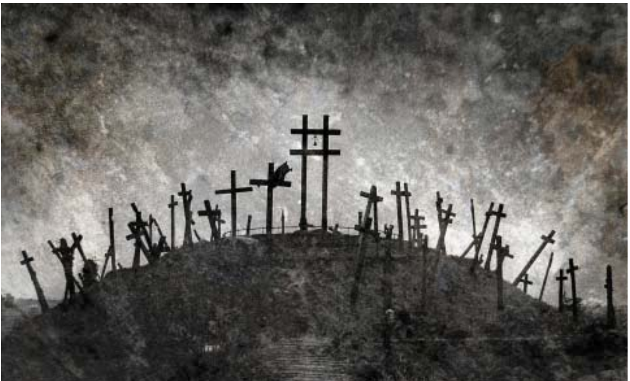
Kovács Attila: In memoriam 1241