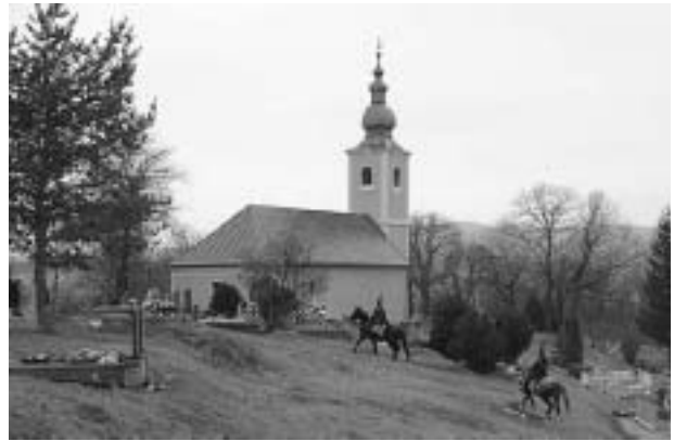
A nagybalogi református templom