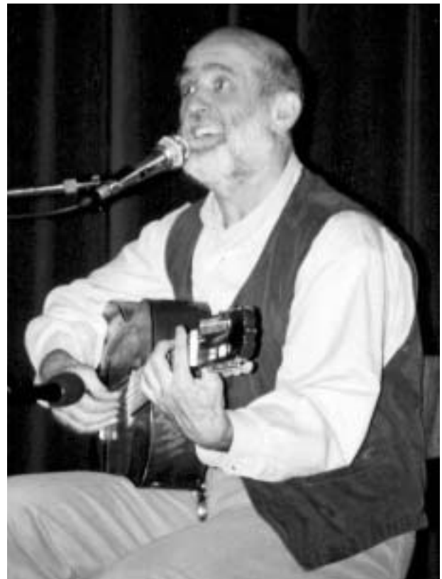
A fesztiválnak vendége volt Gryllus Vilmos is

Igaz otthonra, nagybetűs Otthonra talált a Tompa Mihályról elnevezett nemes versengés Rimaszombatban. Kissé már kívülállóként úgy érzem, a fesztivál kinőtte a háromnapos időkeretet, ezt a keretet viszont az anyagi források korlátozott lehetősége miatt bővíteni egyelőre nem lehet. Nem igazán jó az ugyanis, ha egyenesen az ideérkezés után, fáradtan, szinte minden tér- és technikai próba lehetősége nélkül kellett az énekelt és megzenésített versek kategória versenyzőinek – szó szerint – berohanniuk a pódiumra. Kissé nyoma maradt ennek a produkciókon. Az idei verseny egyik nagy előnye az volt – ami azonban óriási terhelést jelentett egyben a zsűrinek –, hogy mindenki mindent láthatott, hallhatott. Ehhez azonban odafigyelés kellett. A töményen adagolt élmények után beszélgetésre alig, vagy egyáltalán nem maradt energia a résztvevőkben. Szakmai színvonalról a zsűrinek lenne jogosultsága nyilatkozni. Ami reménykeltő, hogy az első és a második kategória versenyzői közt új, eddig soha nem látott, hallott tehetségek mutatkoztak meg, kedveségük, bájuk élvezetessé tette a versenyt. Az idei harmadik kategória azonban némi csalódást okozott nézőnek, zsűrinek egyaránt. Ennél a korosztálynál a szövegválasztás és a kamaszkor specifikussága miatt nagyon nehéz megfelelő szöveget találni. A középiskolások korosztályában is megfigyelhető volt, hogy szinte kivétel nélkül mindegyik versenyző komoly, komor verset választott, ami nem lenne