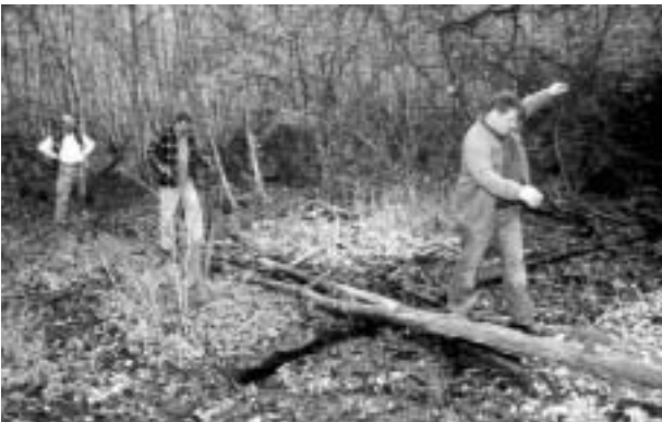
Az országnagyok - szó szerint - ingoványos talajra léptek. Kirándulás a keleméri Mohosoknál