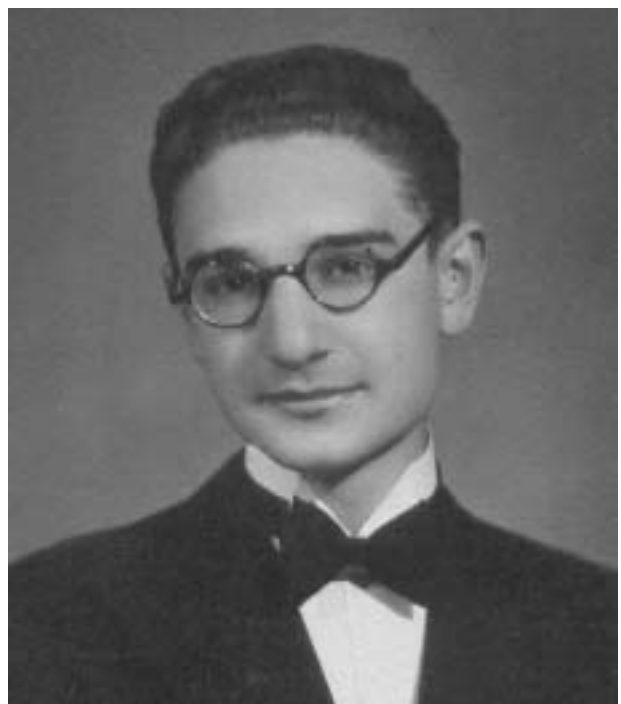
Az érettségiző fiatalember (1937)