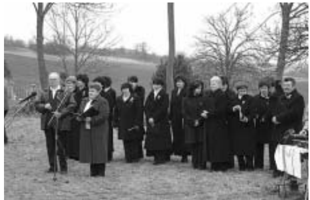
Az avatóünnepség résztvevői