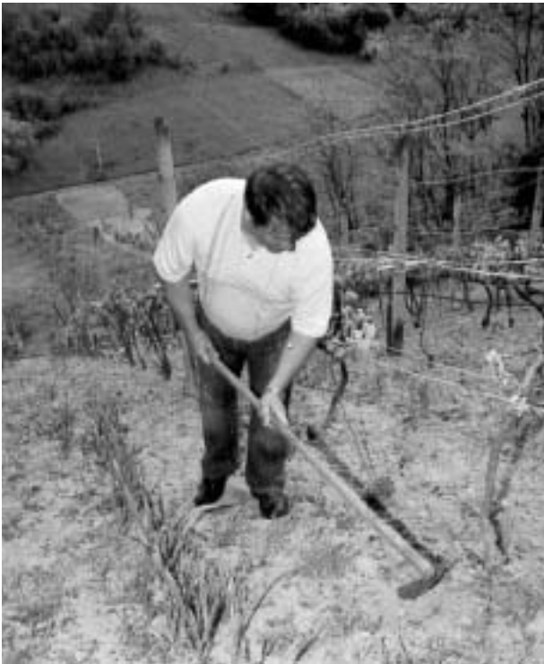
A király kapál...