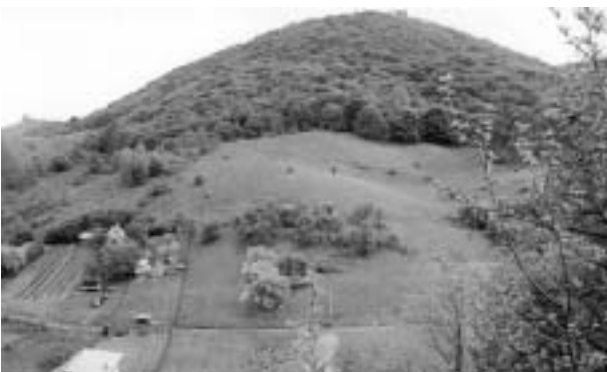
A kisfalusi szőlő a serki vár tövében