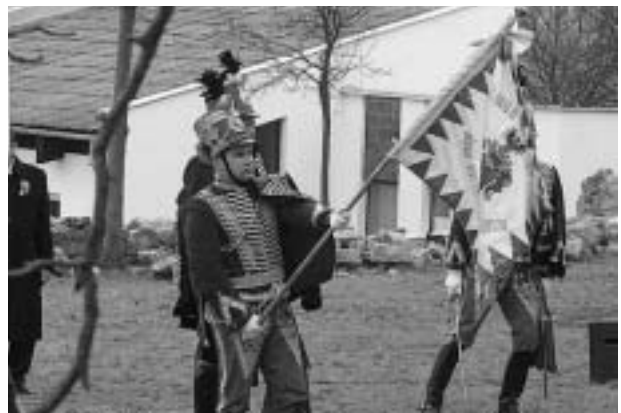
Az ózdi huszárok a zászlóval