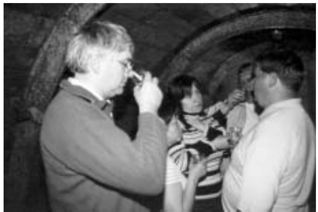
A pincét látogató országnagyokat a király a szőlőbe invitálta