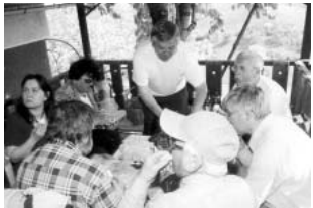
Az éhüket csillapító országnagyok...