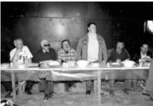
Gömörország képviselőit a serki önkormányzat is fogadta