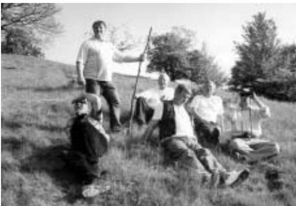
Az ország szemrevételezése a serki Egyfától