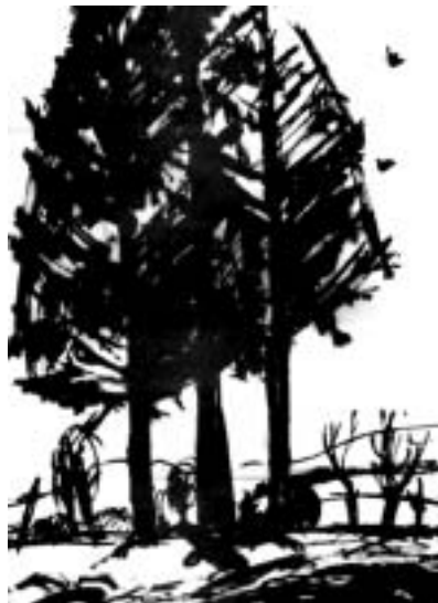
Dúdor István: Fenyők a dereski temetőben, tus, papír