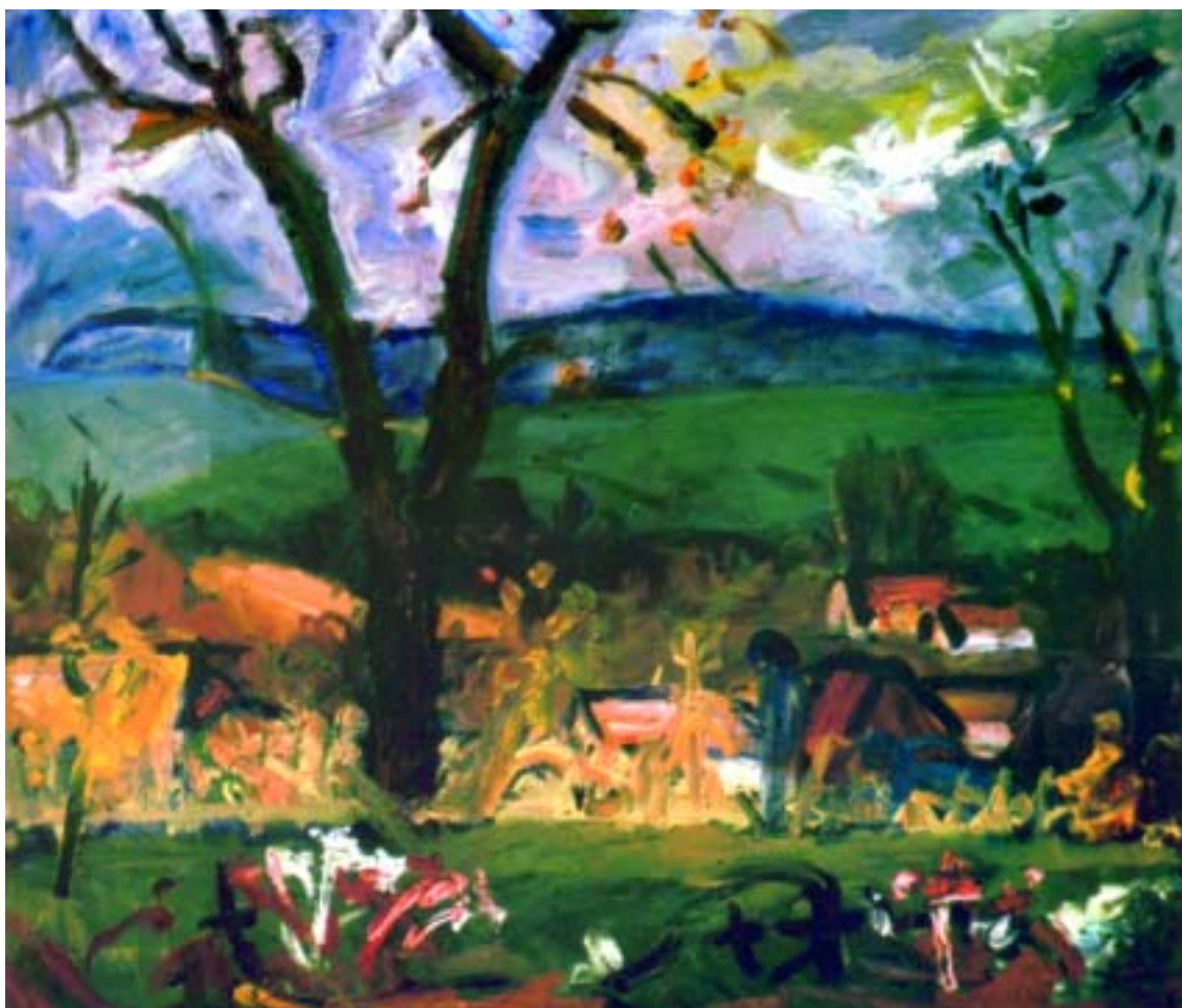
Deresk ősszel a temetőből, 1979, olaj, vászon