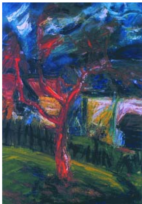
Tűzfa, 1987, kombinált technika