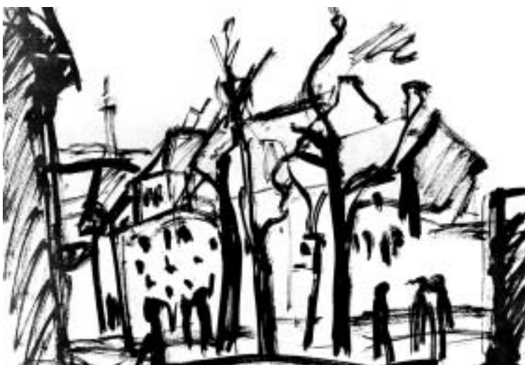
Dúdor István: A Kampa-szigeten, 1976-77, tus, ecset