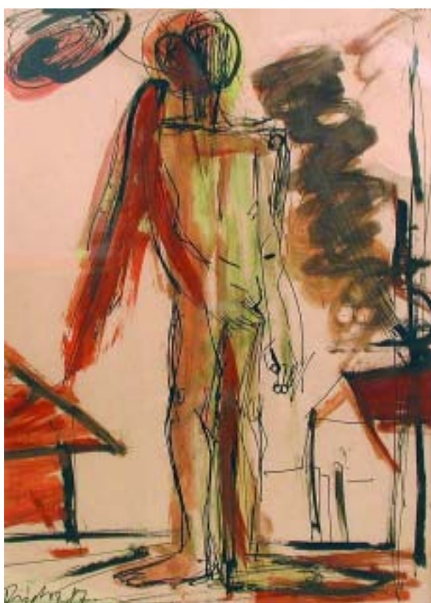
Félszárnyú angyal, 1987, tempera, tus, sárga papír