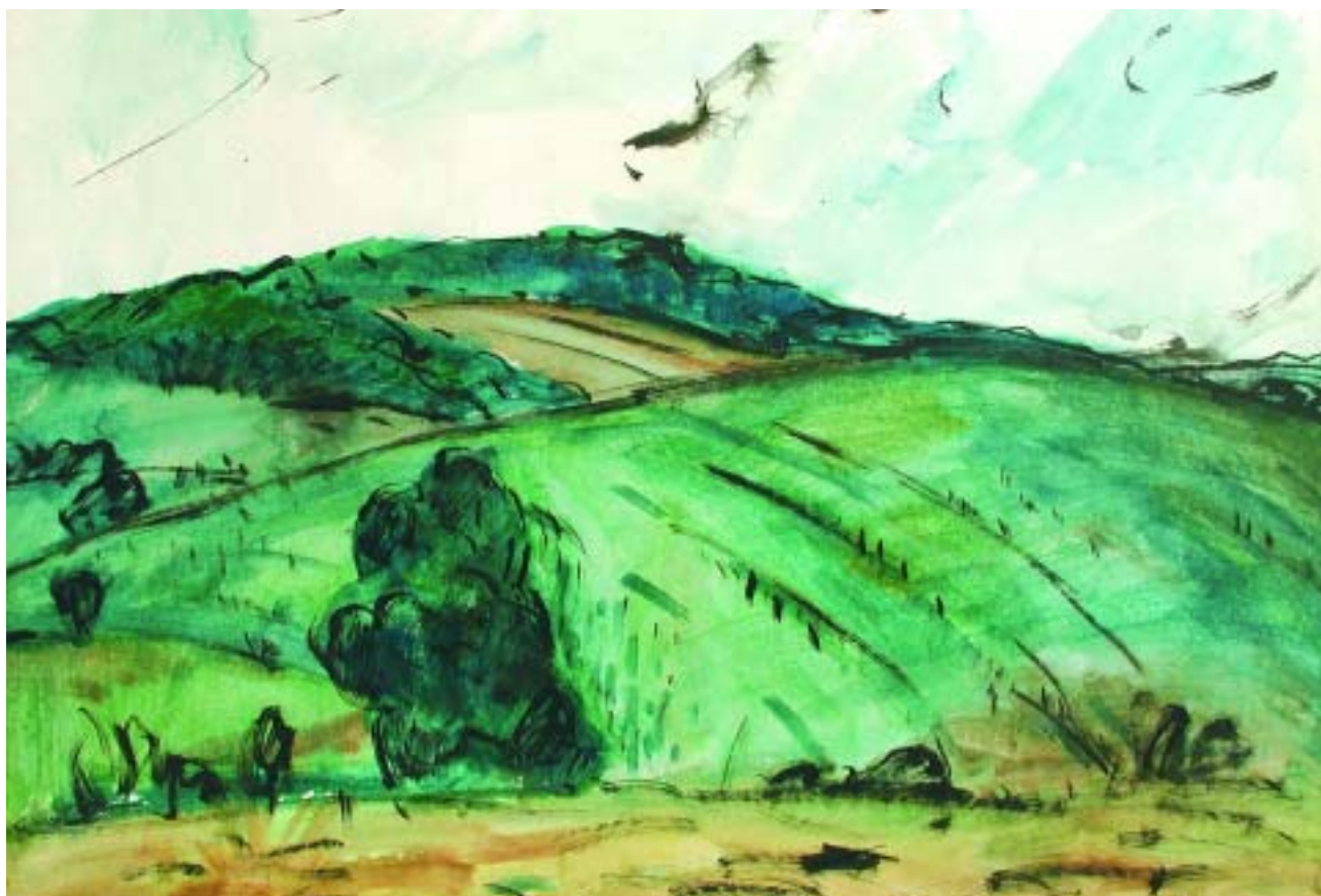
Gömöri dombok, 1986–87, akvarell, rajzlap