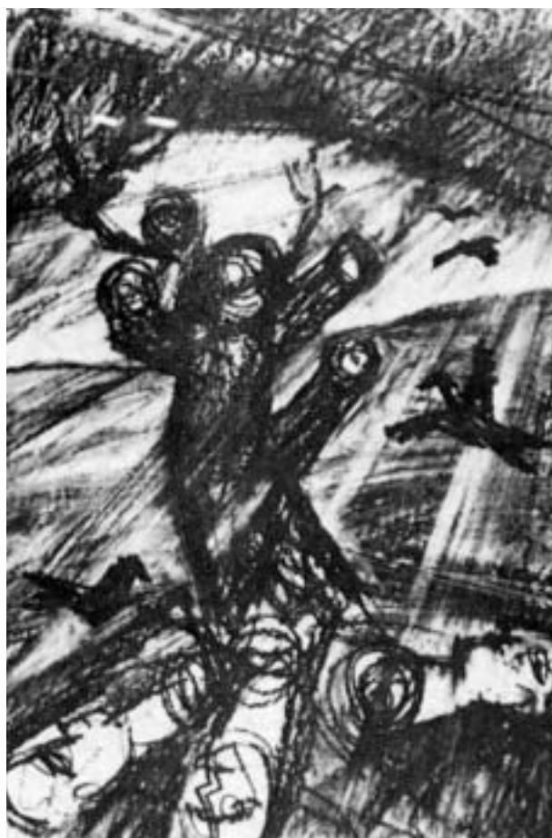
Dúdor István: Gömöri ballada I.

Aztán a végzet másképp döntött. Egy reggel a korán munkába siető emberek találtak rá a földre zuhant Ikaroszra.