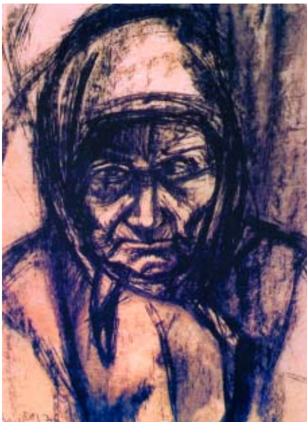
Nagyanyám, 1970, szénrajz, papír