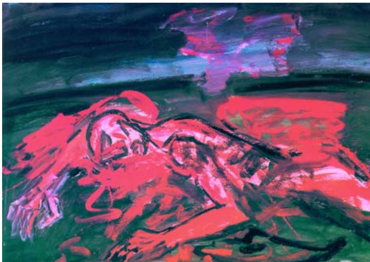
Ikaros, 1981, tempera