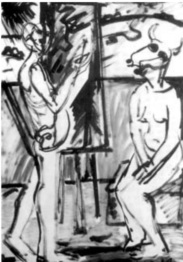
Dúdor István: Festő és modellje, 1981, ecsetrajz, papír