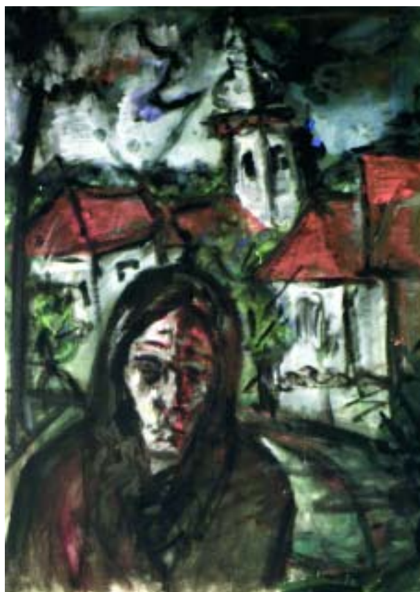
Dereski látomás 1984–85, tempera, papír