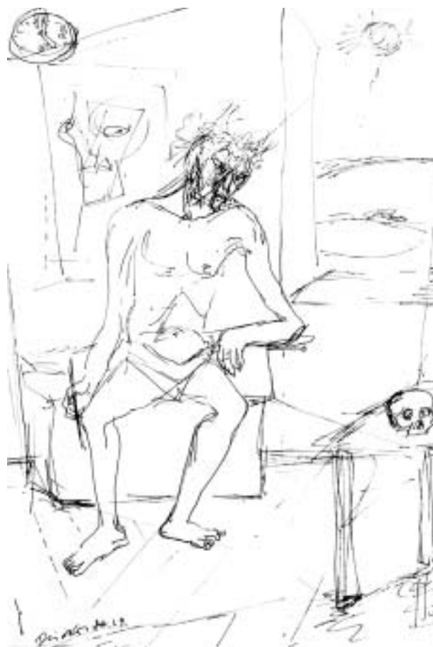
Dúdor István: Ecce Homo , 1987, tollrajz, papír

Nagy csodálattal tanulmányozta a művészettörténet nagyjainak alkotásait. Tizian és Rembrandt festészetét,