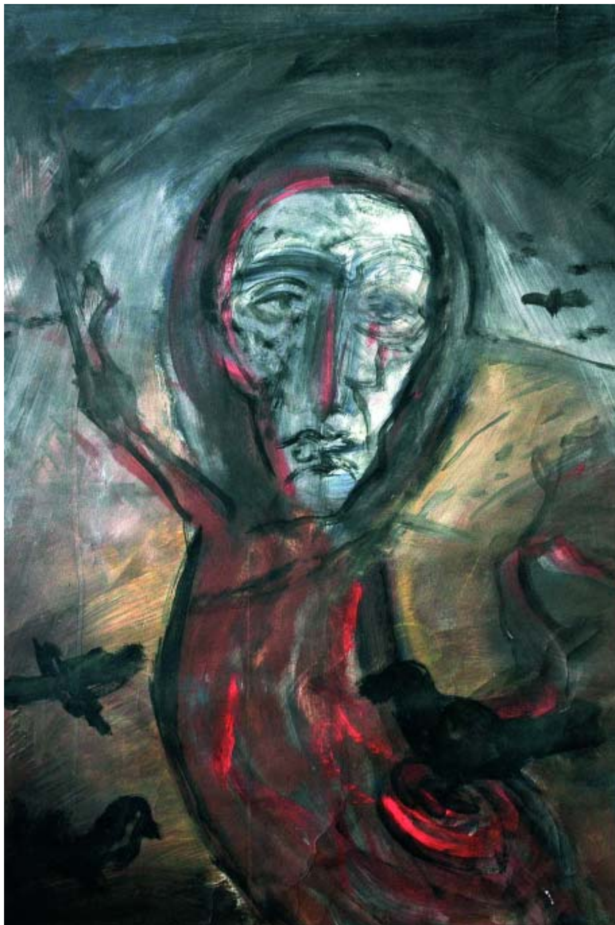
Gömöri ballada, 1977, tempera • Zdeněk Malotínský reprodukciója