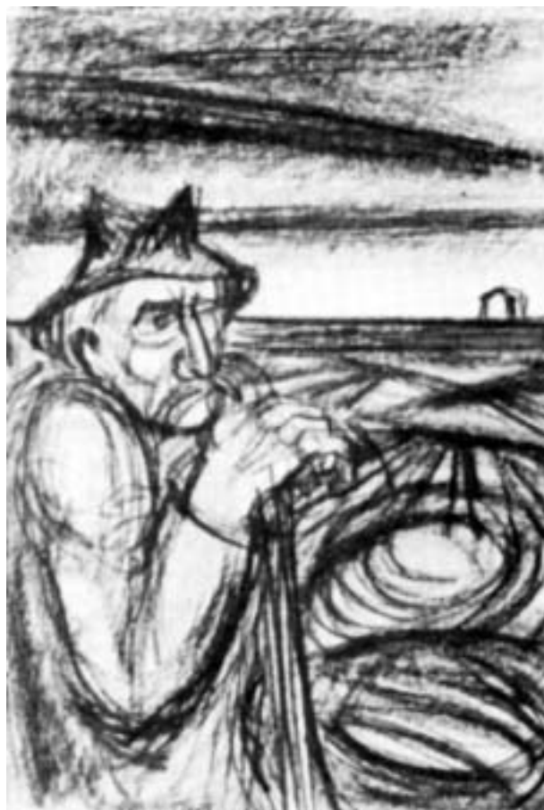
Dúdor István: Támaszkodó gömöri paraszt, 1970 k., szénrajz

Az 1968-69-es Dereski feltámadás pasztellel színezett szénrajzán is a harsonás figura viszi a megváltás, a szebb és boldogabb lét hírét. A mű a festő szülőfaluja iránti