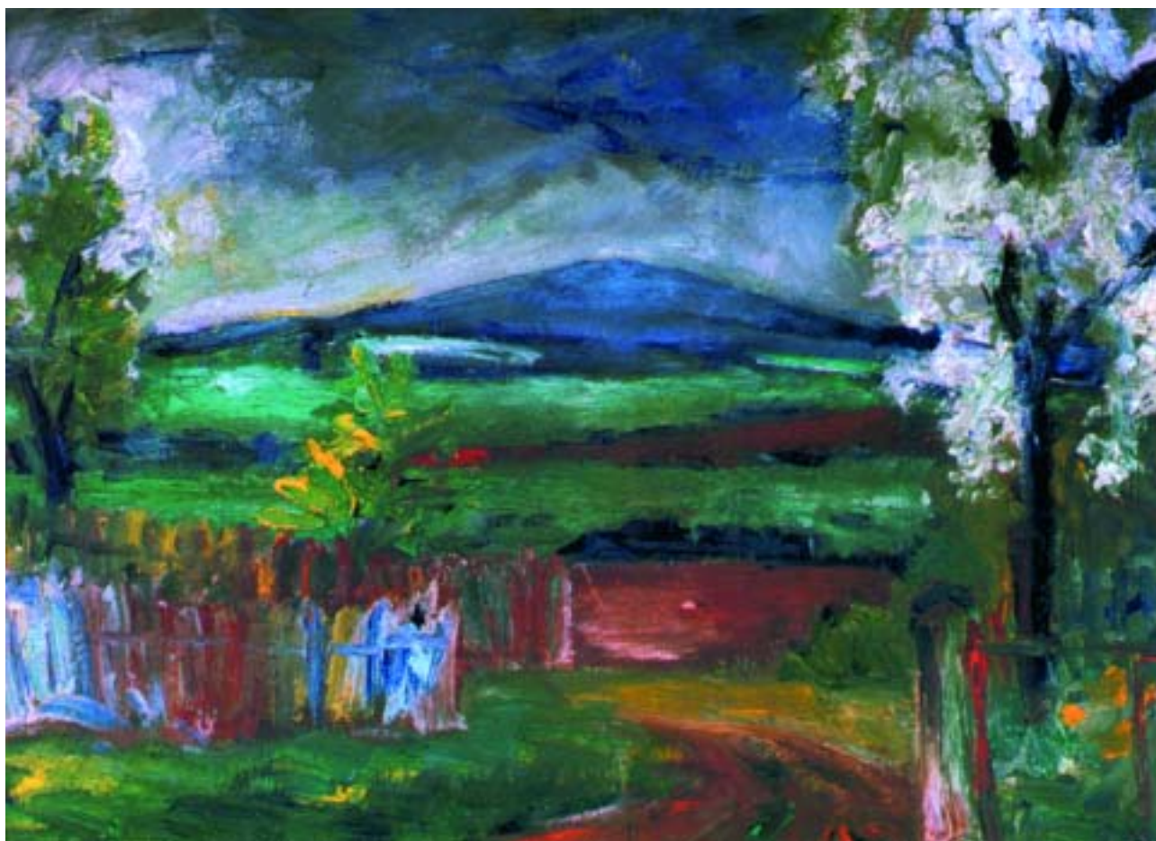
Virágzó fák, 1977, olaj, farostlemez