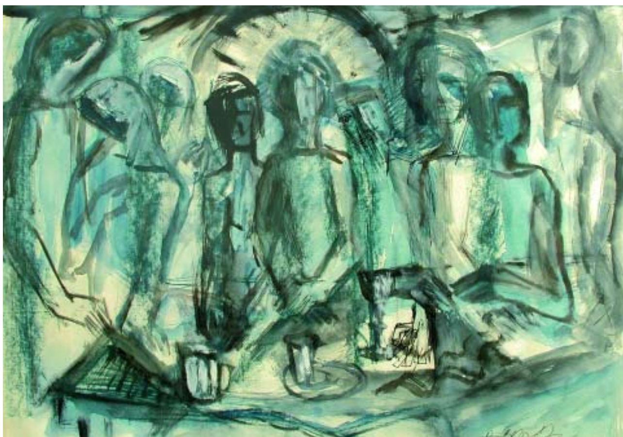
Utolsó vacsora, 1987, színezett tollrajz