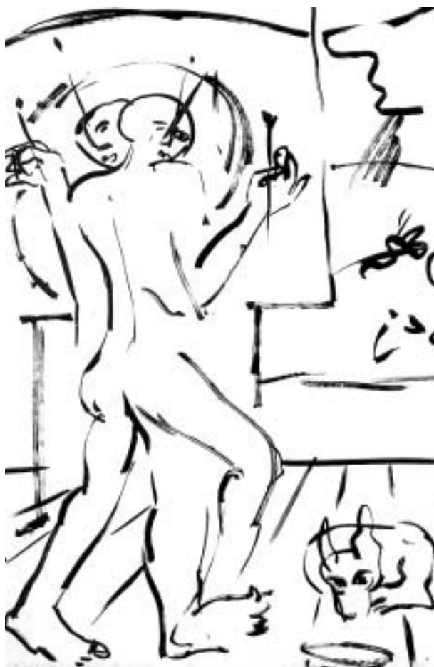
Dúdor István: Rajz, 1979, tus, papír