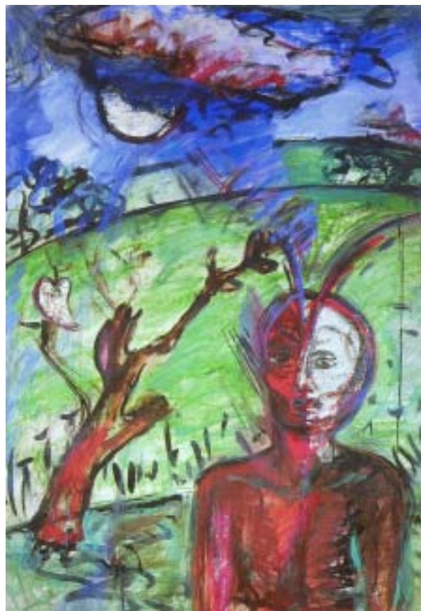
Gömöri festő, 1979, tus, tempera