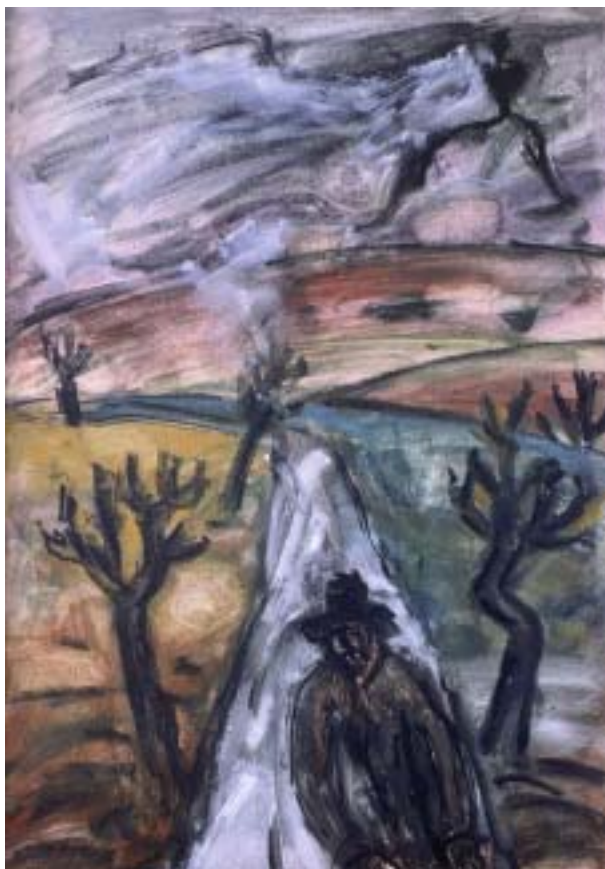
Úton, 1979-80, tempera, olaj