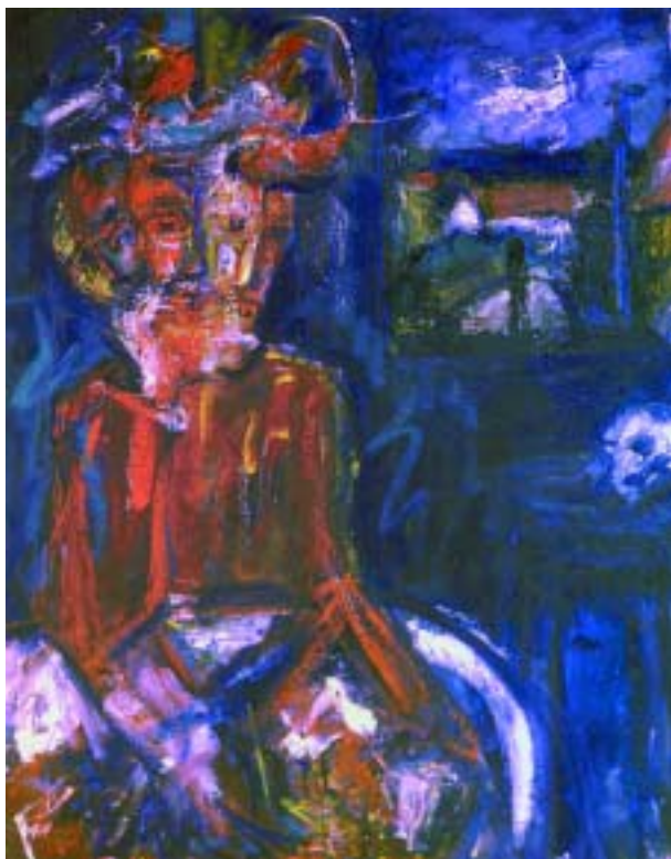
Az egylényegű hármasság (A festő), 1978, olaj