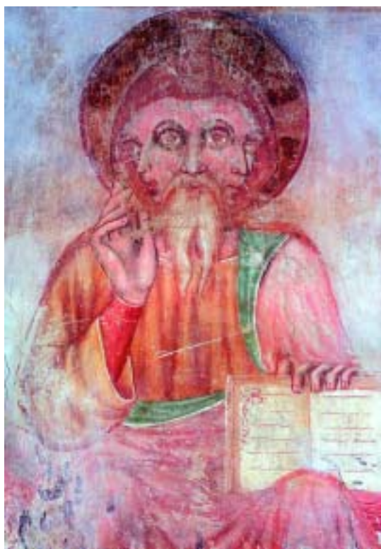
Az Istenhármasság ábrázolása a rákosi templomban (XIV. sz.)