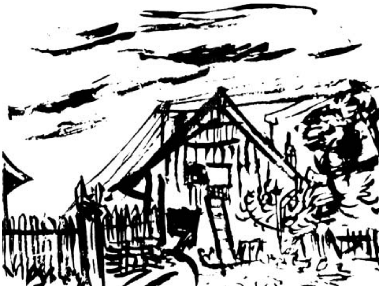
Dúdor István: Régi házunk a Dreha alatt, 1963, ecset, tus

Együtt járták a Deresk környéki erdőket, dombokat, mezőket; együtt rajzoltak, festettek, Bacskai könyvekkel látta el, felnyitotta a szemét és a lelkét az egyetemes kultúra felé. Ugyancsak Bacskai korrigálta első munkáit. Őáltala jutott el Dúdor István Losoncra Szabó Gyulához . Vitte kötegnyi rajzát, s remegő lélekkel várta a szlovákiai magyar kulturális élet egyik nagy alakjának véleményét. Szabó Gyula az akkortájt ébredező, önmagát keresi szlovákiai magyar értelmiség egyik eszmei bástyája volt. A fiatal törekvések iránti nyíltsággal, lelkesedve fogadta az ifjú tehetséget. Jótanáccsal, intelmekkel látta el. Dúdor számára Bacskai és Szabó a művészember ideálját testesítették meg. Művészi magatartása kialakításában ők voltak a példaképei. Tanulmányozta ugyan a műveiket, de kezdettől fogva a saját útját járta. Néhány korai művén láthatunk bacskais megoldású tájelemet, Bacskai Béla és Szabó Gyula esetében azonban a két festő programja, a felvállalt művészi, emberi küldetés volt számára a vonzó példa. Az, hogy Nógrádban és Gömörben, a Medvesalján is sikerüljön egyetemes művészetet teremteni, segíteni az itt élő népet önismeretének kialakításában, felismerni és tanítani értékeit, hagyományait, nyelvezetét.