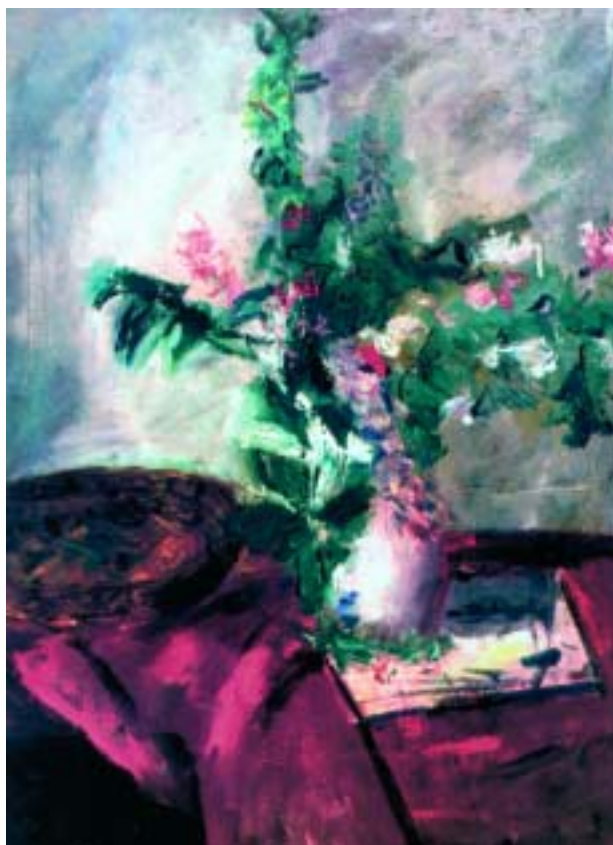
Virágsendélet, 1984, olaj, vászon