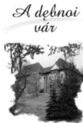
A debnoi várat bemutató füzet címlapja

1948-ban ünnepélyes keretek közt megemlékeztek az 1848–49-es forradalomról és szabadságharcról, felmerült a Tarnóvi Magyar Baráti Társaság életre hívása, de sajnos az akkori kommunista hatalom minden ilyen irányú tevékenységet betiltott. 1956-ban a magyar október idején a Lengyel Vöröskereszt nél Tarnówban társadalmi szervezésben létrejött a Magyarok Segítségnyújtási Bizottsága, amely 1956. december 6-án átalakult Tarnóvi Magyar Baráti Társasággá . Már több mint 50 éve munkálkodik a Társaság a lengyel-magyar kapcsolatok elmélyítésén. Az ő erőfeszítéseiknek köszönhető többek között, hogy a tarnóvi múzeumban állandó kiállítást szenteltek Bem apónak és a lengyel-magyar kapcsolatoknak, hogy Bemnek szobrot emeltek, hogy Balassi emléktáblát avattak Debnó