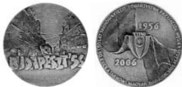
56-os emlékérem elő- és hátlapja