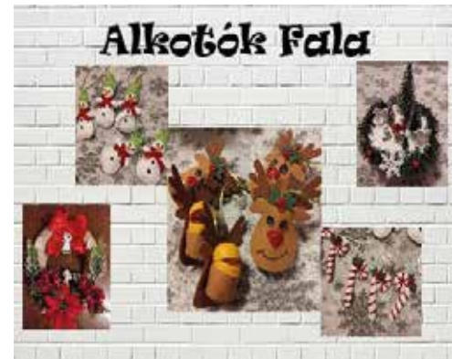
Szegedi Anikó alkotásai