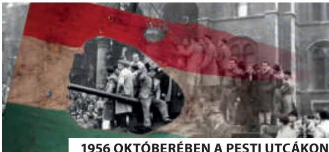
1956 OKTÓBERÉBEN A PESTI UTCÁKON

Az 1956. október 23-án kirobbant forradalom és szabadságharc hőseire emlékezünk minden évben október 23-án. A járványhelyzet miatt az országos tisztifőorvos ajánlása alapján az idei évben a központi megemlékezés elmaradt. Ettől függetlenül csöndben, de annál nagyobb tisztelettel hajtottunk fejet hőseink emléke előtt Eleken.