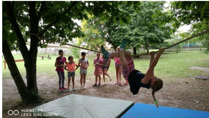
Az elmaradhatatlan júniusi akadályverseny.