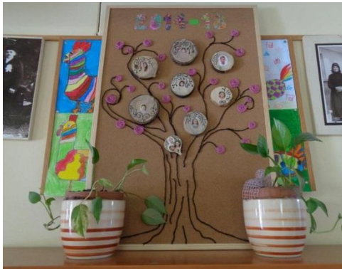
Búcsúzó 4. osztály tiszteletére készült alkotás.