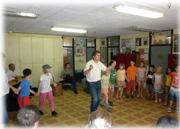
Mesék, koncert majd táncház a Kákics együttesel. Negyedszer volt vendégünk a nagyszerű zenekar.