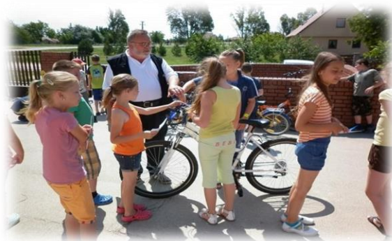
Madarak és fák napi akadályversen. Az első helyezett csapat.