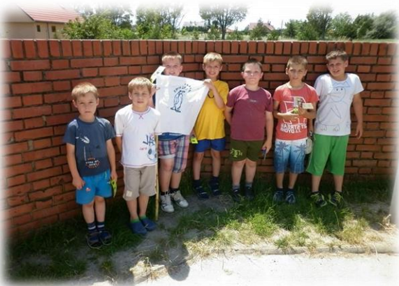
Diák önkormányzati nap a Bársony István tagiskolában.