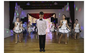
T. T. Dance jótékony-sági bál (7. oldal)