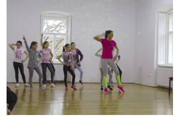
Kultúrházak éjjel nappal (3. oldal)