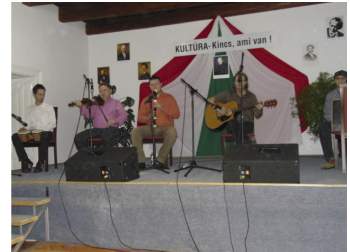
Magyar Kultúra napja (3. oldal)