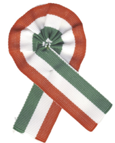
Március 15-i ünnepség (8. oldal)

A Közelgő Nemzetközi Nőnap alkalmából jó egészséget kívánunk Tarcal valamennyi hölgy polgárának!