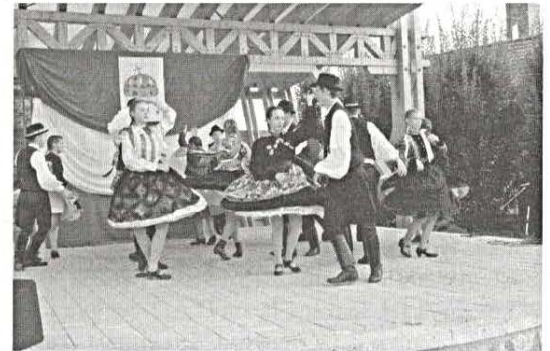
Augusztus 20-i ünnepség 2. oldal