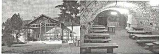
Sportszerű és eredményes versenyzést kívánunk!!

Sakkorákat, készleteket a rendezők biztosítják A versennyel kapcsolatban a változtatás jogát a rendezők fenntartják.