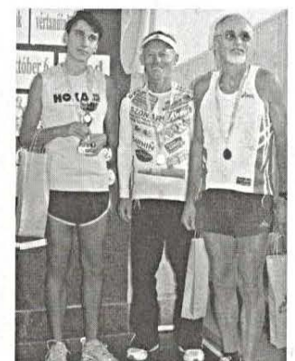
Verseny- felhívások 8. oldal