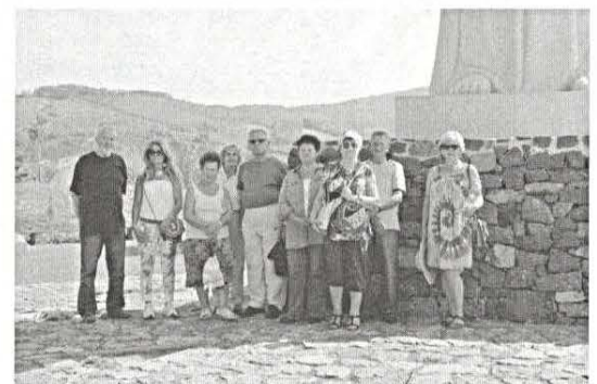
HAT - MAIT alkotótábor Tarcalon 4. oldal