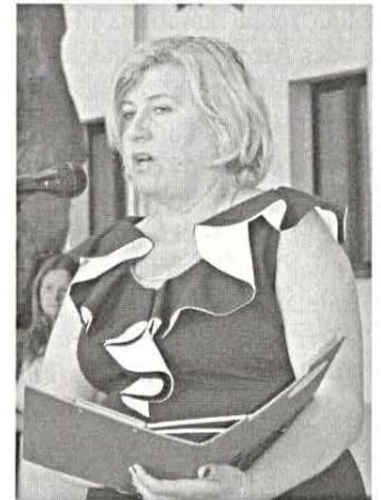
Tanévnyitó 3. oldal