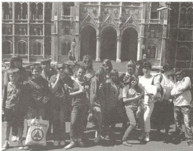
Tarcali diákok a Parlament előtt