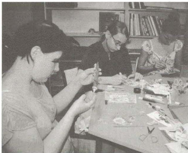
Készülnek az ajándékok az édesanyáknak